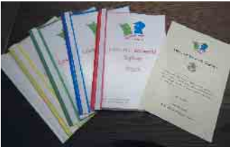
Mundartdiplom 2024.

Alle Gäste waren begeistert von dem, was „Saach hür ens“ auch sonst noch zu bieten hatte. Traditionell bedienten Vorstandsmitglieder und deren Ehepart-ner*innen die Seminaristen mit Kaffee und Kuchen ebenso wie am Ende der dreistündigen Veranstaltung mit einem köstlichen Kölschen Buffet, bei dem es an nichts mangelte und einer Auswahl an Kaltgetränken. Und natürlich erhielten alle am Ende die wohlverdiente Urkunde, das „Loss m’r schwade Diplom“ als Beweis dafür, „datt se met Erfolg an demm Mungkaat -Diplom deeljenomme unn jezeech hatten, datt se sich met unsere Mungkaat usskenne unn se och schwade künne. Ihr/euer „ Saach hür ens“ Lohmar e.V.