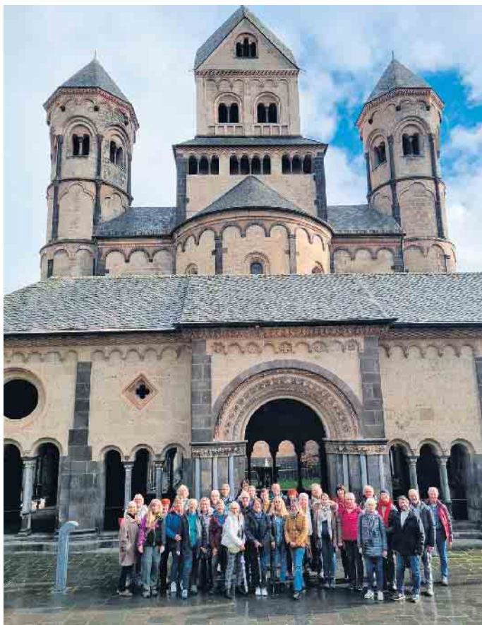
Da Capo in Maria Laach

Felsenkellern von Mendig. Erwartet wurden wir dort von zwei fachkundigen Touristenführern, die uns im Vulkanmuseum Lava Dome viele Informationen über die Vulkanneifel vermittelten. Höhepunkt war danach der Abstieg in die 32 Meter tiefen Felsenkeller. Beeindruckt folgten wir in Höhlenschutzkleidung den Spuren der Entstehungs- und Nutzungsgeschichte. Eine davon, die Nutzung zur Bierfasslagerung, erinnerte uns dann aber an unsere Reservierung in der Felsenkellerbrauerei. Dort stimmten wir uns auch erst einmal wieder gesanglich mit französischen Trinkliedern und rhythmischen Oldies ein, um dann den Abend bei bestem Essen, frischem Brauereibier und fröhlicher Stimmung ausklingen zu lassen. Immer wieder schön - mit Da Capo unterwegs zu sein!