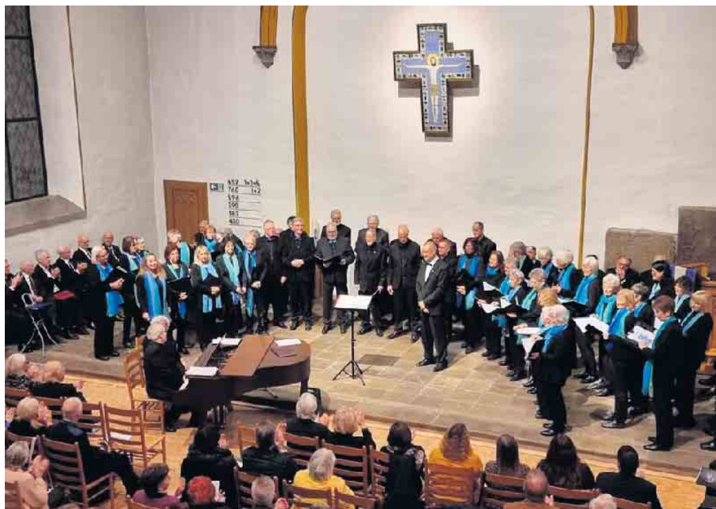
Auftritt in Honrath am 5. November.

Bei „Heal die world“ musste improvisiert werden. Der Solist war erkrankt und musste ganz spon-