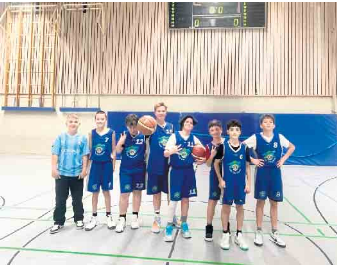
Ein stolzes Team