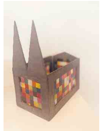
Ein „Dömchen“ aus Wahlscheid

Ab sofort neu für jedermann im Sortiment: Schnäpse von Prinz. Unschlagbare Preise.