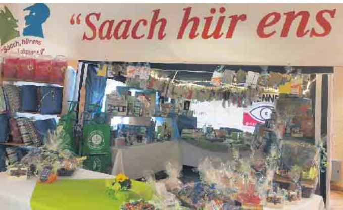
Die traditionelle Tombola ist wieder dabei.

Klein aber fein: Eine faire Ausstellung in der Stadtbücherei