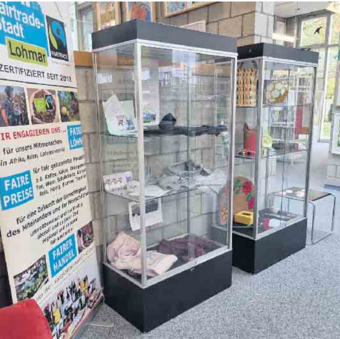
Ein kleiner Eindruck von der Ausstellung