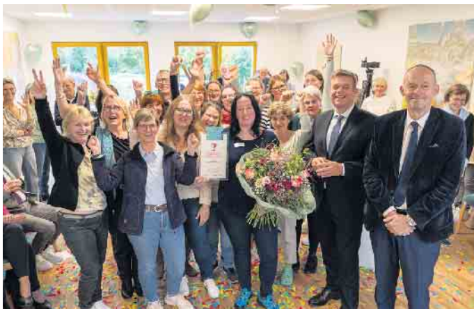
Das Pflegeteam vom Elisabeth-Hospiz bei der Feierstunde.

Mit über 4.200 Stimmen landete das Pflegeteam des Elisabeth-Hospizes auf Platz 1.