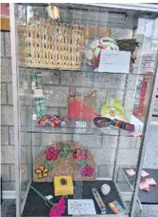
Auslage vom Eine Welt Markt Siegburg e.V.

an Nachhaltigkeit, Regionalität und Fair wird auch das Geschäft Lieblingsstücke in Lohmar, Breiter Weg, mit einem Teil seines Angebots gerecht. Der TuS Birk steht ebenso beispielhaft für andere Vereine, zum Beispiel den TV Wahlscheid. Dort sind auch die Shirts zertifiziert. Ein Faltblatt, ausgehängt zum Lesen und ausgelegt zum Mitnehmen, informiert über und bewertet die verwirrende Vielfalt der verschiedenen Siegel. Es klärt darüber auf, dass nicht alles Gold ist, was glänzt und liefert so eine Orientierungshilfe beim Einkauf. Wenn Sie auf Ihre fairen Angebote in unserer kleinen Ausstellung hinweisen möch-