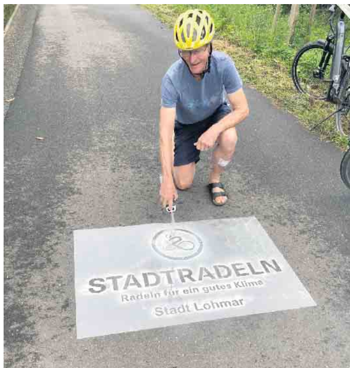
Werbung zum Mitmachen

ligt und 3900 km zur Gesamtleistung beigetragen. Fahrradfahren ist ein Zugewinn für