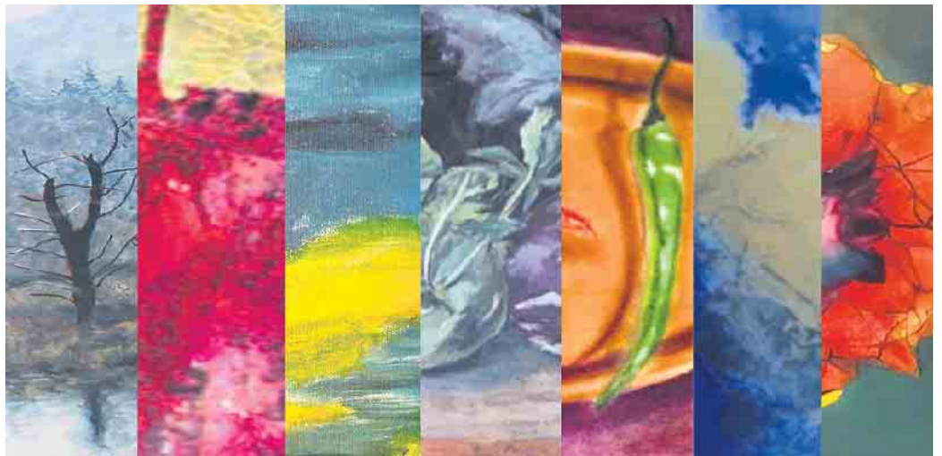
... zeigen verschiedene Stile der bildenden Kunst.