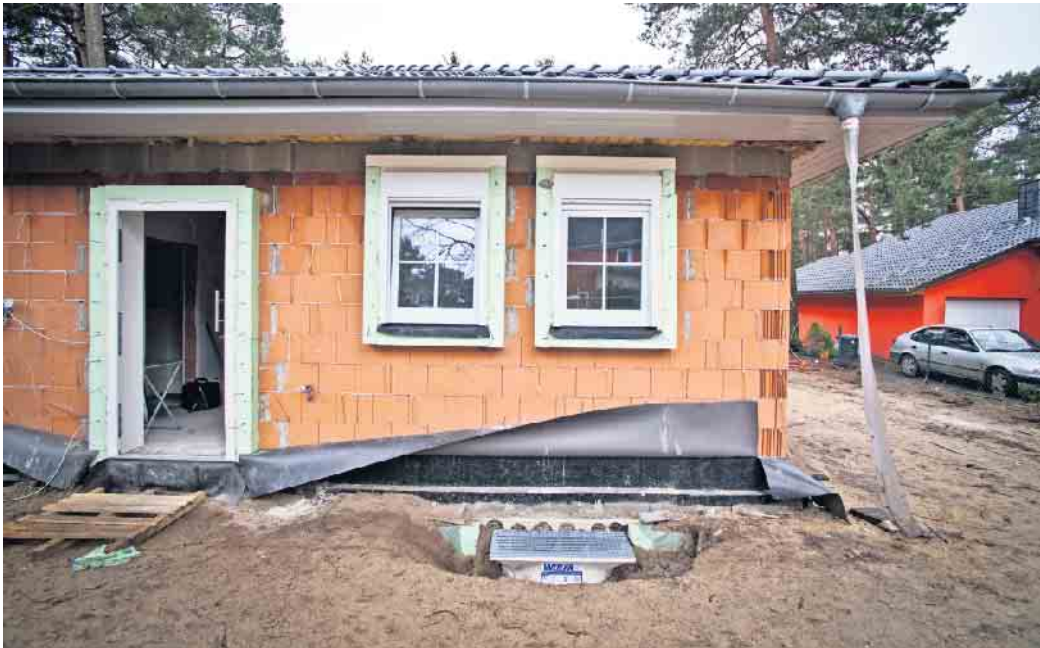
Bereits bevor es mit einem Hausbau losgeht, können Baunebenkosten anfallen.

Bereits beim Grundstückskauf fallen Grunderwerbssteuer und Notargebühren an. Hinzu können weitere Kosten etwa für Baumfäll- oder Abbrucharbeiten, Baustrom- und Bauwasseranschlüsse oder sonstige Baustellenerschließungsarbeiten kommen. Je nach Situation können auch Baugrundgutachten sinnvoll sein, um sich Klarheit über die Baugrundverhältnisse, Grundwasser oder Altlasten im Boden zu verschaffen. Zudem genügen bei manchen Lagen die geschätzten Pauschalen für die Hausanschlüsse nicht.