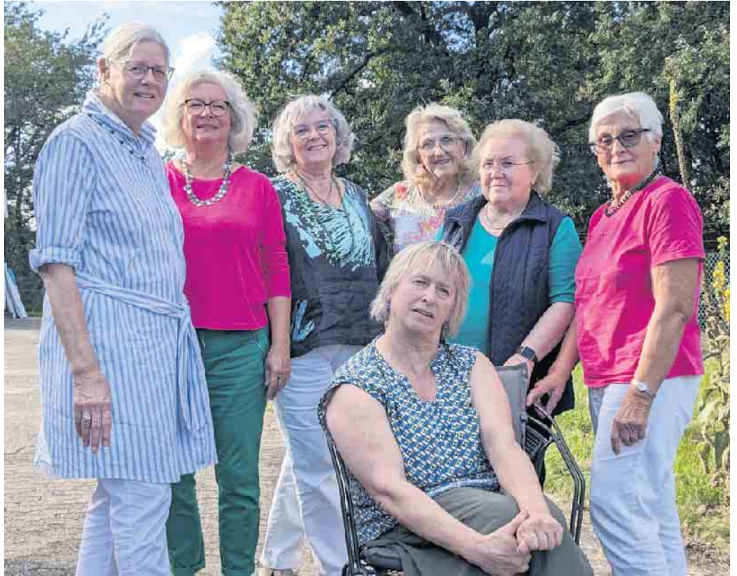
Die 7 Künstlerinnen des Siegburger ‚Treffpunkt Kunst‘...

‚Wir sind so frei‘, Vernissage am Sonntag, 5. November, 11 Uhr, ‚Kunsthalle LohmART‘, Scheiderhöherstr. 42b, Lohmar-Scheiderhöhe. Weitere Öffnungszeiten: Sonntag, 5. November, 11 bis 17 Uhr Samstag, 11. November, 14 bis 18 Uhr Sonntag, 12. November, 11 bis 17 Uhr