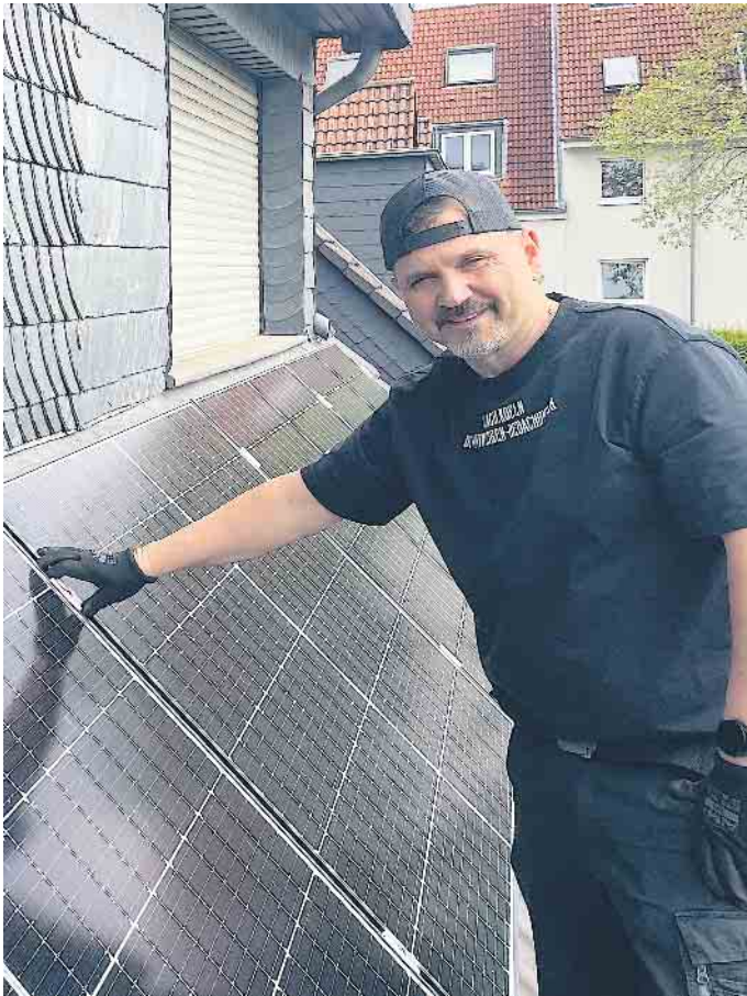
Dachdecker: Ihr Ansprechpartner, wenn es um PV geht.

wissen um die Gefahr: Sie führen eine Gefährdungsanalyse durch, sichern sich vor Absturz und gehen keine Risiken ein. Arbeitsschutzmaßnahmen sind daher unerlässlich. Übrigens: Auch Auftraggebende können haftbar gemacht werden. Es häufen sich Fälle, wo Baustellen wegen Nichtbeachtung von Arbeitsschutzmaßnahmen stillgelegt werden. Das kostet