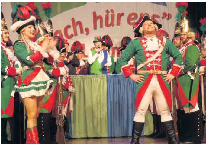
Gute Stimmung bei Saach hür ens.