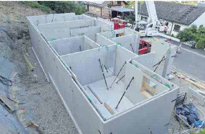
Schwieriger Baugrund muss kein Ausschlusskriterium für Bauherren sein, sondern kann beispielsweise bei einer Hanglage sogar langfristig Vorteile wie eine schöne unverbaubare Aussicht bieten.

fahrung hat uns gelehrt, dass auf so manchem anspruchsvollen Baugrund oft die schönsten Häuser entstehen - sei es in Wassernähe oder auch an einem steilen Südhang. Der Keller ist in diesen Häusern sogar mehr als ein sicheres Fundament. Er ist ein echter Zugewinn an Wohnfläche und Wohnkomfort.“