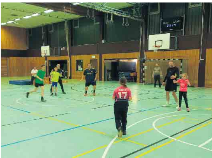
Aus der Jabachhalle.

Es wird komplett auf Körperanriff verzichtet, das lässt uns in neuen Gruppen spielen. Dieser Sport hat sich bei uns zu einem Familiensport entwickelt. Es kommen die Erwachsenen zu uns die vielleicht 10 oder 15 Jahre keinen Sport mehr gemacht haben, aber auch Papa und Mama, die einfach gemeinsam mit Ihren Kindern eine gemeinsame Aktivität gesucht haben. Ein tolles Spielerlebnis für die ganze Familie von 9 bis 99 Jahren. Wie viel Wolf steckt in Dir? Finde es beim nächsten Training heraus: Freitag Jabachhalle von 20 bis 21 Uhr