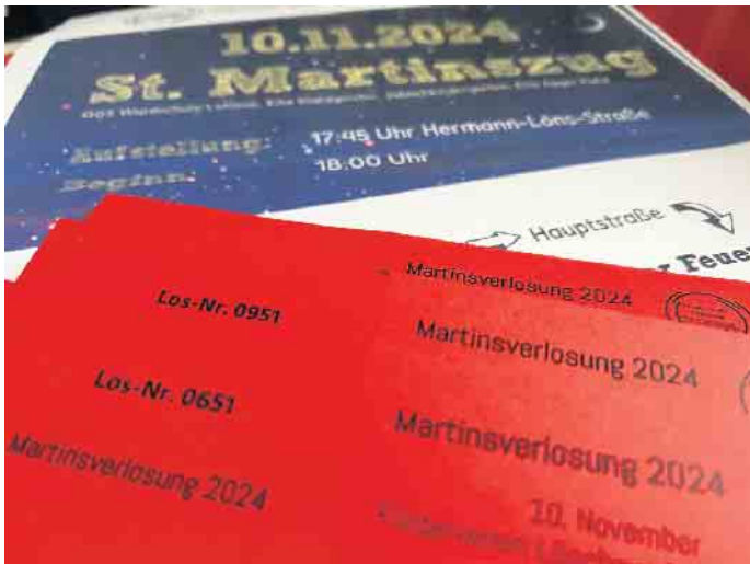
Die Lose sind ab sofort erhältlich.