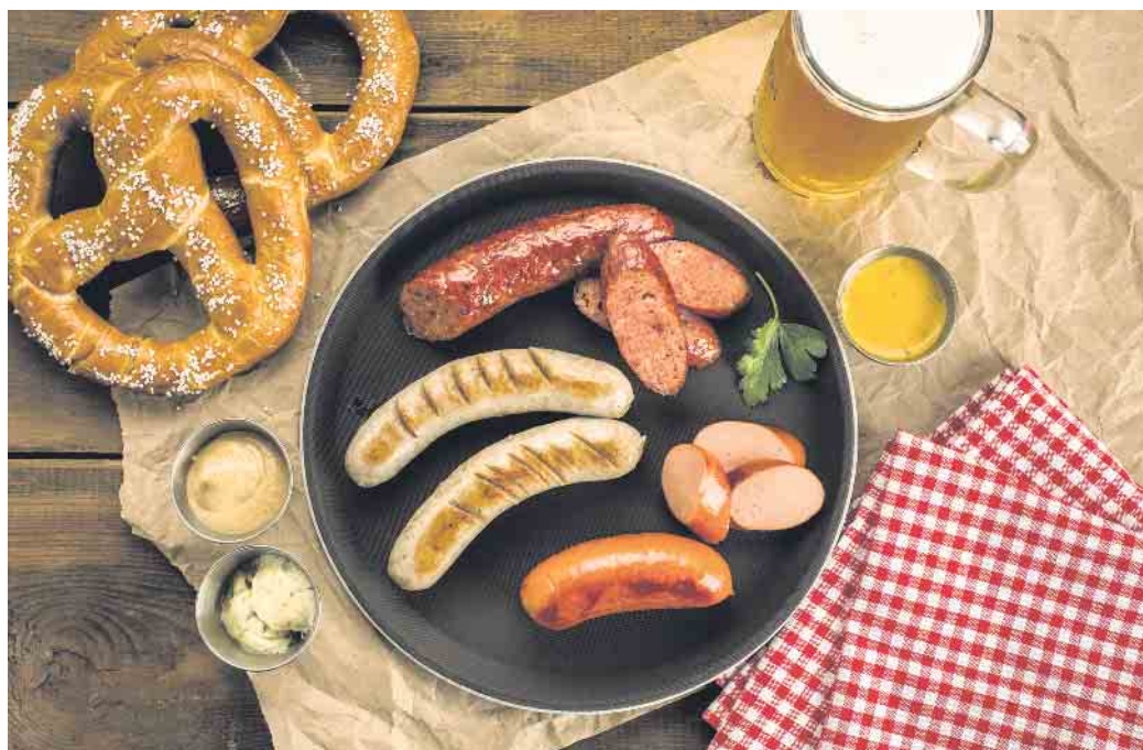
Eine natürliche Hülle verleiht jeder Wurst ihr individuelles Aussehen, ist luftdurchlässig, bringt den Geschmack voll zur Geltung.

Nicht aus dem Kühlschrank auf den Rost: Kommen die Bratwürste direkt aus dem Kühlschrank auf den Grill, könnten sie außen leicht verbrennen, während sie innen noch nicht ganz gar sind. Deshalb lässt man sie etwa 20 Minuten bei Raumtemperatur liegen, bevor sie gegrillt werden. Temperatur: Zunächst wird der Grill auf mittlere Hitze - zwischen