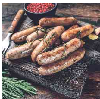
Umfragen zufolge gehören bei sieben von zehn Personen Bratwürste beim Grillen einfach dazu.

Garzeit: Vorgebrühte Würste können nach sechs bis sieben Minuten serviert werden, rohe Bratwürste im Naturdarm dauern mit zehn bis zwölf Minuten etwas länger. (akz-o)