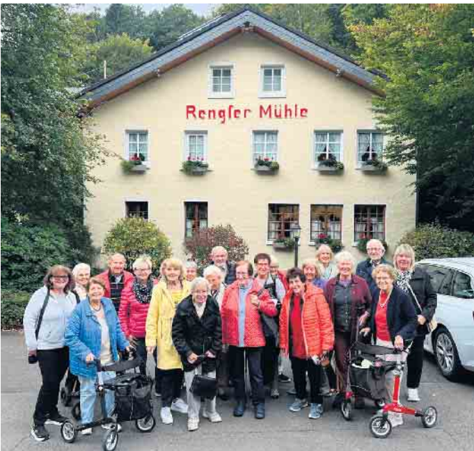
In der Rengler Mühle: Kulinarischer Abschluss eines interessanten Ausflugs ins Bergische Land

süßen Leckereien war für jeden Geschmack etwas dabei. So fand der Ausflug einen genussvollen und fröhlichen Ausklang.