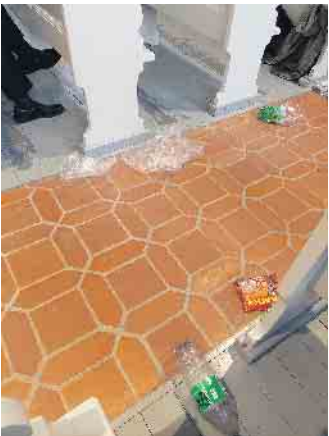
Text und Bilder: Nicole Swerbinka

oder die Liedzeile „Es ist nicht Deine Schuld, dass die Welt ist, wie sie ist; es ist nur Deine Schuld, wenn sie so bleibt.“ Wir haben es in der Hand unsere Welt für unsere Nachkommen zu erhalten - es darf nicht sein, dass die Jüngsten - sowie der kleine Felix im Gottesdienst - hinter uns aufräumen müssen.