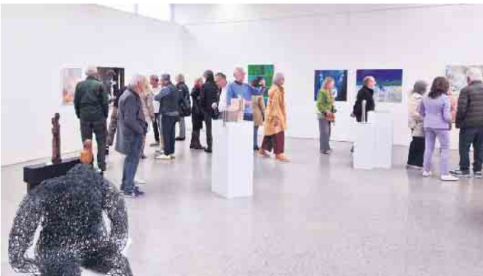
...und gingen sehr angetan durch die Kunsthalle in Scheiderhöhe.