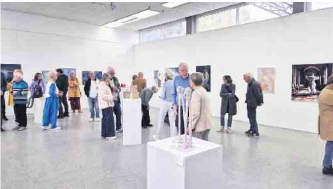
Erfreulich viele Besucher kamen zur Eröffnung der LohmART-Jahresausstellung...

LohmART-Jahresausstellung begeisterte Besucher