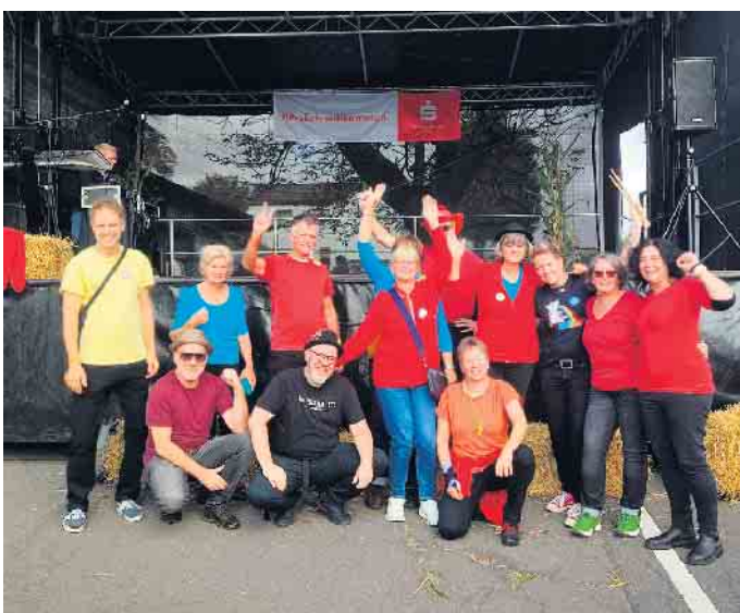
Beim Erntedankumzug in Scheid sorgte die Sambagruppe „Agger Groove“ mit mitreißenden Rhythmen für beste Stimmung.

stellen zu lassen: „Die Mitarbeit im Behindertenbeirat ist eine wertvolle Chance, die Stadt aktiv inklusiv mitzugestalten.“