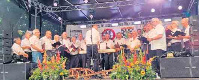
Auftritt Kirmes Wahlscheid

Jahreskonzert MGV Eintracht Honrath-Overath in der ev. Kirche Honrath