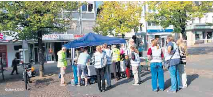
Warten auf die Waffeln

Im Repertoire des Frauenchors Harmonie Honrath, geleitet von Josephine Pilars de Pilar präsentiert der Chor mehrfach prämierte fremdsprachige Kompositionen wie u.a. von „Harry Warren/Jack Brooks“, „Christophe Barratier/Bruno Coulais“ und „Udo Jürgens/Arr. P. Thibaut/P. Schnur“. Gesamtleitung des Konzerts hat Musikdirektor F.D.B. Rolf Pohle Einlass: 16.30 Uhr / 2. November , ev. Kirche Honrath, Karten erhalten Sie bei den Sängerinnen und Sängern der beteiligten Chöre oder unter Tel. 02205/84851. Die Sänger des Männerchors würden sich freuen, wenn Sie unseren Termin wahrnehmen könnten.