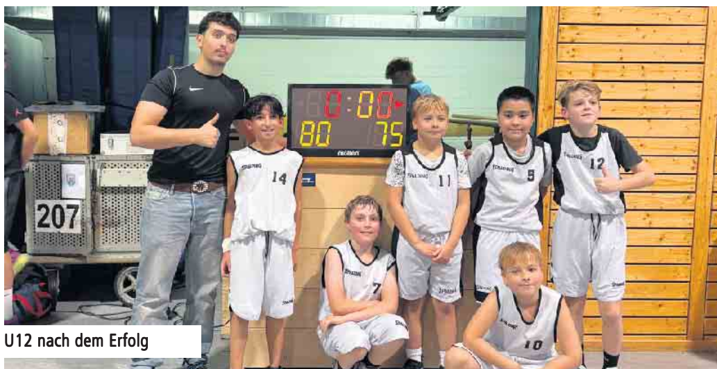
U12 nach dem Erfolg

Ihr erstes Spiel der Saison bestritt die U12 mit sechs Spielern, darunter drei absoluten Neulingen, gegen die Baskets Bonn 4.