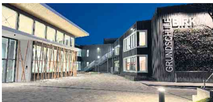
Die neue Gemeinschaftsgrundschule Birk wurde vom Land Nordrhein-Westfalen ausgezeichnet.

im Rheinland, die im September vom NRW-Wirtschaftsministerium und NRW.Energy4Climate prämiert wurden. Die Schule verbindet nachhaltiges Bauen, innovative Energiekonzepte und pädagogische Qualität.