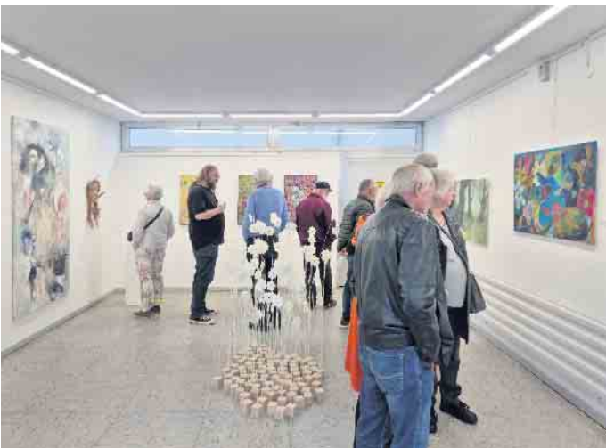
Es wurde über ber die Vielfalt an Kunstwerken gestaunt.

Mit durchweg positiver Resonanz endete die Mitglieder-Jahresausstellung des Kunstkreises LohmART e.V. in Scheiderhöhe bei bisher höchsten Besucherzahlen. Die 14 Aussteller:innen ließen bei ihren abwechslungsreich präsentierten Werken zum Thema „Zwischen den Welten“ kaum eine Möglichkeit der Bildenden Kunst aus. Die Bilder reichte von vielschichtigen, abstrakten und gegenständlichen Malereien, Glasbildern und Keramikbildern, Papierarbeiten und Fotoarbeiten