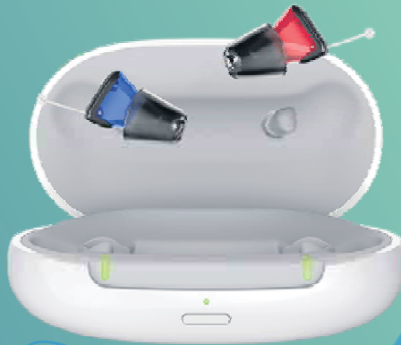
Silk Charge&Go IX