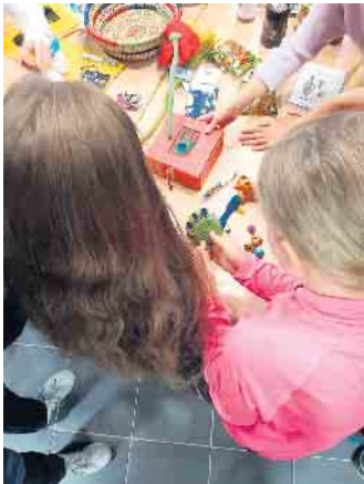
Kinder am Ausstellungstisch