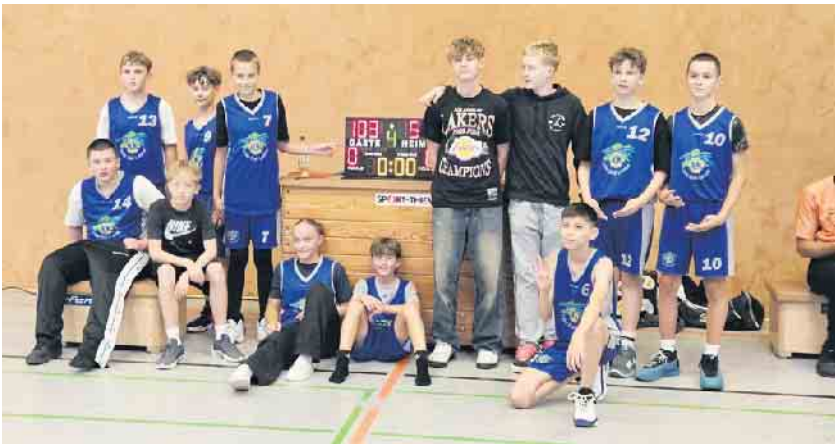
U14 nach dem Erfolg

willt waren, das Geschehen noch Mal aus der Hand zu geben. Gegen einen nun stetig weniger wehrhaften Gegner rollte Angriff auf Angriff, alle Spieler der Lions waren nun eingebunden in die Aktionen und das Team baute bis zur 30. Spielminute den Vorsprung auf 71-32 aus. Das letzte Viertel war dann auf beiden Seiten von geringem Einsatz in der Abwehr geprägt, auf Seelscheider Seite zeigte der Centerspieler etliche schöne Aktionen, auf Lohmarer Seite fielen die 32 Punkte, die das Team allein in diesem Viertel erzielte vorwiegend durch ein schnelles Umschaltspiel - am Ende gewannen die Lions mit 103-54. Die U18.1 trat bei der BG Bonn 2 an, einem der favoriten der Liga. Aufgrund etlicher Ausfälle konnten die Lions nur zu Fünft antreten und es entwickelte