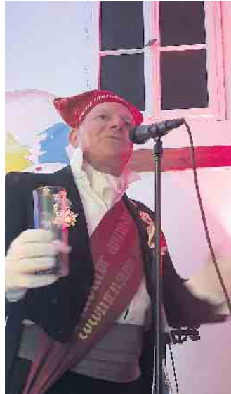
Dä Nubbel.

Und so wurde der ehemalige traditionelle Mitsingabend des Vereins zu einem in Lohmar neuen Event in Form des „Rheinischen Abends“, bei dem mit zunehmender Dauer die Stimmung stieg, sodass die als dreistündige Veranstaltung am Ende fast vier Stun-