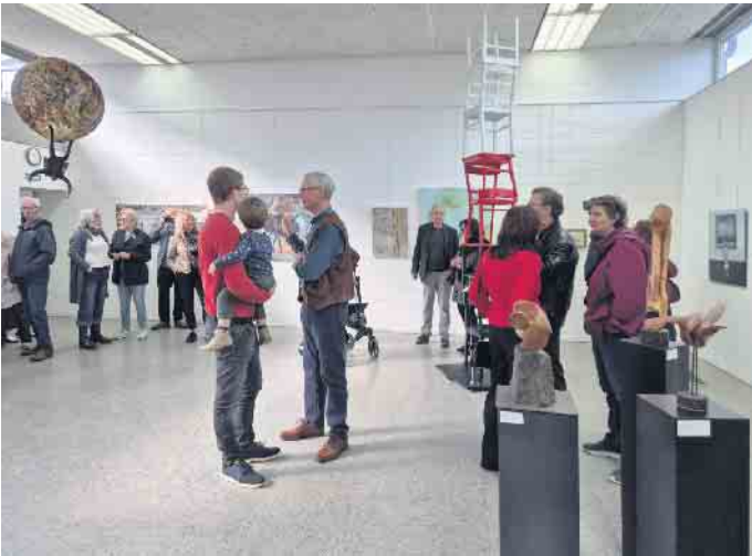
Die LohmART-Jahresausstellung erntete viel Lob.

„Zwischen den Welten“ staunten die Besucher