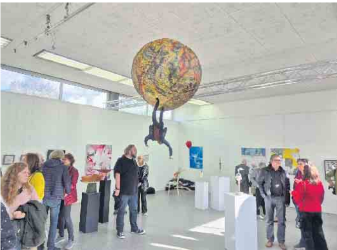
Die Besucher waren von dem hohen Niveau der Ausstellung begeistert.