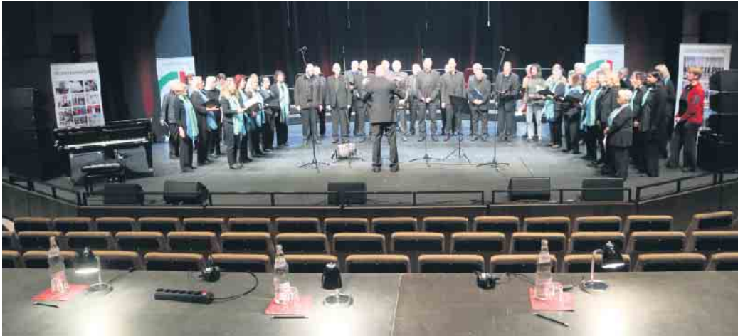
Auftritt Leistungssingen in Witten.

Die Singgemeinschaft Birk trat am Samstag, 23. September zum Leistungssingen des Chorverbandes NRW in Witten an. Dort nahmen über 40 Chöre aus den Kategorien Leistungsschor, Konzertchor und Meisterchor teil. Meisterchor ist beim Leistungssingen die höchste Kategorie, die ein Chor erreichen kann. Die Chöre stellen sich einer hochkarätigen Fachjury, die nach technischem Können und künstlerischer Ausführung wertet. Dabei gibt es Vorgaben, die sich auch auf die Auswahl der vorgetragenen Werke bezieht. Im Rhein-Sieg-Kreis gibt es nur noch zwei Meisterchöre, wovon die Singgemeinschaft Birk der einzige gemischte Chor ist. Die Singgemeinschaft begann den Vortrag mit „Cantate Domino“ von Guiseppe Pitoni, für das der Chor mit der Note sehr gut bewertet wurde. Weiter ging es mit dem „Sanctus“ von Jan Sandström, ein modernes sakrales Werk von 1998. Es besticht durch