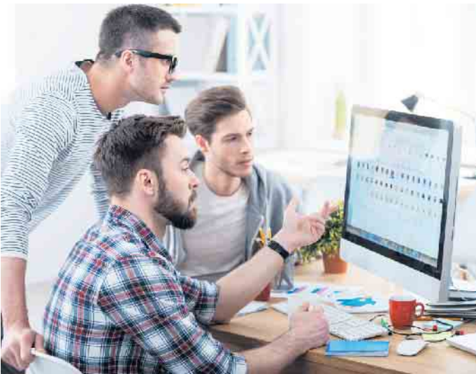
Fachkräfte werden in der IT-Branche händeringend gesucht. Für Quereinsteiger und Arbeitssuchende eröffnen sich mit einer Weiterbildung gute Berufschancen.

Bildungs- oder Vermittlungsgutschein können sie von einer 100-prozentigen Kostenübernahme der Qualifizierungskosten profitieren.