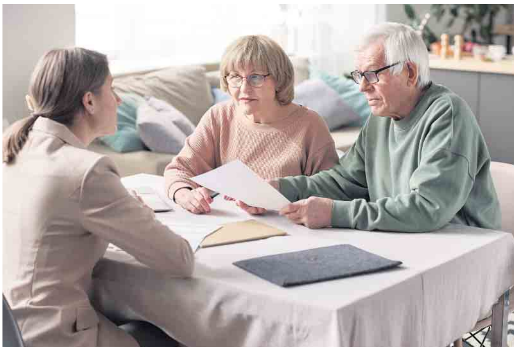
Seit dem 1. Januar 2023 gilt ein neues, grundlegend reformiertes Betreuungsrecht, das stärker als bisher die Selbstbestimmung betreuter Menschen und ihre Wünsche in den Mittelpunkt stellt.

Rechtliche Betreuung ist dagegen ein flexibles Rechtsinstrument zur Unterstützung von Erwachsenen, die aufgrund einer Krankheit oder Behinderung ihre rechtlichen Angelegenheiten ganz oder teilweise nicht (mehr) übernehmen können. Seit dem 1. Januar 2023 gilt ein neues, grundlegend reformiertes Betreuungsrecht, das stärker als bisher die Selbstbestimmung betreuter Menschen und ihre Wünsche in den Mittelpunkt stellt - mehr Informationen dazu gibt es unter www.bmj.de/betreuungsrecht .