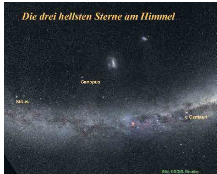
„Die drei hellsten Sterne am Himmel“

Zu unseren regelmäßigen Unterstützern in Lohmar zählen: Stadtwerke, VR-Bank Bonn/Rhein-Sieg, Kreissparkasse Köln, Firma Grützenbach, Gasthof Brauhäuschen.