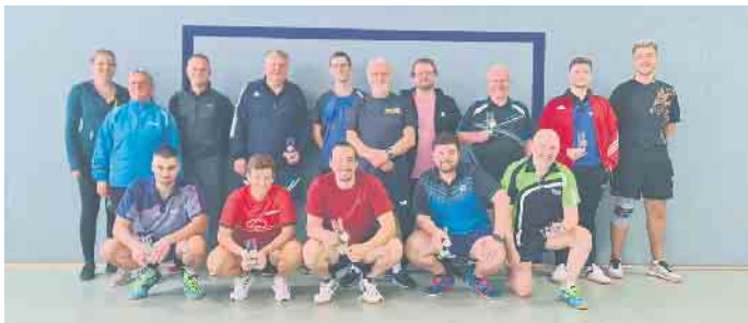
Tischtennis Vereinsmeisterschaft 2022

Dritte Mannschaft dominiert Tischtennis-Vereinsmeisterschaften