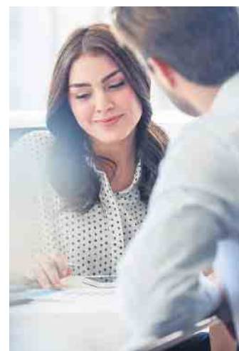
Bankkauffrau beziehungsweise Bankkaufmann zählen zu den wichtigsten Ausbildungsberufen in Deutschland.