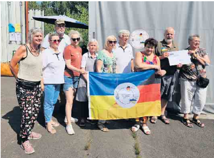
Spendenübergabe durch die AWO-Lohmar

Ein Schwerpunkt der Arbeit liegt auf Dmitrievka, einer Gemeinde mit 17 Ortschaften und rund 20.000 Einwohnern. Sie gehört zur Region Butscha, wo die russischen Streitkräfte die Infrastruktur wie Schulen, Kindergärten und Ambulanzen zerstört haben. Mit dieser Spende soll die wertvolle Arbeit des Vereins unterstützt werden.