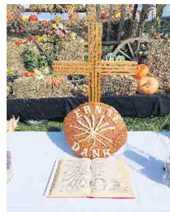
Erntedank-Altar im Naafbachtal