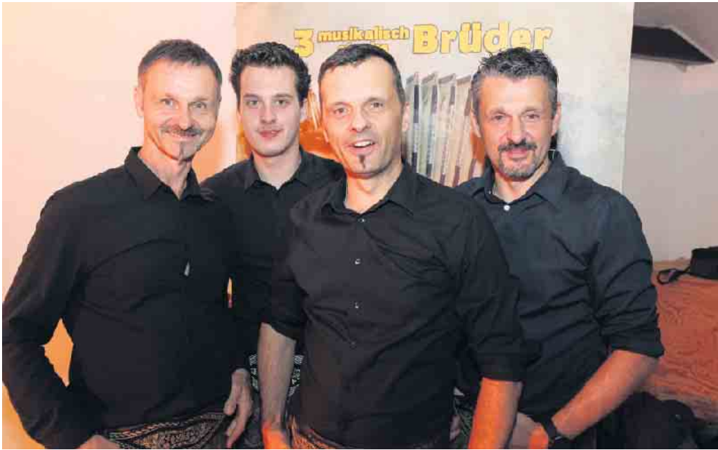
Das „Tauernecho“ ist mit dabei!