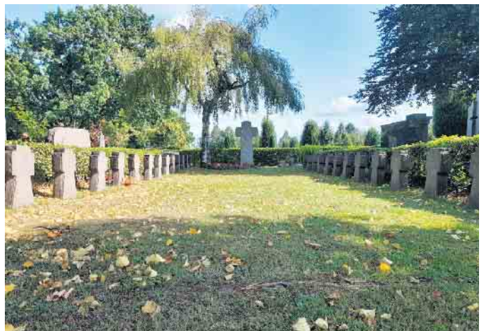
Kriegsgräberanlage Friedhof Lohmar-Ort

Friedhofsverwaltung@Lohmar.de als Sammler*in!“, ruft die Friedhofsverwaltung der Stadt Lohmar Interessierte zur Unterstützung auf. Gesammelt werden soll jeweils zu zweit. Die Sammler*innen müssen mindestens 15 Jahre alt sein, sie werden mit Sammleraus-