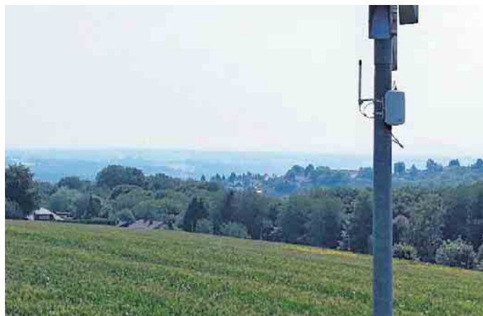
LoRaWAN-Sensor in Lohmar - datenschutzkonform und anonymisiert.

Ampeln installiert. Umwelt- und Wettersensoren erfassten Luftqualität, Temperatur und Feuchtigkeit. Verkehrssensoren zählten Fahrzeuge, Rad- und Fußgänger, und Pegelsensoren überwachten Wasserstände an der Agger und an weiteren Fließgewässern. Sämtliche Daten wurden erfolgreich über das LoRaWAN-Netz an eine zentrale städtische Plattform übermittelt und dort ausgewertet. Auf diese Weise können die Informationen künftig gezielt für die Optimierung städtischer Prozesse genutzt werden - zum Beispiel für die Mobilitätsplanung oder für Maßnahmen zur Anpassung an den Klimawandel. Mit dem nun beginnenden Ausbau des Netzes in den Höhenlagen wird der Grundstein für eine flächendeckende Sensorintegration gelegt. Dadurch lassen sich in Zukunft noch