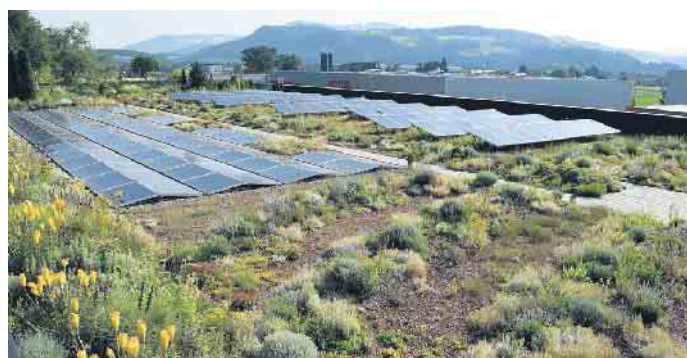
Die perfekte Kombi: Photovoltaik und Gründach.