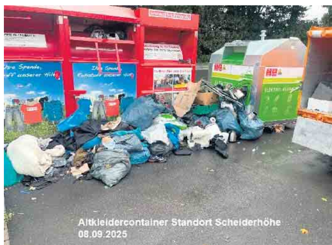
Wilder Müll an den Containern in Scheiderhöhe: Eine Ordnungswidrigkeit, die Umwelt und Gemeinschaft belastet.

Es kommt leider immer wieder vor, dass einige Menschen ihren Abfall durch Wegwerfen oder Abladen illegal entsorgen. Auffällig ist, dass besonders an den Altglas- und Kleidercontainern im Stadtgebiet vermehrt Ansammlungen von Abfällen und Sperrmüll vorgefunden werden. Dies ist schwer nachzuvollziehen, wenn man bedenkt, dass für die Bürger*innen im Rhein-Sieg-Kreis ausreichend Möglichkeiten bestehen, ihre Abfälle ordnungsgemäß zu entsorgen. Sperrmüll und Elektrogroßgeräte