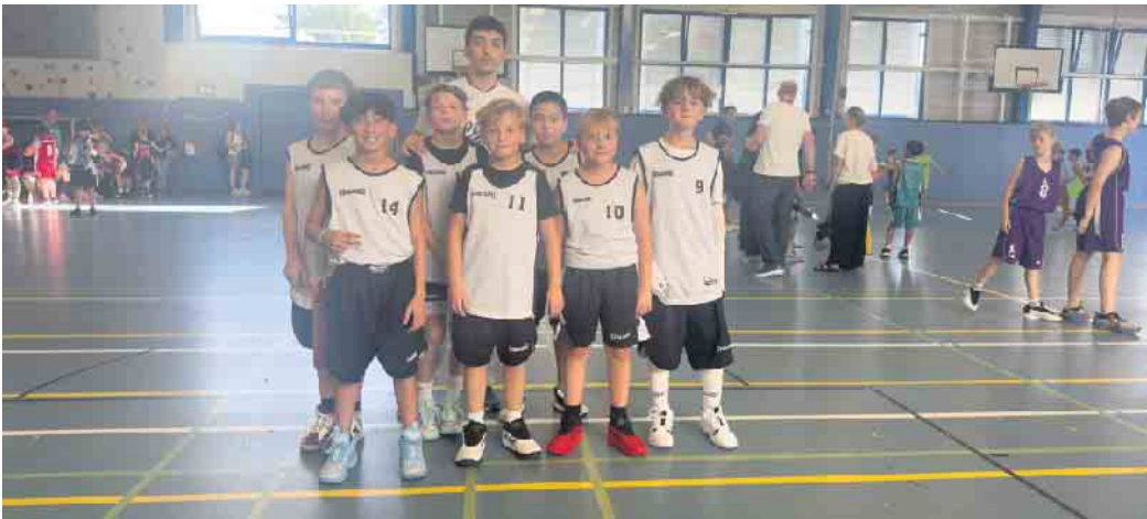
U12: Erster Auftritt