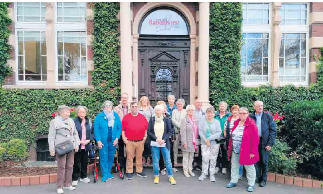
ZWAR-Gruppe Lohmar in Unkel

Dieses Mal ging es für die bereits in 2007 gegründete „ZWAR-Gruppe Lohmar“ in eine Stadt am Rhein. Diesmal war es nicht Linz, die der Ausgangspunkt der letzten Tour war, heute stand Unkel auf dem Programm. Aber nicht, wie man vermuten könnte, wegen des Weines, der hier traditionell angebaut wird, nein, heute blieb es alkoholfrei. Das Unternehmen, welches bereits im Jahr 1805 durch Pfarrer-Johann-Lauuffs als Weingut in Oberwinter gegründet und 80 Jahre später nach Unkel verlegt wurde, war unser Ziel. Bei einer eineinhalbstündigen Werksführung im schicken Outfit mit rotem Haarnetz und Einmalkittel, haben wir viel über die 200-jährige Firmengeschichte erfahren; dass das Unternehmen noch immer in Familienbesitz ist und die Urenkel von Johann Lauuffs schon im Jahr 1898 den ersten alkoholfreien Medizinal Wein