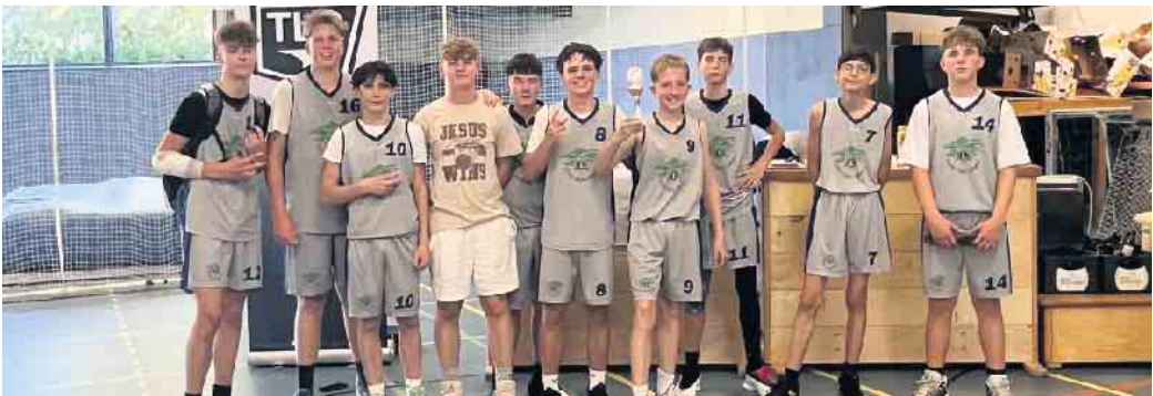
Siegerehrung der U16

Die U12 und die U16 der Lohmar Lions traten zum Saisonvorbereitungsturnier in Troisdorf an.