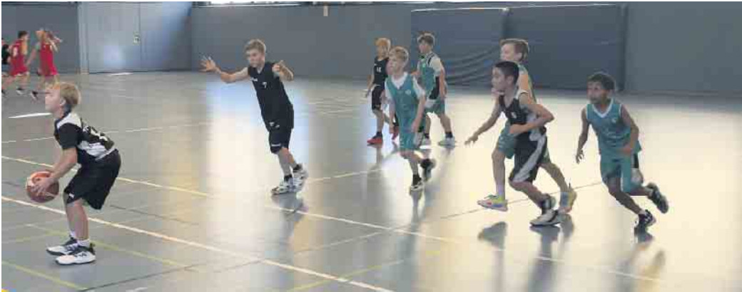
U12 in Aktion