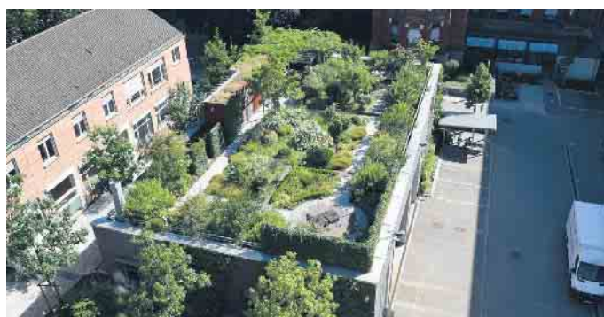
Auch Gärten sind auf Dächern möglich, es wird dann von einer intensiven Dachbegrünung gesprochen.