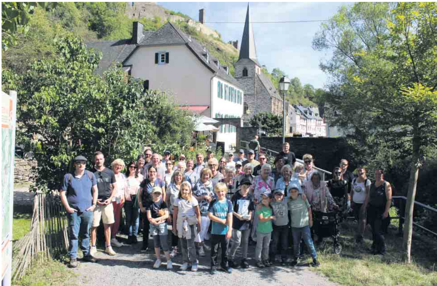
Die Reisegruppe in Monreal/Eifel