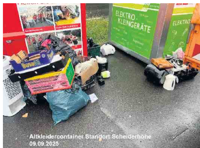
„Helfen Sie mit, Umweltverschmutzung zu verhindern und unsere Stadt sauber zu halten“, appelliert das Ordnungsamt der Stadt Lohmar und dankt für jegliche Unterstützung.

kann jeder private Haushalt jeweils bis zu viermal im Jahr über die Rhein-Sieg-Abfallgesellschaft mbH (RSAG) kostenlos abholen lassen. Information hierzu findet man auf der Homepage der RSAG: https://www.rsag.de/service/online-service/sperrmuell-co-anmelden Dabei ist es wichtig, dass Gegenstände, die nicht in den Elektro-Kleinteile-Container passen, auch nicht daneben abzustellen sind. Falsch entsorgter Müll stellt eine illegale Müllablagerung dar und