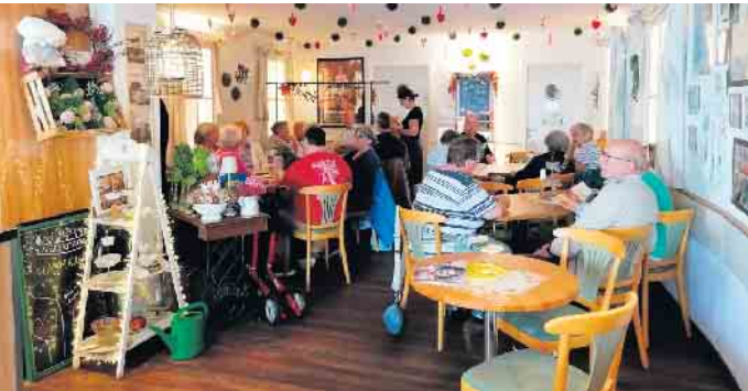
ZWAR-Gruppe Lohmar auf Tour

im „Café am Markt“ ein Muss. Ob Reibekuchen, Flammkuchen oder ganz ohne „Reibe“ und „Flamm“ einfach nur Kuchen, die Auswahl und unser Appetit war groß. Nach einem kurzen Rundgang durch Unkel und am Rhein entlang, ging es in Fahrgemeinschaften wieder nach Lohmar. Es war mal wieder ein gelungener Tag, von dem wir noch länger reden werden. (AW) Wer Lust hat, auch mit seinen Ideen zu unseren Treffen in die Villa Friedlinde zu kommen, gerne, immer den 2. und 4. Montag im Monat um 17.30 Uhr oder in einer der anderen drei Gruppen.