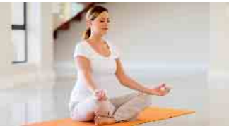
Yoga zur Ruhe kommen

Yoga ist stark auf dem Vormarsch - auch mitten in Lohmar