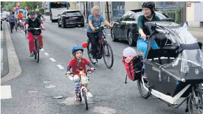
Viel Spaß für Klein und Groß

Siegburg treffen wir uns dort um unsere Forderungen bzgl. Verkehrssicherheit zu stellen und einen vergnügten Nachmittag bei Waffeln, Seifenblasen, Fahrradparcour, u.s.w. zu verbringen. Rauf auf Eure Räder, freut Euch auf eine bunte Demo und einen lustigen Nachmittag!