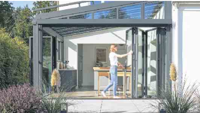
Bewegliche Verglasungen holen die Natur ins Haus.

Die eigene Immobilie ist für die meisten nicht nur die größte Investition in ihrem Leben, sondern gleichzeitig eine zentrale Geldanlage für die Zukunft. Wertsteigerungen der Vergangenheit geben Immobilienkäufern Recht: Laut Statistischem Bundesamt haben sich die Preise für Ein- und Mehrfamilienhäuser im Zeitraum von 2010 bis 2022 um 64 Prozent erhöht. Prognosen zufolge werden die Immobilienpreise bis 2030 weiter steigen. Mit gezielten Modernisierungen können Immobilieneigentümer dazu beitragen, den Wert noch weiter zu verbessern. Stilvoller Wärmepuffer und geschützter Freisitz Eine Modernisierung bietet gleich mehrere Vorteile: Sie verschönert das Objekt und erhöht den Wohnkomfort - kann sich aber auch dauerhaft durch mehr Energieeffizienz und eine positive Wertentwicklung auszahlen. Dazu gibt es verschiedene Möglichkeiten. Ein stilvoller Wärmepuffer ist bei-