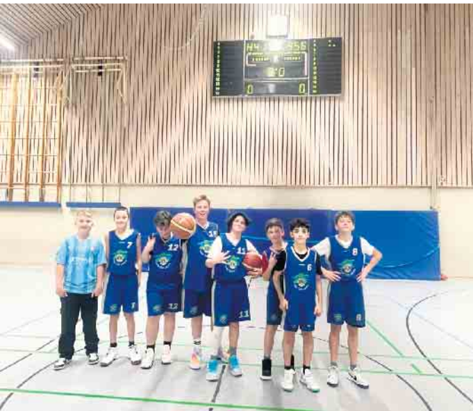
TV 08 Lohmar U14.2