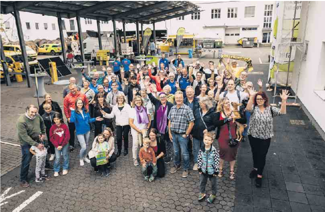
Bereits 2023 haben die Stadtwerke Troisdorf einen Nachhaltigkeitspreis ausgelobt. Auch in diesem Jahr stellt der Lokalversorger wieder 3.000 Euro für den guten Zweck zur Verfügung.

Auch in diesem Jahr präsentieren sich wieder etliche eingetragene Vereine und gemeinwohlorientierte Initiativen aus Troisdorf und der Region auf der Förder.Ei-Website mit ihren Herzensprojekten und hoffen auf Spenden für deren Umsetzung. Die Troisdorfer ließen sich nicht lange bitten und machten engagiert mit. Vom 14. bis 29. August riefen sie fleißig die digitalen Fördercodes für den guten Zweck ab und verteilten die Spenden an ihre jeweiligen Lieblingsvereine. Hierfür hatten die Stadtwerke Troisdorf 20.000 Euro zur Verfügung gestellt.