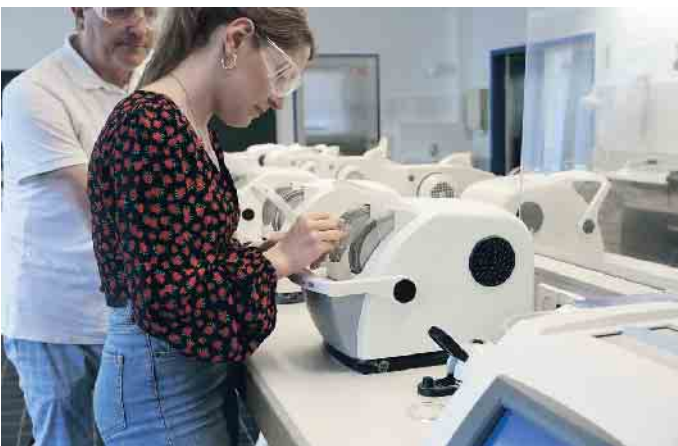
Brillenschliff, Reparatur und Anpassung - nur ein paar Dinge, die Augenoptiker-Auszubildene innerhalb von drei Jahren lernen

Umfassende Informationen hierzu finden Sie auf der Website des Zentralverbands der Augenoptiker und Optometristen (ZVA) unter www.zva.de und auf der Ausbildungsplattform www.be-optician.de . (akz-o)