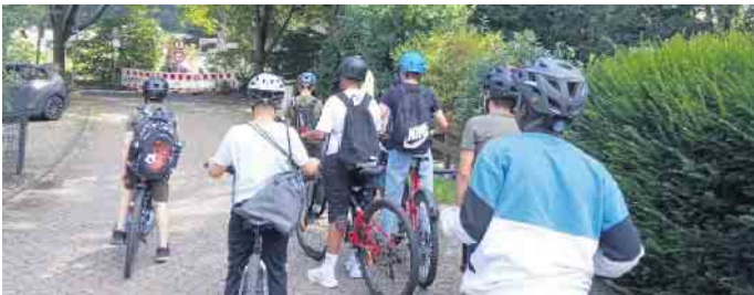
Auf dem Weg zum Aggerbogen

Weiterhin haben wir für Sie eine leckere Auswahl an Gerichten mit frischen Pfifferlingen.