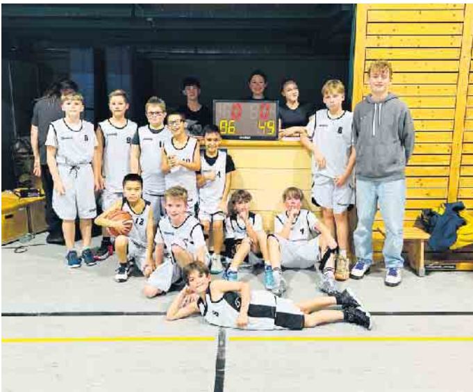
TV 08 Lohmar U12

zum Jahrgang 2010 spielen in gemischten Teams) mit und ohne Vorerfahrung. Der TV 08 Lohmar und insbesondere seine Basketballer suchen noch Unterstützer in Form von Sponsoren für Trikots für die Teams und auch für weiteres Equipment für ihr Training da der Verein die aufgrund des großen Interesses schnell gewachsene Abteilung zwar nach seinen Möglichkeiten unterhält, aber auch an Grenzen stößt. Interessierte melden sich bitte beim Verein telefonisch (02206/9054878) oder per Mail ( geschaeftsstelle@tv08lohmar.de ) oder bei Abteilungsleiter Uwe Kögler (02263/801037, basketball@tv08lohmar.de ).