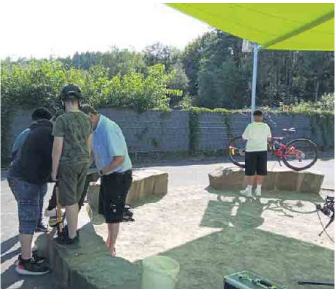
Wie repariere ich Kleinigkeiten?

Liebe Kunden, gerne nehmen wir uns viel Zeit für Sie! Daher bitten wir Sie, einen Termin für ein ausführliches Beratungsgespräch zu vereinbaren.