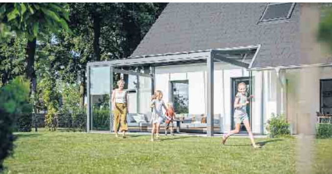
Mit einem Glashaus gehen Innen- und Außenbereich fließend ineinander über.