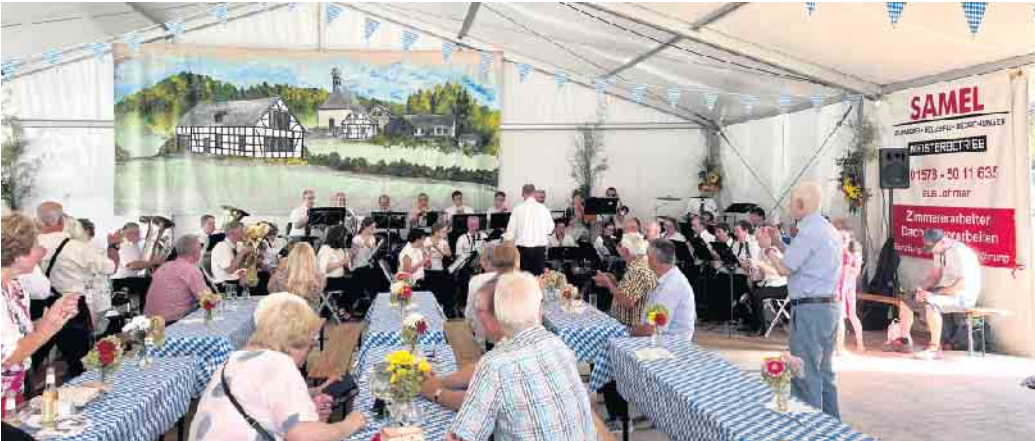
Kölsche Mess im Festzelt Neuhonrath 2023

Die Ortsvereinigung Neuhonrath - das Blasorchester, der Dilettantenverein und der Förderverein für Kirchenmusik - freut sich schon jetzt auf Ihren Besuch in zünftiger „Wiesen-Kleidung“.