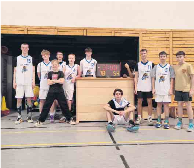
TV 08 Lohmar U18