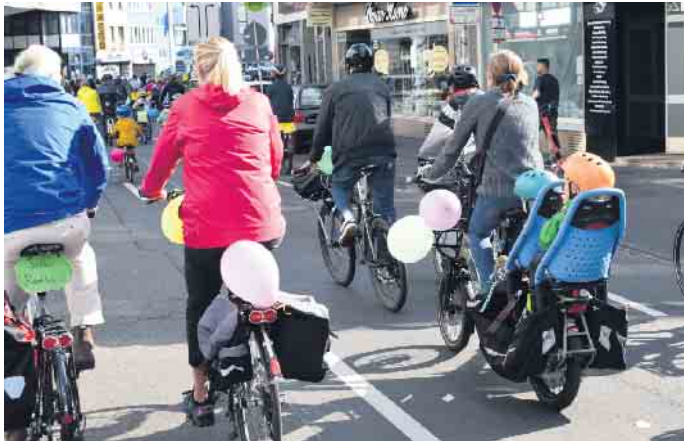
Gemeinsam nach Siegburg