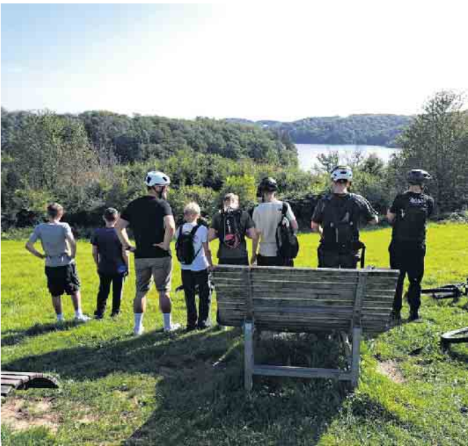
Kurze Pause an der Wahnbachtalsperre

wurden platte Reifen geflickt, Sättel justiert, Bremsen neu eingestellt, ein Parcours zum Training der Fahrsicherheit aufgebaut... Der Abschluss bestand aus einer Fahrradtour durch Lohmar und Umgebung, bei der die Schüler das anwenden konnten, was sie in den zwei Tagen erarbeitet hatten und die ihnen sichtlich Spaß machte.