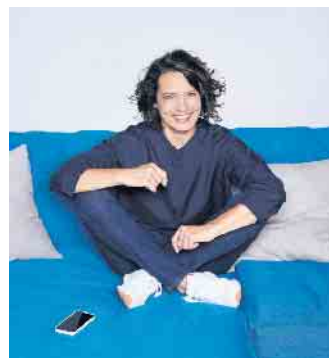
Schauspielerin Ulrike Folkerts leidet nach einem Knalltrauma unter einer Hörminderung.

Zugang zur gesamten Klangumgebung, um auf natürliche Weise zu arbeiten. Auch Ulrike Folkerts informierte sich über eine entsprechende Versorgung und entschied sich für ein Oticon More-Akkumodell mit BrainHearing-Technologie. Das mehrfach ausgezeichnete Hightech-System ermöglicht die komplette Klangvielfalt. Dank einer speziellen Technik erhält das Gehirn alle relevanten Töne - nicht nur Sprache - in optimierter Form. Als Botschafterin möchte Ulrike Folkerts nun auch andere Menschen ermutigen, sich nicht aus falscher Scham mit einem nachlassenden Gehör abzufinden: „Eine Hörminderung oder ein Hörsystem sind kein Mangel.“ Sie will zeigen, dass man zu sich und seinem Hörgerät selbstbewusst stehen sollte.