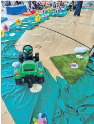
Ein landwirtschaftlicher Betrieb

Zum Schuljahresende führte die Musical-AG der Waldschule Lohmar wie immer mit großer