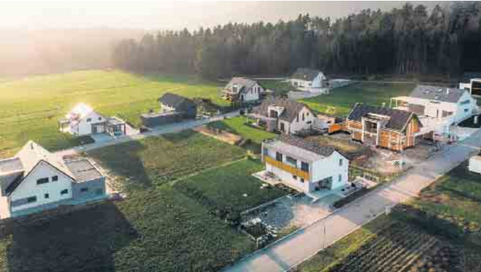
Wie kann man die Kosten für ein eigenes Haus senken? Zum Beispiel, indem man größere Entfernungen zur Stadt in Kauf nimmt.

Die steigenden Baukosten sind für die Deutschen das größte Hindernis auf dem Weg zu den eigenen vier Wänden. Das zeigt das aktuelle Bauherren-Barometer, für das der Verbraucherschutzbund Bauherren-Schutzbund e. V. (BSB) regelmäßig Mieterinnen und Mieter befragt, die an Bau von Immobilieneigentum interessiert sind. Bei ebenfalls steigenden Mieten suchen viele nach Möglichkeiten, ihren Traum von der eigenen Immobilie dennoch zu realisieren. Wichtig ist es dabei, umfassende Informationen einzuholen und ein Bauprojekt gründlich durchzuplanen. Finanzierungsmöglichkeiten prüfen Ein erster Schritt ist die ehrliche Bestandsaufnahme der finanziellen Situation. Dazu gehört, Einnahmen und Ausgaben gegenüberzustellen, vorhandenes Eigenkapital realistisch zu bewerten und Sparpotenziale zu identifizieren. Je flexibler man bei der Lage und der Größe von