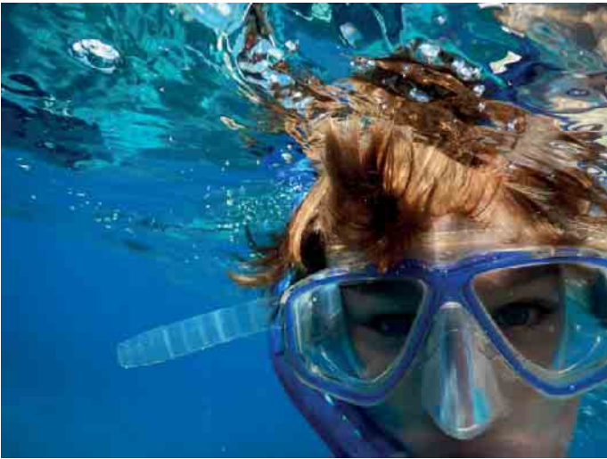
Für den Bereich Schnorcheln liefern die neuen Abzeichen erstmals eine solide Grundausbildung unter Wasser.

Neue Schnorchelabzeichen deutschlandweit eingeführt