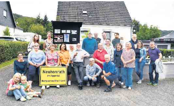
Ein Großteil der Bewohner der Pfarrer-Tholen-Siedlung in Neuhonrath fand sich zum Sommerfest zusammen, um mit einer neuen Gedenktafel an das 25-jährige Bestehen ihrer Siedlung zu erinnern.

Am 25. Mai jährte sich die Grundsteinlegung zur ersten neueren Siedlungsgründung von Neuhonrath zum 75. Mal: die Pfarrer-Tholen-Siedlung.