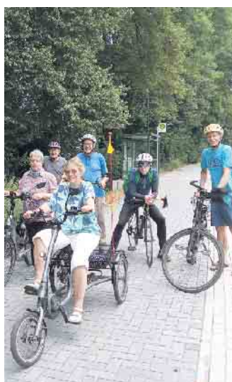
Probefahrt auf neuem Radweg

Somit sind alle Verkehrsteilnehmer - im Auto, auf dem Rad, zu Fuß oder in öffentlichen Verkehrsmitteln gleichrangig in den Blick genommen.