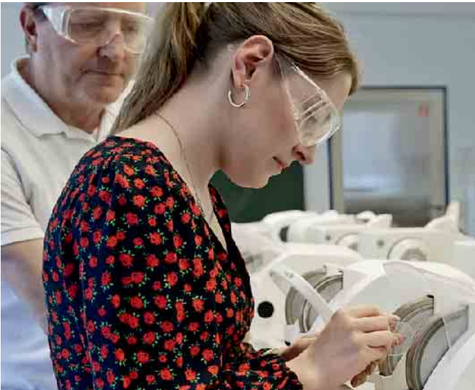
Brillenschliff, Reparatur und Anpassung - nur ein paar Dinge, die Augenoptiker-Auszubildene innerhalb von drei Jahren lernen.

Mit dem Gesellenbrief in der Tasche stehen alle Karrieretüren in der Augenoptik offen. Weitere Informationen dazu finden sich zum Beispiel unter www.be-optician.de . So können Gesellen sich berufsbegleitend oder in Vollzeit auf die Meisterprüfung vorbereiten und danach noch mehr Verantwortung im Betrieb übernehmen, eine Filiale leiten oder sich selbstständig machen - und auch selbst Azubis ausbilden. Alternativ werden an diversen Hochschulen Bachelor- und Masterstudiengänge in Augenoptik und Optometrie angeboten. (DJD)