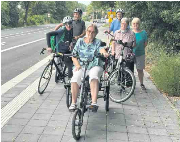
Befahrbar in zwei Richtungen

Nach einer längeren Umbauphase ist der neue Fußgänger- und Radweg entlang der B 484 in Donrath in einem fertiggestellten Stück nutzbar und bietet einen Ausblick, wie komfortabel die Strecke durch Donrath als Teil der Radpendlerroute von Siegburg zum Bahnhof Honrath für Fahrrad Fahrende sein wird. Mit einer Breite von 3,50 m bietet der Weg Platz für Fußgänger und Radelnde in beide Richtungen.