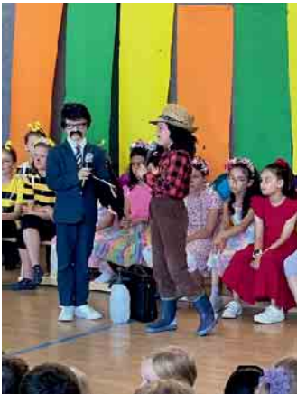
Der Landwirt mit einem Vertreter für Pestizide

Der Chor Cantiamo verbündet sich mit der Waldschule