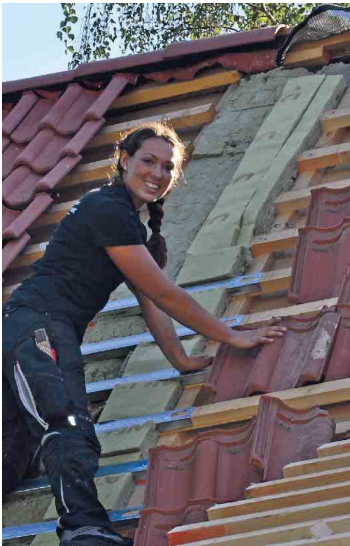
Dachdeckerinnen sind auf dem Vormarsch: schweres Tragen ist out, das übernehmen Lastenaufzüge.