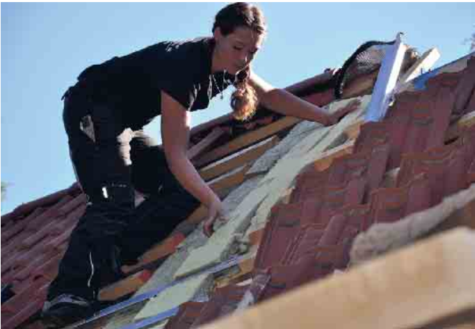
Dachdeckerinnen sind auf dem Vormarsch: schweres Tragen ist out, das übernehmen Lastenaufzüge.

Immer mehr junge Menschen möchten einen sinnstiftenden Beruf ausüben, zum Beispiel etwas fürs Klima tun. Das geht wunderbar mit dem Handwerk, denn ohne die Klimagerwerke wird es keine Klimawende geben. Ganz weit oben bei den Klimahandwerkern sind Dachdecker und Dachdeckerinnen. Das erkennt auch zunehmend die junge Generation und so lassen sich seit sechs Jahren in Folge immer mehr im Dachdeckerhandwerk ausbilden.