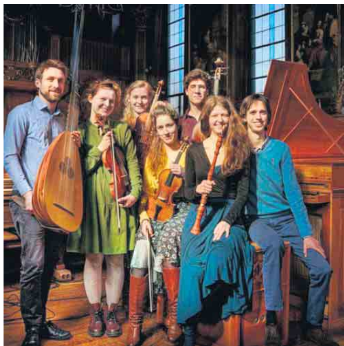
Ensembles MUSICA GLORIA . Foto: MUSICA GLORIA

Sonntag, 1. September um 17 Uhr Ev. Kirche Honrath, Peter-Lemmer-Weg in 53797 Lohmar OT Honrath Eintritt: 20 Euro / Jugendliche und Studenten 10 Euro / bis zwölf Jahre frei Verbindliche Vorbestellungen telefonisch unter 02206 7201 oder unter konzerte@musik-honrath.de Ausrichter ist der Förderkreis für Musik in der Kirche Honrath e.V.