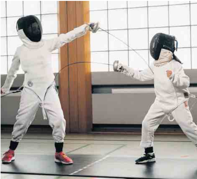
Anfänger in Aktion

Umgang mit dem Degen, Beinarbeit, Tempo- und Reaktionsübungen und auch freie Gefechte. Die nötige Fecht-Ausrüstung wird dir von uns zur Verfügung gestellt. Zusätzlich brauchst du lediglich eine lange Sporthose und Turnschuhe. Der Unkostenbeitrag liegt bei 20 Euro pro Teilnehmer. Melde dich bis zum 4. September an und sichere dir einen der begrenzten Plätze! Weitere Informationen unter fechten-in-rösrath.de