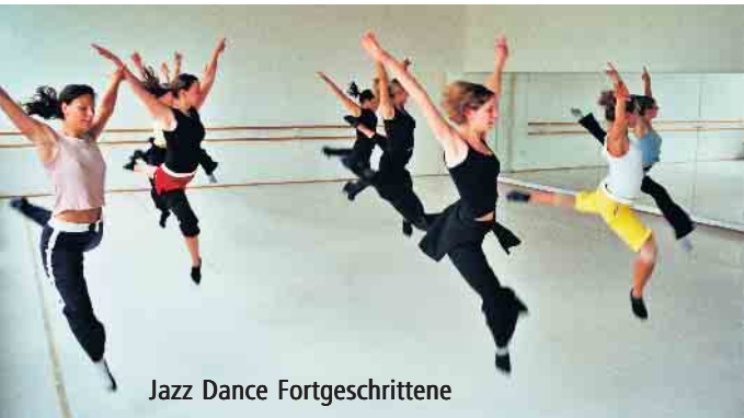
Jazz Dance Fortgeschrittene

Lohmar erstellt. Es kommen namhafte Choreografen aber auch für Einstieger gibt es Kurse Einfach anfragen bei JMDC Club Lohmar in der Ballettschule im Hofgarten 02246 3526 oder dodotanz@yahoo.de