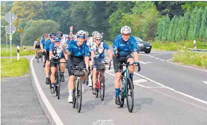
Auf der Strecke

Knapp 400! Das war die Anzahl der Rennradfahrerinnen und -fahrer, die der Einladung gefolgt sind, an unserer Rad-Touristik-Fahrt (RTF) „Täler & Höhen“ am 3. August teilzunehmen. Immer ein Auge auf dem Regenradar, hatten wir erneut viel