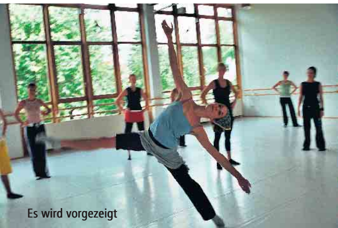
Es wird vorgezeigt