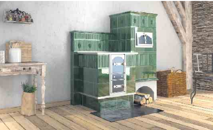
Zu zehn Prozent kann der regenerative Energieträger Holz auf die 65-Prozent-Erneuerbare-Energien-Vorgabe des neuen Gebäudeenergiegesetzes (GEG) angerechnet werden.

einem Anteil von zehn Prozent an den 65 Prozent der erneuerbaren Energien angerechnet werden, die das Heizungsgesetz (GEG) bei einem Neubau oder in Zukunft im Rahmen einer Modernisierung der Heizungsanlage fordert. (DJD)