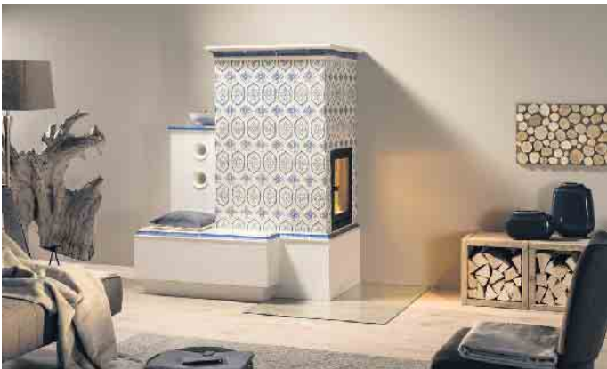
Ein wasserführender Kachelofen kombiniert mit einer Wärmepumpe senkt die Stromkosten im Winter und erhöht die Energieeffizienz.

Wer seinen Wärmebedarf etwa mit Solarthermie, einer Wärmepumpe und einer modernen Holzfeuerstätte deckt, ist von der CO2-Steuer gar nicht erst betroffen. Da klassische Einzelraumfeuerstätten wie Kachelöfen, Heizkamine, Kaminöfen und Pelletöfen keine Heizungsanlagen sind, unterliegen sie auch nicht dem GEG. Sie lassen sich frei und sehr flexibel mit anderen regenerativen Energieträgern etwa als Hybridheizsystem kombinieren. So kann eine Holzfeuerstätte mit Wasserwärmetauscher eine Wärmepumpe in der kalten Jahreszeit entlasten, deren Stromverbrauch senken und den Wirkungsgrad erhöhen. Zusätzlicher Pluspunkt: Die mit Holz betriebene moderne Einzelraumfeuerung kann mit