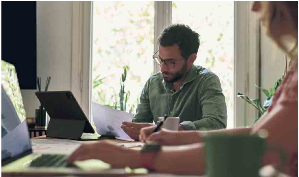
Schnelle und unkomplizierte Vermietung - das wünschen sich viele Vermieter:innen und Wohnungssuchende.

Das in Berlin ansässige Unternehmen Wunderflats zum Beispiel bietet eine solche Lösung, die auf die Bedürfnisse der einzelnen Kundengruppen zugeschnitten ist und gleichzeitig den Arbeitsaufwand für Vermieter:innen erheblich reduziert: Mit nur wenigen Klicks inserieren