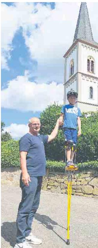
Auf Stelzen.

sori Kinderhauses Wahlscheid und die Freitags-Mini-Club-Gruppe und in der zweiten Woche die Kinder und Erzieher*innen der Kath. KiTa St. Mariä Himmelfahrt aus Neuhonrath als Zuschauer eingeladen waren, präsentierten die Artist*innen dann am Mittag ihren Eltern, Geschwistern, Großeltern und Freunden, was in der Zirkuswoche so alles auf die Beine gestellt worden war. Unter tosendem Applaus und mit Konfetti-Regen führten die Zirkuskids mit Unterstützung der Helfer*innen ein buntes Programm vor - mit allem was Zirkus-Fans sich wünschen. Und sogar den lauten Rufen nach einer Zugabe kamen die Kinder nach und legten noch eine tolle Abschlusspyramide oben drauf. Auch die Vertreter*innen des Presbyteriums, die zur Aufführung anwesend waren, zeigten sich begeistert von dem was in den beiden Wochen auf die Beine gestellt worden war. Sie dankten den Teilnehmenden, den Helfer*innen und Ingo Scharnbacher für ihr Engagement und die tolle Abschluss-Show. Auch ein kurzer Werbeblock für die weiteren Angebote der Kinder- und Jugendarbeit der Kirchengemeinde durfte da nicht fehlen. Sofern es sich terminlich einrichten lässt, wird es bestimmt auch in den kommenden Sommerferien wieder eine Zirkuswoche -