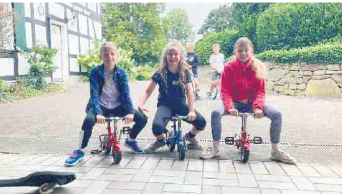
Miniräder.