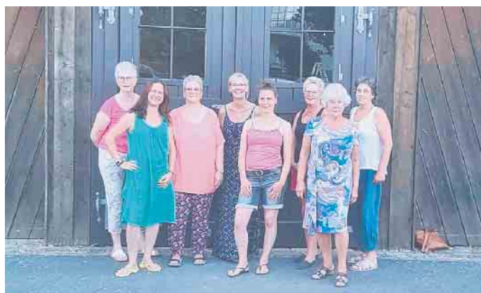
Die Schauspielerinnen des Theatervereins „WieverSpell“

Das neue Theaterstück trägt den Namen „Miss Sophie's Erbe“. In der turbulenten Komödie begegnet das Publikum einem bunten Potpourri potenzieller Erben, die es allesamt nicht abwarten können, sich Miss Sophies Vermögen unter den Nagel zu reißen, als da wären die alternde Operettendiva Ludmilla Stroganoff samt ihrer bisigen Assistentin Gundula, der Dandy Richard Pommery, die raffgierige Gilla sowie der affektierte Designer Siegfried Roy Toby. Mit viel Witz und schwarzem Humor durchleben die Akteure den Moment bis zur Testamentseröffnung. Doch auch der Notar Dr. Ross, die miserabel kochende Köchin Marlies, sowie der attraktive Butler Paul haben noch einige Überraschungen im Ärmel. Die Premiere ist am Samstag, dem 3. September um 19 Uhr in Schmitz' Kuhstall in Breidt. Der Vorverkauf beginnt Anfang August bei allen Vereinsmitgliedern, montags von 18 bis 20 Uhr in der Gaststätte Gebermühle