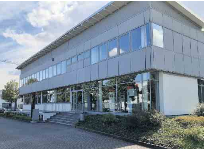
Viessmann Verkaufsniederlassung Troisdorf in der Josef-Kitz-Straße 16.

Seit einigen Monaten beherrschen die Themen steigende Energiepreise sowie die Notwendigkeit zur Umstellung der Heizung auf regenerative Technologien die Medien. Die Verunsicherung ist in