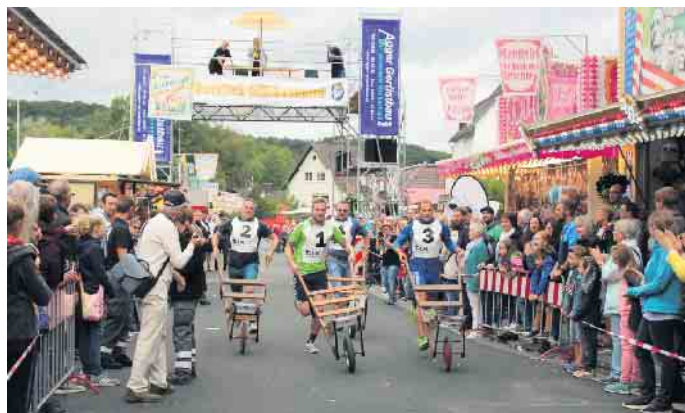
Sportlicher Höhepunkt: Das Schörreskarrenrennen

Anmeldeformulare gibt es auf https://wahlscheiderkirmes.de . (Kirmesausschuss der Wahlscheider Ortsvereine)