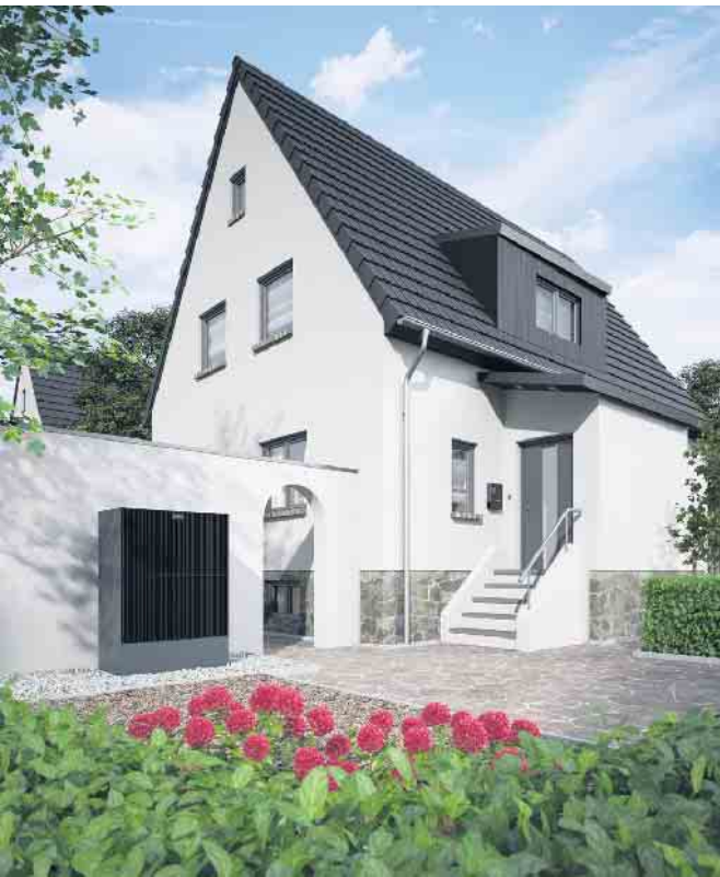
Viessmann Wärmepumpe Vitocal 25 x -A.

Fachkreisen und insbesondere bei Endkunden groß. Vor diesem Hintergrund hat sich die Viessmann Niederlassung Köln-Bonn dazu entschieden, vom Mittwoch, 17.08.2022, bis zum Freitag, 19.08.2022 , erstmalig Endkundentage durchzuführen. In der Zeit von 10:00 bis 18:00 Uhr haben interessierte Endkunden - gerne in Begleitung von unseren Fachpartnern - die Möglichkeit, die neuesten Wärmepumpentechnologien, Photovoltaiksysteme und Stromspeicher aus