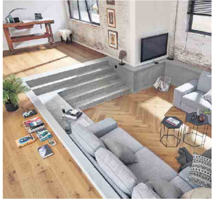
Ein Parkettboden ist auch 2022 moderner denn je.

Holzfußböden tragen als einziger moderner Fußbodenbelag entscheidend zu einem gesunden Raumklima bei. „Einmal verlegt, lebt und atmet das Holz als natürlicher und lebendiger