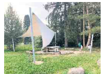
Das neue, aber jetzt leider zerstörte Sonnensegel vor der Naturschule Aggerbogen.

den Wochenenden hängen zu lassen, so dass nicht nur die Kinder aus den Ferienfreizeiten, sondern auch die privaten Besucher*innen ein zusätzliches schattiges Plätzchen zum Verweilen finden.