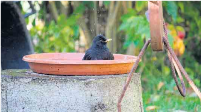
Flach und mit Rand zum Landen: Schon eine einfache Tonschale reicht aus, um Vögeln und Insekten eine wichtige Abkühlung zu ermöglichen.

Jährliche Hitzewellen stellen eine ernsthafte Herausforderung für die heimische Tierwelt dar. Viele Tiere leiden unter den hohen Temperaturen und Wassermangel. Gartenbesitzer können mit einfachen Maßnahmen helfen, die Situation für die Tiere zu erleichtern: Ein wichtiger Schritt ist die Bereitstellung von Wasserstellen. Flache Schalen mit frischem Wasser im Garten bieten sofortige Erleichterung für verschiedene Tiere: Vögel benötigen flache Vogelbäder, die nicht zu tief sind und eine Ein- und Ausstiegsmöglichkeit bieten. Wichtig ist, dass das Wasser regelmäßig gewechselt wird, um eine Keimbildung zu verhindern. Auch kleine Insekten wie Bienen und Schmetterlinge benötigen während der Hitze Wasser. Extra Steine oder Korkstücke in den vorhandenen Wasserschalen können den Insekten als Landeflä-