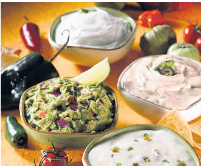
Köstliche Dips gehören zu jeder Grillparty. Eine tolle Basis dafür ist selbst gemachter Frischkäse. Foto: DJD/Alpenrose Labessenz/Getty Images/AdShooter

Ob mediterran, mit Paprika oder Meerrettich: Frischkäse-Dips gibt es für jeden Geschmack. Foto: DJD/Alpenrose Labessenz/Getty Images/AdShooter