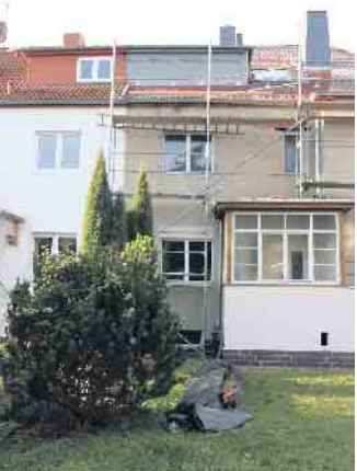
Grundlage für die Planung einer Altbausanierung ist eine gründliche Bestandsaufnahme des Hauses, am besten mit unabhängiger Beratung.

darüber, mit welchen Zusatzkosten er neben dem Kaufpreis und den Kaufnebenkosten rechnen muss. (DJD)