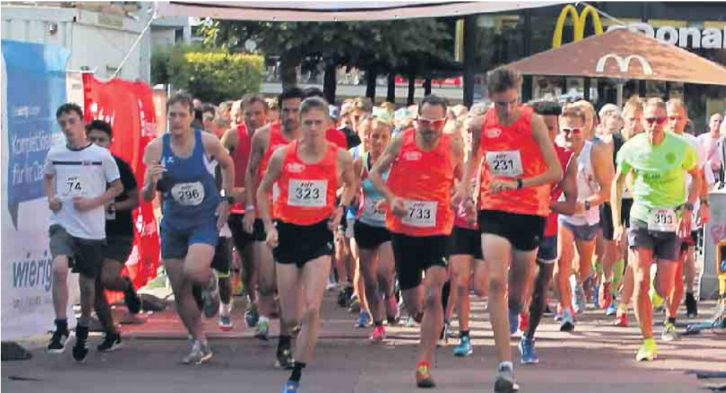
Ein Laufevent der Extraklasse!

Ein Laufevent der Extraklasse! Am 8. September verwandelt sich der historische Stadtkern rund um den Markt von Siegburg wieder in ein Mekka für Laufbegeisterte. Der Hit-Citylauf Siegburg steht vor der Tür und verspricht ein spannendes Event für Läuferinnen und Läufer jeden Levels. Dieses Jahr gibt es eine besondere Neuerung: Erstmals wird eine Firmenwertung über 5 km eingeführt. Hierbei werden die fitteste und die schnellste Firma ausgezeichnet, was den Wettbewerb zusätzlich belebt und Teams aus Unternehmen motiviert, gemeinsam an den Start zu gehen. Die Strecke führt durch die historischen Gassen und bietet mit ihrer neuen und noch schnelleren Route ein einzigartiges Lauferlebnis. Für jeden und jedes Fitnesslevel etwas dabei. Was den Hit-Citylauf Siegburg besonders macht, ist die mitreißende Atmosphäre auf der Strecke. Zahlreiche Zuschauer säumen