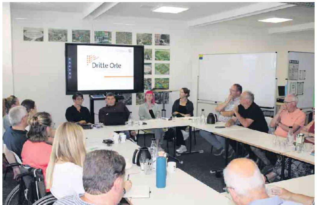
Vertreter*innen von Vereinen, sozialen Einrichtungen und der Verwaltung waren beim Auftakt-Workshop in der Netz.Werk.Stadt. dabei.

Nach der Begehung ging es in der Netz.Werk.Stadt. direkt in die Planung. Mit Unterstützung des Planungsbüros „KRAFT.RAUM.“, die spezialisiert auf Landschaftsarchitektur und Stadtentwicklung sind, wurden die Teilnehmenden im Workshop aktiv. Dabei wurde sich in zwei Gruppen mit den Ideen eines „Dritten Ortes“ und der Zusammenführung beider Parkanlagen auseinandergesetzt. Die Ergebnisse des ersten Brainstormings der beiden Gruppen wurden anschließend mit allen Teilnehmenden besprochen. Die vom Planungsbüro aufbereiteten Ergebnisse sollen als Grundlage für den weiteren Prozess dienen. An dessen Planung und Ausgestaltung können und sollen alle Bür-