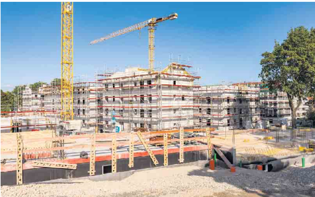
Beim Erwerb von Wohneigentum über einen Bauträger ist der Kunde kein Bauherr, sondern Käufer. Das kann Vor- und Nachteile mit sich bringen.

Contra: weniger Transparenz und Kontrolle Potenziell hat der Verbraucher weniger Transparenz und Kontrolle über den Bauprozess. Es empfiehlt sich, baubegleitende Qualitätskontrollen zum Beispiel mit einem unabhängigen BSB-Bauherrenberater zu vereinbaren, unter www.bsb-