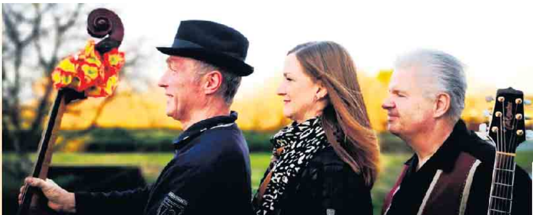
Die Bonner Band „MAK's Trio“ begeistert sein Publikum