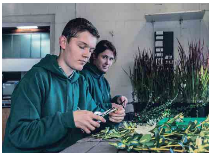
Abwechslungsreich und wichtig für die Zukunft: Ausbildung zum Baumschulgärtner.