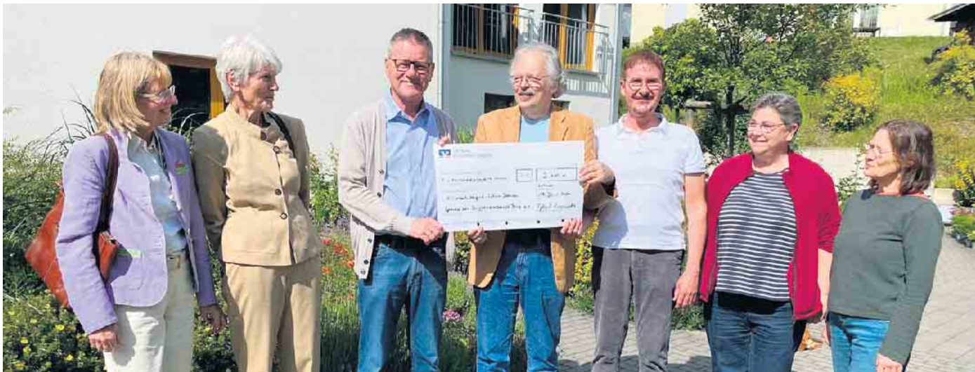
Spendenübergabe im Hospizgarten