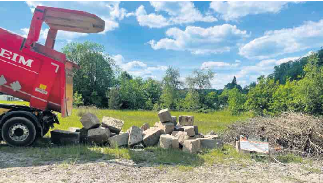
Hier wird gearbeitet: Auf dem vereinseigenen Friedhof in Rosbach werden Flächen naturnah gestaltet.