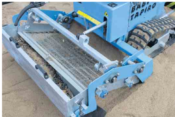
Bild 2: Herausgesiebte Fremdkörper werden entsorgt. So kann die Sauberkeit auf den Spielplätzen im Lohmarer Stadtgebiet nachhaltig gewährleistet werden.

rengegaubte Spielsachen wieder, die von den Bauhof-Mitarbeiter*innen wieder auf den Spielplatz zurückgelegt werden und mit Freude wieder genutzt werden können.