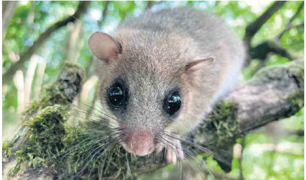
Der Siebenschläfer steht gerne vor der Kamera.

arbeiten, nehmen seit über zehn Jahren gemeinsam daran teil.