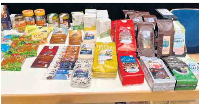
Unser Stand auf der Nachhaltigkeitsmesse der Stadt Lohmar