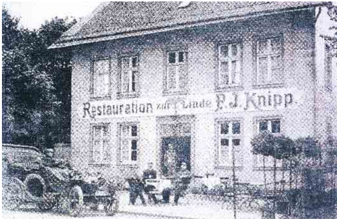
Restauration zur Linde