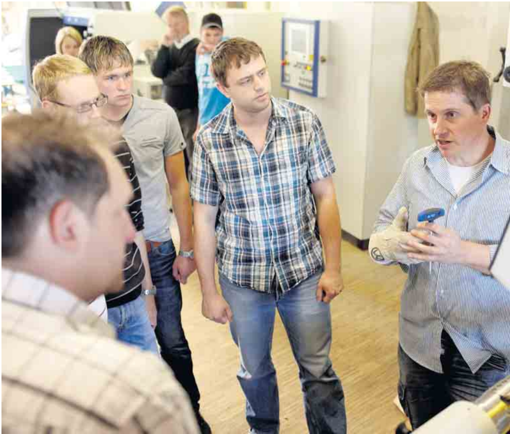
Die Azubis im Holzfachhandel erhalten eine fundierte Ausbildung mit hohem Praxisbezug.

Ohne komplexe Technik geht auch beim Umgang mit dem Naturmaterial Holz heute nichts mehr. Der Ausbildungsberuf für angehende Kaufleute im Groß- und Außenhandel mit Schwerpunkt Großhandel zum Beispiel wird immer komplexer. Er bietet sehr gute Chancen auf eine Übernahme und kontinuierliche Weiterbildungen sowie Aufstiegsmöglichkeiten nach dem Ende der Berufsausbildung. Neben der Be-