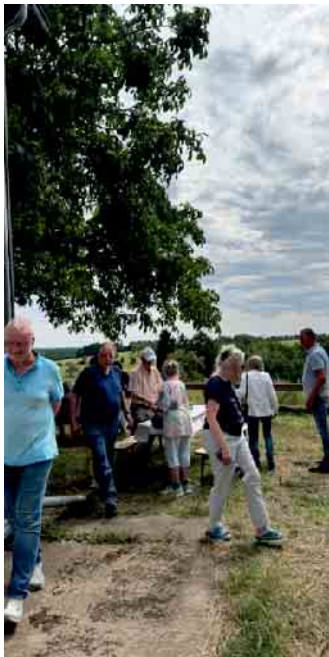
Viel Besuch beim „Tag der offenen Tür“

heute in dieser Form nicht mehr gibt, wie das zurückgebaute Wehr bei Kreuznaaf. Für die Dauerleihgabe von Hardy Blum an die BI bedankt sich der Verein sehr. Die nicht nur die Ausstellungsfotos umfasst, sondern auch ein Bild des Kreuznaafer Wehres, das von hinten beleuchtet ist und nun als Schmuckstück in der neuen Küche des Fischerhofes hängt. Viele Interessierte sind der Einladung der Bürgerinitiative gefolgt und konnten sich neben der Ausstellung und der Besichtigung der Räumlichkeiten am großen Kuchenbuffet und ge-grillten Würstchen freuen. Viele Gäste genossen dann bei bestem Sonnenwetter die ge-meinsame Zeit im Garten, un-ter dem Wallnussbaum mit Blick ins Naafbachtal. Nach diesem gelungenen Auf-takt sind weitere Veranstaltun-gen geplant, so dass der Fi-scherhof ein Treffpunkt für Na-turinteressierte ist. So macht sich die Bürgerinitia-tive zum Erhalt des Naafbach-tals e.V weiter als Natur-schutzverein stark für den dau-erhaften Schutz des Flora-Fau-na Schutzgebietes, dem Naaf-bachtal.