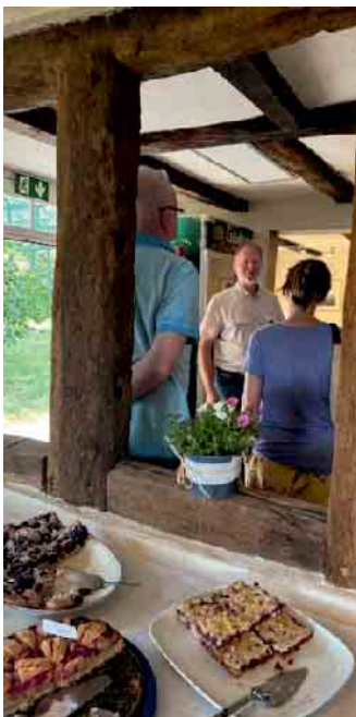
Im Fischerhof Eingangsbereich