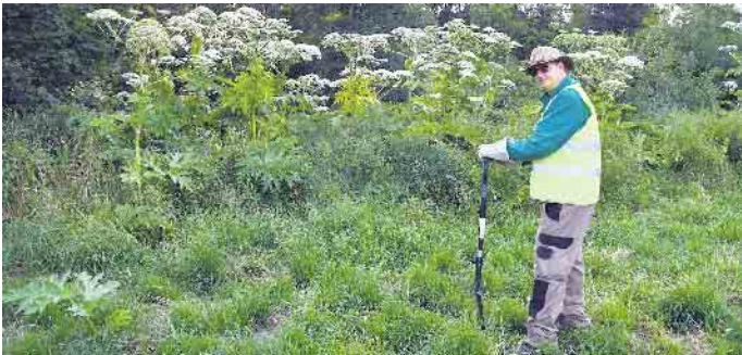
Die Ausbreitung in Krebsauel nimmt zu. Die Arbeitsgruppe steht vor großen Herausforderungen.

Der VVW lädt weitere Bürger*innen ein, sich dem Projekt anzuschließen - sei es durch aktive Teilnahme an den Arbeits-