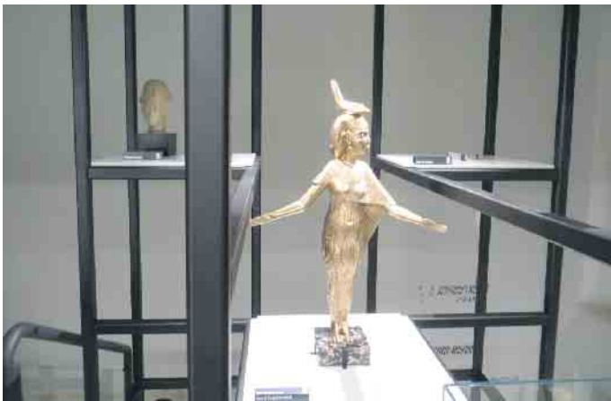
Skulptur im Treppenaufgang neues Museum

Ägyptisches Museum der Universität Bonn, Poststr. 26