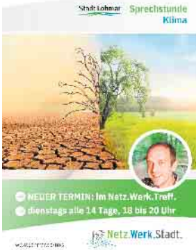
Die Klimasprechstunde ermöglicht einen Austausch mit den Fachleuten der Stadt. Besuchen Sie die Netz.Werk.Stadt. auch unter www.Lohmar.de/nws

Sind Sie länger als zwei Wochen in Urlaub? Dann gönnen Sie auch dem Kühlschrank Ferien: Schalten Sie das Gerät aus und tauen das Gefrierfach ab. Lassen Sie die Kühlschranktür einen Spalt breit offen. Bei allen anderen Elektrogeräten sollten Sie die Stecker ziehen. Das schützt bei Gewitter und vermeidet unnötigen Stand-By-Betrieb. Schönen Urlaub!