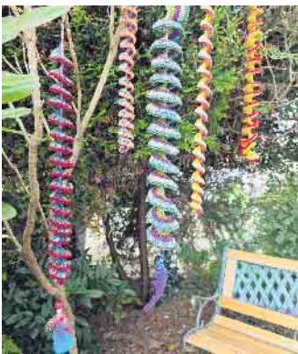
Seien auch Sie dabei, wenn die Terrasse der Villa geschmückt wird!

Am Dienstag, 23. Juli, um 10:00 Uhr, lädt die Handarbeitsgruppe der Villa Friedlinde zum gemeinsamen Aufhängen selbst gefertigter Windspiele ein. Die Leiterinnen der Handarbeitsgruppe, Karin Lautenspieler und Sandra Bach, hatten gemeinsam mit den fleißigen Künstlerinnen das Projekt „Windspiele für die Villa Friedlinde“ auf den Weg gebracht: Selbst gehäkelte, sich spiralförmig in bunten Farben windende Girlanden, teilweise geschmückt mit Perlen und bunten Federn, werden dann die Terrasse des hübschen Gebäudes verschönern.