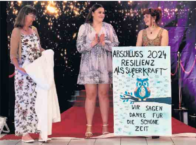
Aktiv gegen den Fachkräftemangel: Lohmar und Sieburg gratulieren den Absolvent*innen zum erfolgreichen Abschluss zum/ zur Erzieher*in.

Im Dezember 2023 sind Sieburg und Lohmar gemeinsam mit der Fachschule für Sozialpädagogik der Erziehungshilfe gGmbH in Sieburg dem Fachkräftemangel an Erzieher*innen mit einer Ausbildungsinitiative entgegengetreten: Die beiden Städte hatten sich verpflichtet, den Trägeranteil für die Einrichtung eines dritten Ausbildungszuges für die praxisintegrierte Ausbildung zum/zur Erzieher*in (PIA) zu übernehmen und in ihren Kindertagesstätten zusätzliche Ausbildungsplätze angeboten. Nun haben 56 engagierte und