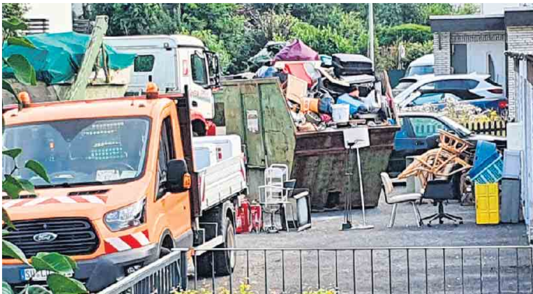
Der Müll stapelt sich in der Altenrather Straße

Sie bedankte sich bei den zahlreichen Helfern, die angepackt hatten, um den Opfern der Flut zu helfen. In der Nacht vom 14. auf den 15. Juli 2021 traten der Honsbach in Neuhoonrath, der Wahlscheider Bach in Wahlscheid und der Auelsbach in Lohmar-Ort über die Ufer. Die steigenden Wasserpegel der Bäche bedrohten die nahegelegenen Häuser. Durch die schnelle Errichtung von Sandsackbarrieren konnte die Feuerwehr in Wahlscheid und Neuhoonrath größere Schäden verhindern. In Lohmar-Ort kam zusätzlich die Beaver-Hochwas-