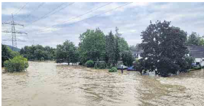
Lohmar, Brückenstraße am 15. Juli 2021 gegen 7 Uhr

In Lohmar sind heute so gut wie alle Folgen des Unwetters beseitigt, so die Stadtverwaltung. Es wurden Reparaturen und Erhaltungsmaßnahmen durchgeführt