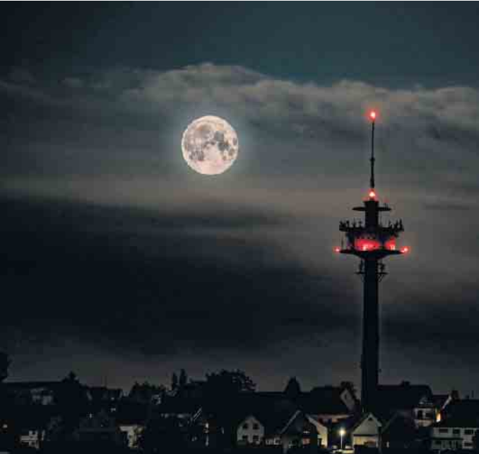
Supermond neben dem Fernmeldeturm in Lohmar-Birk

Als am 13. Juli gegen 22 Uhr der Mond aufging, befand er sich deutlich näher an der Erde als sonst. Konkret lagen zwischen der Erde und dem Mond dann nur 357.418 Kilometer. Es war der größte Vollmond des Jahres 2022. So nahe wird er erst wieder im Jahr 2034