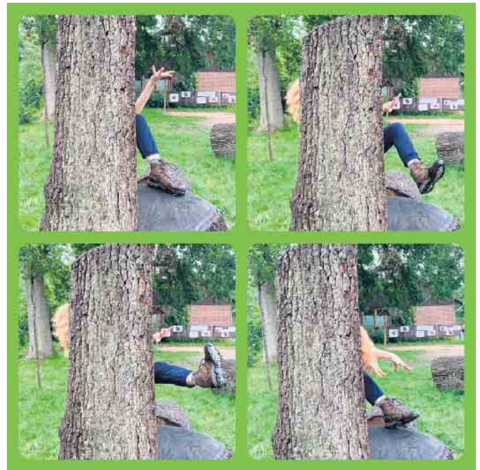
Alles ist möglich

das Bewegungstheater selbst zu entwickeln und Szenen zu gestalten. Selbst gespielte oder ausgewählte Songs von den Mitwirkenden bieten ebenfalls Möglichkeiten, sich kreativ einzubringen. In dieser fiktiven Lebenswirklichkeit finden die Jugendlichen die Chance in der Auseinandersetzung mit sich selbst, neue Formen des Ausdrucks auszuprobieren und zu finden. Die Treffen finden am 19. August, 26. August und 9. September in der Zeit von 15 bis 18 Uhr statt und am 10. September in der Zeit von 12 bis 15 Uhr. Die Teilnahme an diesem Projekt ist kostenfrei. Jugendliche, die sich gerne bewegen wollen, können sich anmelden unter 02206 2143 oder per E-Mail: Naturschule@Lohmar.de