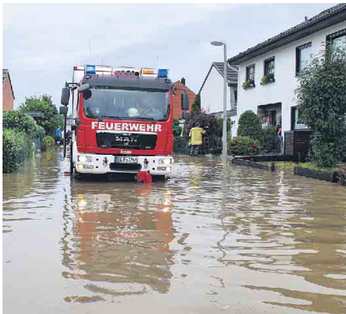
Feuerwehr im Einsatz.