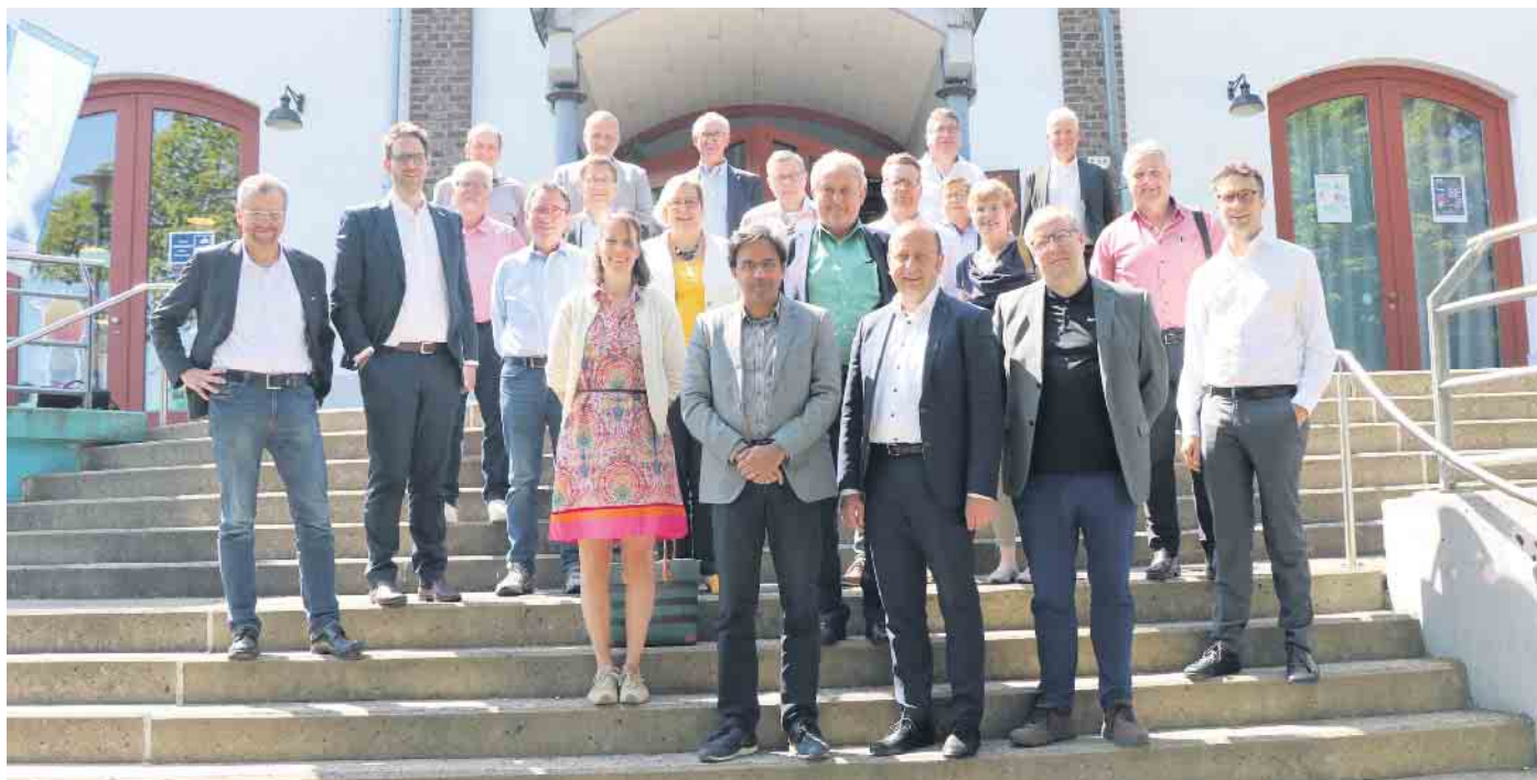
Energieagentur Rhein-Sieg: Anfang Juni trafen sich die Mitgliedskommunen der Energieagentur zur jährlichen Mitgliederversammlung in der Hennefer Meys Fabrik.