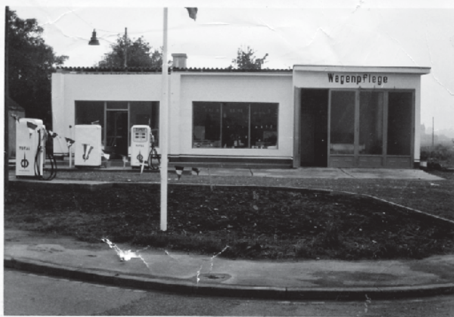
Die Tankstelle nach der Fertigstellung 1963.