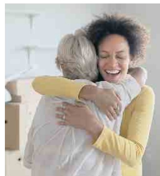
Zukunftssicher investieren: Zweitimmobilien als Studentenquartier für Kinder sind ein beliebtes Finanzierungsmodell.

Ferienwohnmobilien sind nicht zuletzt durch die coronabedingten Einschränkungen stark gefragt. Die Aussicht, im Urlaub selbst dort zu wohnen und das Domizil für das übrige Jahr zu vermieten, ist verlockend. Was so einfach klingt, sehen Banken aber oft anders. Denn die Auslastung ist schwer kalkulierbar und bei Eigennutzung gelten steuerliche Sonderregeln. Wer über ein Investment in eine Ferienwohnung nachdenkt, sollte sich einen Über-