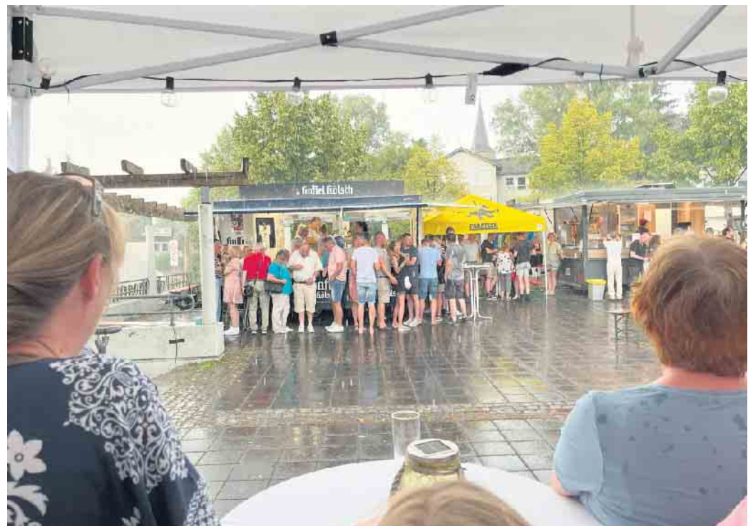
Trotz heftiger Regenschauer blieben die Besucher auf dem Kirmesplatz