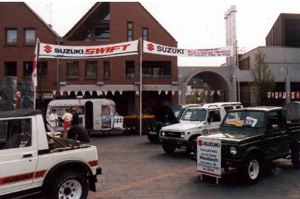
Seit 1982 Partnerschaft mit Suzuki. 1987 Ausstellung auf dem Wilhelm-Hamacher-Platz in Troisdorf-Mitte.