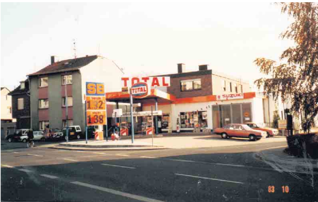
Die Tankstelle im Jahr 1984.