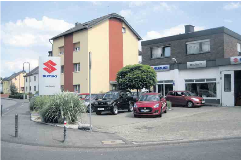
Autohaus Heubach 2023.