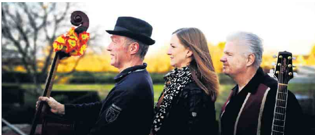
Bonner Band MAK's Trio