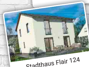
Stadthaus Flair 124