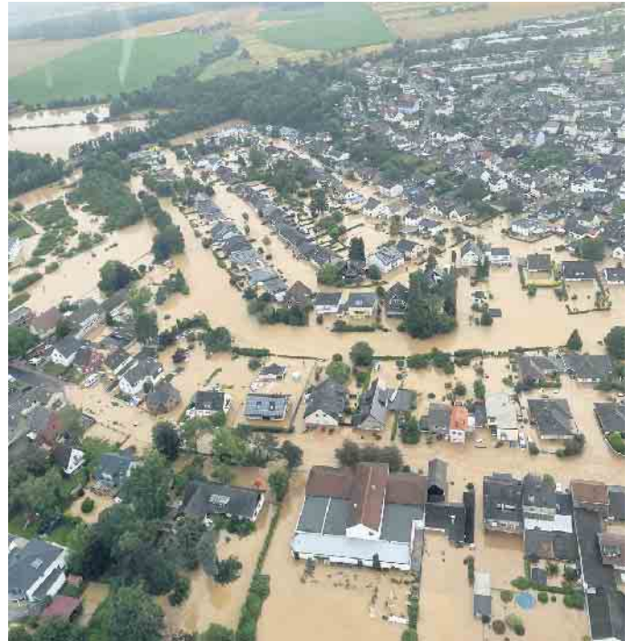
Flutgebiet in Swisttal-Heimerzheim.

In Lohmar-Donrath drohte in der Nacht auf Donnerstag, 15. Juli 2021, ein Damm der Agger zu brechen. Vorsorglich wurden die Anwohnenden in eine Betreuungsg-