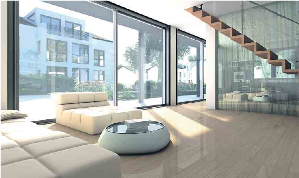
Gerade bei frei zugänglichen Terrassentüren bietet sich Sicherheitsglas besonders an.