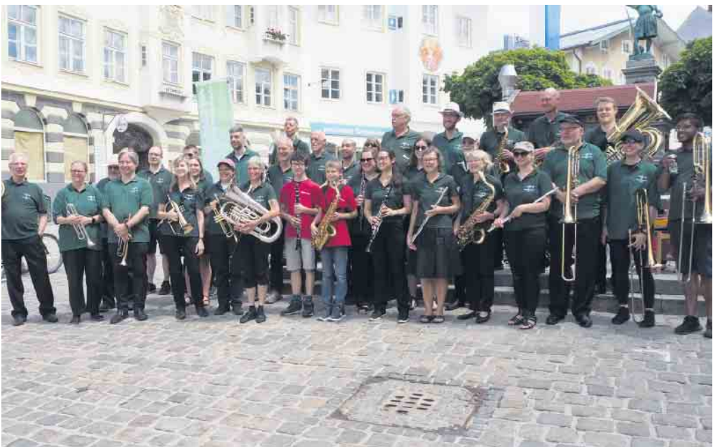
Auftritt in der Fußgängerzone von Bad Tölz

Zu Beginn der Sommerferien startete das Lohmarer Blasorchester (LBO) zu einer viertägigen Orchesterfahrt ins bayrische Höhenkirchen-Siegersbrunn südlich von