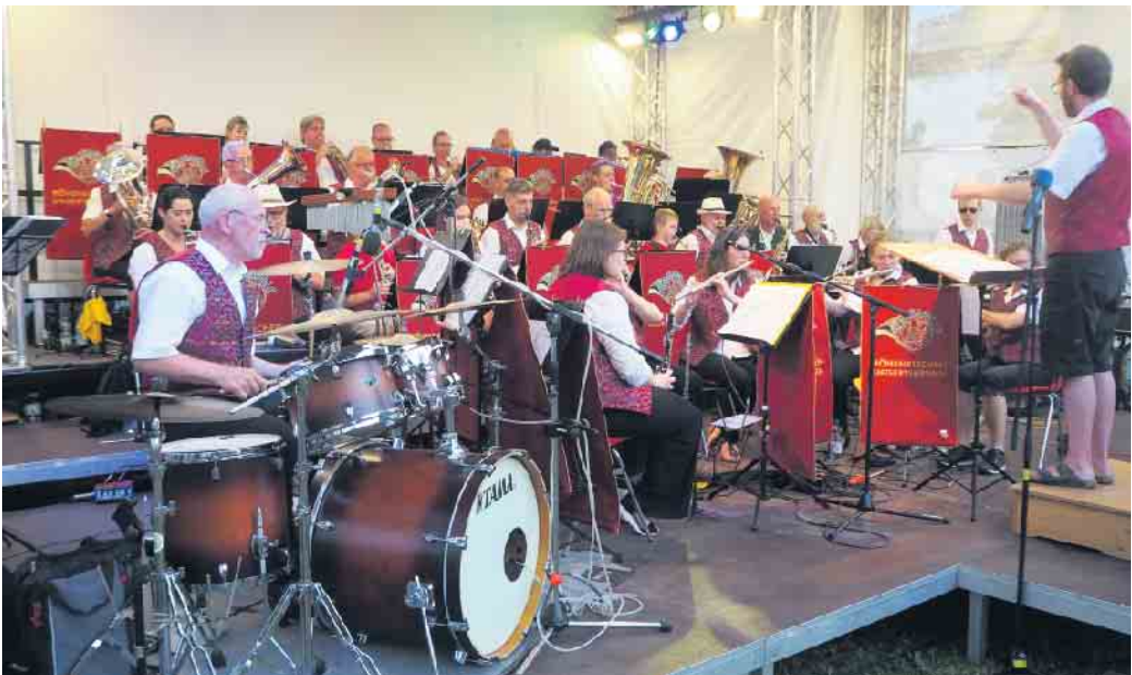
Auftritt auf dem Sonnwendfest der Blaskapelle Höhenkirchen-Siegersbrunn

Besuch der Blaskapelle Höhenkirchen-Siegersbrunn in Bayern