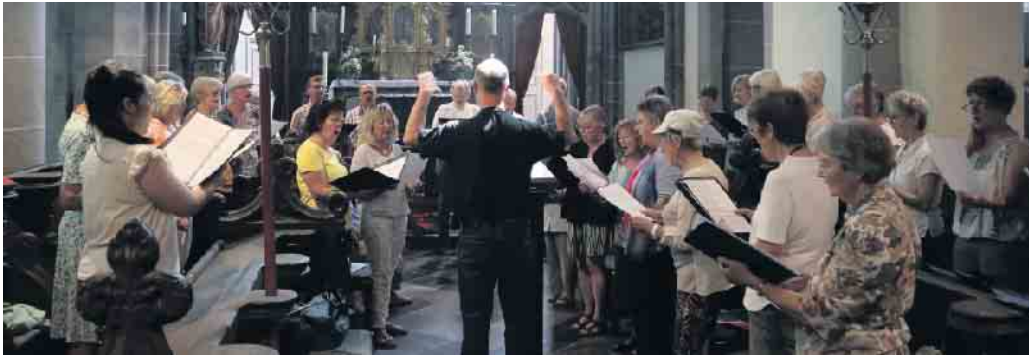
Singen in der Propsteikirche Kornelimünster.

Interessante Führungen, viel Gesang und gute Gemeinschaft