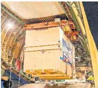
In der Holzpackmittelindustrie werden alltägliche Produkte, aber auch besonders große, schwere und empfindliche Güter sicher verpackt.

Export von Maschinen und Anlagen, noch findet man Nahrungsmittel in den Supermarktregalen. Wer es spannend findet, von Alltagsprodukten über Auto-Prototypen und Schiffsschrauben bis hin zu ganzen Kraftwerken jeden Tag etwas Neues zu verpacken, der ist bei den HPE-Unternehmen genau