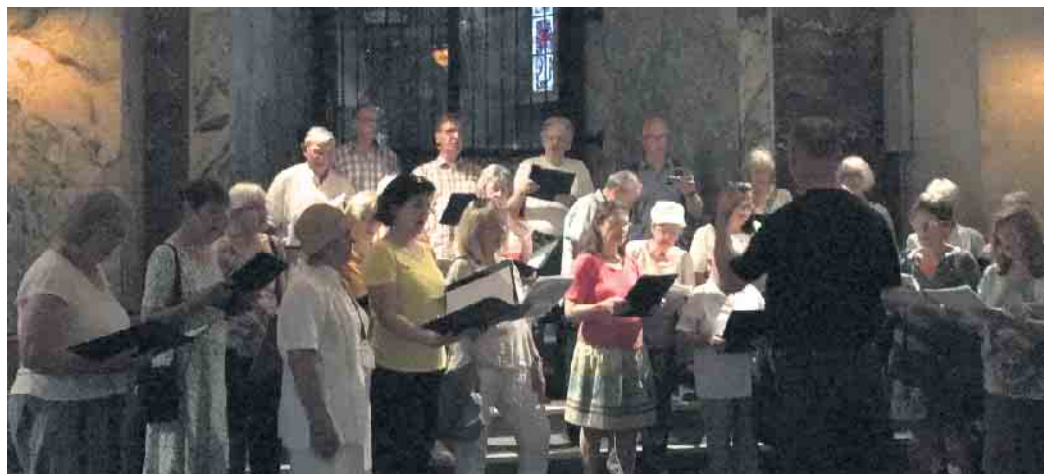
Chorauftritt im Aachener Dom

Viel Kultur, viele Gelegenheiten zu singen und viele gute Gespräche untereinander - die ohnehin tolle Chorgemeinschaft ist mit dem Ausflug noch näher zusammengedrückt und hat den Tag genossen.