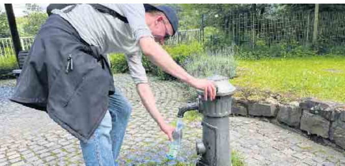
Begehr - der Wasserspender mit frischem Nass aus der Wahnbachtalsperre

Mutter mit Schulkind sucht zum 01.10.2024 eine 2,5 - 3 Zimmer-Wohnung in Lohmar. Gerne mit Balkon oder Terrasse und guter Verkehrsanbindung. Max. 700 kalt + Nebenkosten.