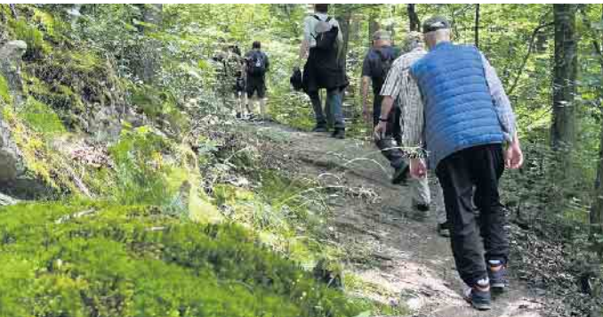
Streckenweise steil und felsig auf dem Mönchsweg bei Seligenthal

den recht steilen Mönchsweg nach Happerschoß. Im Biergarten der kleinen Gaststätte „Zur Linde“ wurden wir herzlich empfangen. Für die Esel gabs auch ein Plätzchen und einen Eimer Wasser. Nach ausgiebiger Stärkung mit leckeren Kleinigkeiten und reichlich Kaltgetränken machten wir uns auf den Heimweg über den Staudamm der Wahnbachtalsperre.