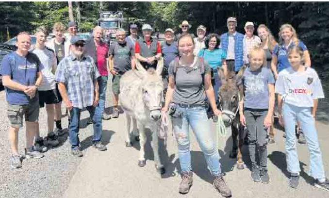
Viele nette Menschen und zwei Esel beim Start zur Wanderung nach Happerschoß.

20 Menschen und zwei Esel trafen sich zur Sommerwanderung des Heimatvereins Birk. Eine außergewöhnliche Wanderung, nicht nur wegen der Eselbegleitung sondern auch wegen des herrlichen Sommerwetters, das uns schon so lange gefehlt hatte. Die ca. 10 Kilometer lange Tour führte uns von Franzhäuschen über Seligenthal, streckenweise über