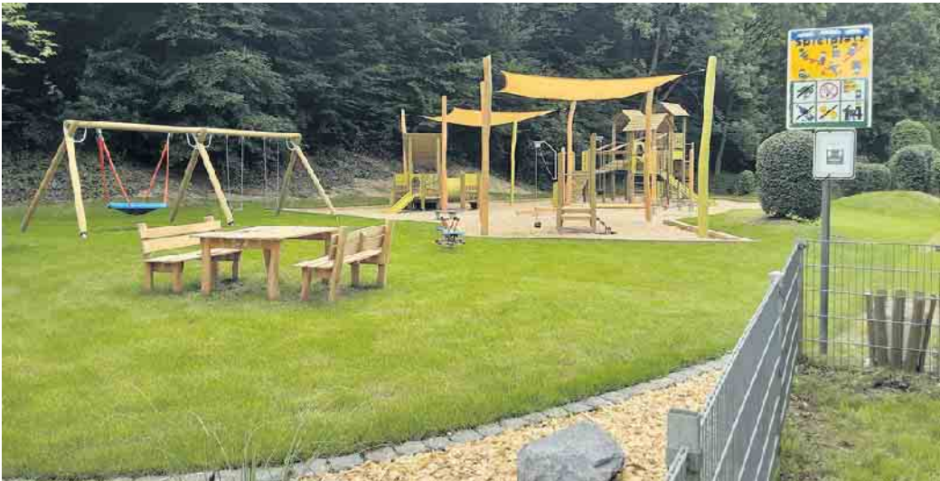
Der Kinderspielplatz Maarweg, Neuhonrath

Der Kinderspielplatz Maarweg in Neuhonrath war in den vergangenen Wochen gesperrt. Grund waren insbesondere Instandsetzungsarbeiten auf dem oberhalb gelegenen Kämpenweg, die eine Sperrung aus Sicherheitsgründen notwendig machten. Im Rahmen dieser Sperrung wurden zusätzliche Tiefbauarbeiten auf dem Spielplatz unternommen, um den in der Vergangenheit immer wieder aufgetretenen Überschwemmungen der Spielbereiche entgegenzuwirken. Sobald die Rasenfläche wiederhergestellt und der Spielplatz durch den städtischen Bauhof in einen bespielbaren Zustand versetzt worden ist, wird die Sperrung aufgehoben. Voraussichtlich ab Freitag, 5. Juli, kann der Kinderspielplatz wieder genutzt werden.