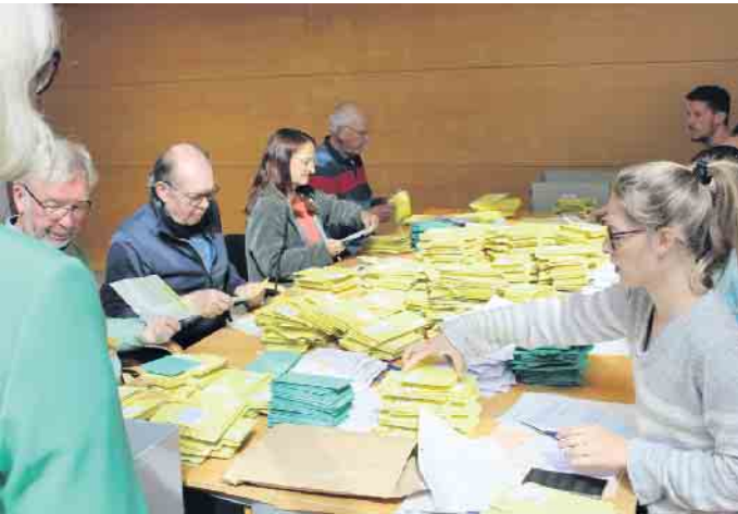
Bei der Auszählung der Stimmen hatten die Mitarbeiter*innen der Stadtverwaltung und ehrenamtliche Wahlhelfer*innen alle Hände voll zu tun.