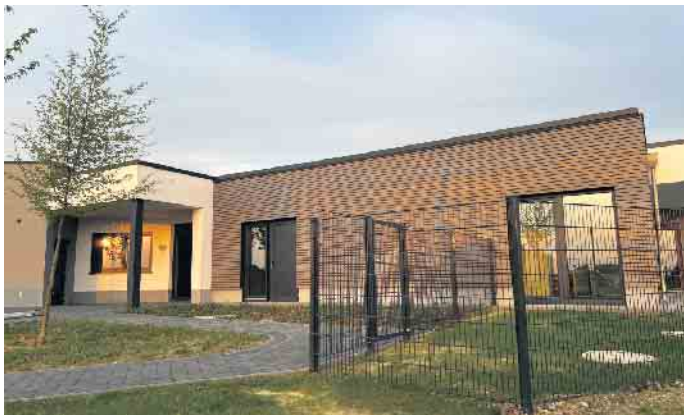
Die neue Kita Birk während der Bauphase

Ende: Aus der Arbeit der Parteien Bündnis90 / Die Grünen