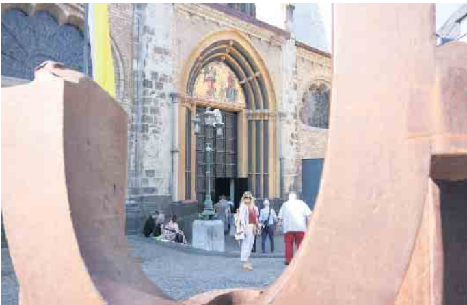
Eingang des Bonner Münster.

Helenen-Kapelle, eine Hauskapelle zu Ehren der Heiligen Helena aus dem 11. Jahrhundert (sie befindet sich im Gebäude des heutigen Kaufhauses Sinn. Auch die drittgrößte Glocke im Münster ist der heiligen Helena Augusta gewidmet - sie gilt als die Gründung der Bonner Kirche! Weiter ging es am Hauptgebäude der Universität Bonn entlang, die im 16. Jahrhundert als Residenz des Kölner Kurfürsten erbaut wurde. Im Zuge des Kölner Bistumsstreit wurde nicht nur das Brühler Wasserschloss zerstört, sondern ebenso die Kurfürstliche Residenz zu Bonn. Der Sieger Joseph-Clemens ließ auf den Ruinen Schloss Augustusburg errichten, wie auch die Kurfürstliche Residenz Ende des 17. Jahrhunderts wieder aufbauen. 1777 brannte das Gebäude erneut nieder und urde wieder aufgebaut. 1818 wurde in dem Gebäude die neu gegründete Friedriche-