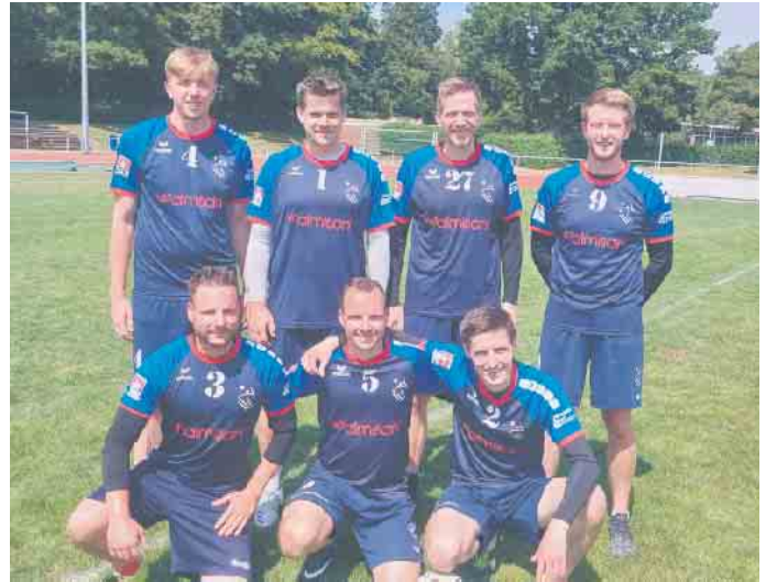
TVW-Faustballer schließen Verbandsliga-Saison mit guter Leistung am letzten Spieltag auf Platz 4 ab.

und es somit das Spiel 3:0. Für das Spiel mit dem Tabellenzweiten TV Voerde stellte man nun um. Von der neuen Formation versprach man sich, besser mithalten zu können, was sich auch auszahlte: es entwickelte sich ein munteres Verbandsliga-Spiel auf wirklich gutem Niveau. Insgesamt war man den Männern vom Niederrhein ebenbürtig, leistete sich aber leider in den entscheidenden Phasen immer ein paar Fehler, sodass Voerde 0:2 in Führung gehen konnte (9:11, 8:11). Im dritten Satz hatte sich der TVW zum Satzende den Vorteil erarbeitet, vorlegen zu können. Bei 15:14 kam man verdient zum Satzanschluss. In Satz vier startete man etwas unglücklich und lag direkt 0:2 und 1:5 hinten. Auch wenn sich der TVW durch eine taktische Veränderung wieder etwas herarbeiten konnte, reichte es nicht mehr zum