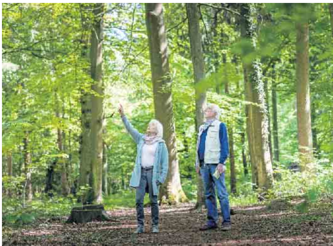
Einen Bestattungsbaum kann man sich bei einem Waldspaziergang selbst aussuchen. Die Alternative ist ein virtueller Rundgang.

Bei einer Waldbestattung verbleibt die Asche der verstorbenen Person in einer biologisch abbaubaren Urne, sodass sie irgendwann automatisch wieder in den Kreislauf der Natur übergeht. Der Anbieter FriedWald beispielsweise ermöglicht in Kooperation mit Kirchen und Forstverwaltun-