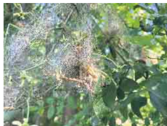
Raupen der Gespinnstmotte

Gerade in warmen, trockenen Frühjahren vermehren sich die Schädlinge besonders gut - zur Freude von Blaumeisen und anderen Vögeln, deren Brut von diesem Schlaraffenland profitiert. Was geschieht nun mit den Bäumen, wenn sie keine brauchbaren Blätter mehr haben? Für diesen Fall hat sich die Natur eine ganz besondere Einrichtung einfallen lassen, die man um den