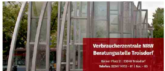
Verbraucherzentrale NRW, Beratungsstelle Troisdorf

Die Verbraucherzentrale gibt in dem Vortrag Tipps wie unseriöse Firmen im Internet, aber auch