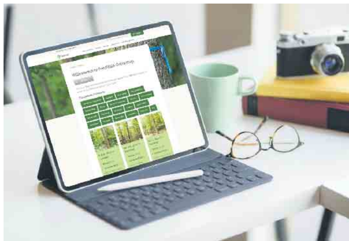
Ein Urnenbegräbnis im Wald lässt sich auch online organisieren.

gen Baumbestattungen an rund 80 ausgewiesenen Standorten. Jeder ist ein nach öffentlichem Recht genehmigter Friedhof im Wald.