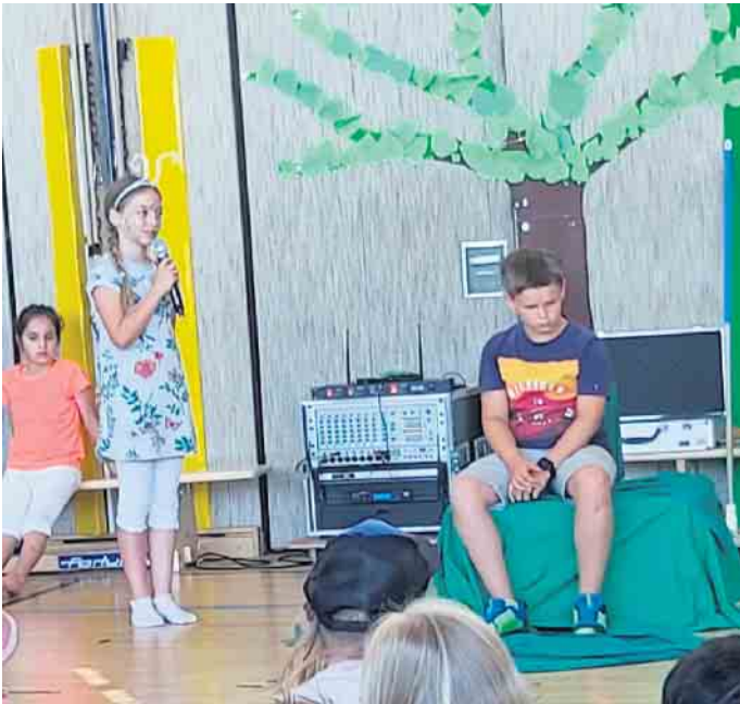
Eine von vielen Szenen des Musicals

Situationen. Deswegen geht ihnen die Lage der armen Kinder im globalen Süden nahe. Deswegen engagieren sie sich genau dafür. Die Kostüme, natürlich aus eigener Produktion, waren einfach, die Materialien zum Teil gebraucht. Auch dies ist Ergebnis der Grundhaltung: Wiederverwendung von Textilien bedeutet Abfallvermeidung und Arbeit wertzuschätzen. Phantasie und Kreativität der Kinder werden durch diese Zurückhaltung bei den Materialien geradezu beflügelt. Die Kinder der Schule und der Abschlussjahrgänge der KiTas waren begeistert. Sie quittierten den DarstellerInnen deren Leistung mit tosendem Applaus. Gabriele Krichbaum