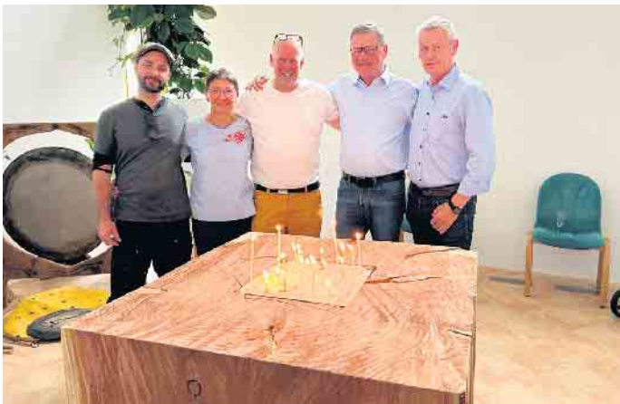
Die „Neue Mitte“ im Raum der Stille wird feierlich in Empfang genommen

Der Raum der Stille im Elisabeth-Hospiz ist ein besonderer Ort. Er ist eine Quelle der Kraft - ein ruhiger Rückzugsort für alle Menschen im Hospiz. Unsere Hospizgäste, ihre Angehörigen, aber auch unsere Mitarbeiter können in diesem architektonisch besonders gestalteten Raum mit der hohen Kuppeldecke und dem eingelassenen Sternenhimmel die Türe hinter sich schließen und zur Ruhe kommen. Nach vielen Überlegungen und