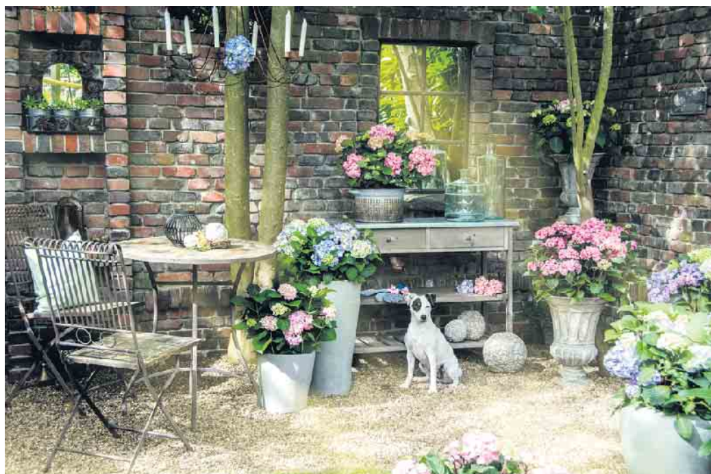
Ein echtes Must-Have für jeden Cottage-Garten.

An sonnigen Tagen am Abend ausreichend wässern - aber Staunässe im Kübel vermeiden.