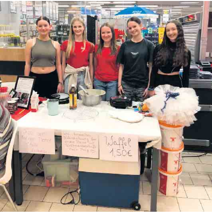
Die Tänzerinnen des JMDClub

Mit diesen positiven Eindrücken endet ein anstrengender, aber ertragreicher Tag für alle Beteiligten. Die Gespräche und Begegnungen am Fairtrade-Stand waren bereichernd und zeigten das starke Gemeinschaftsgefühl in Lohmar.