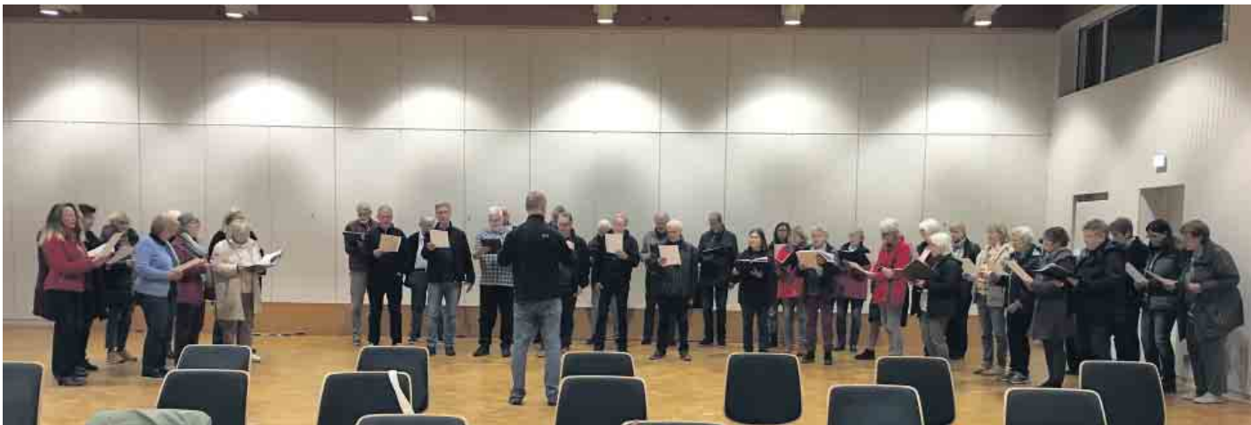
Intensive Probenarbeit.

Neuer Probenblock hat begonnen- Schwerpunkt auf Klassik und sakraler Musik