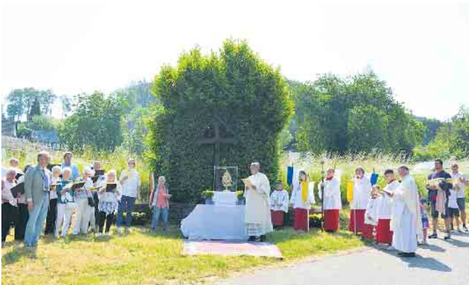
Am 4. Segensaltar unterhalb des Pfarrhofes stimmte der Kirchenchor Neuhonrath ein weiteres Lied ein.