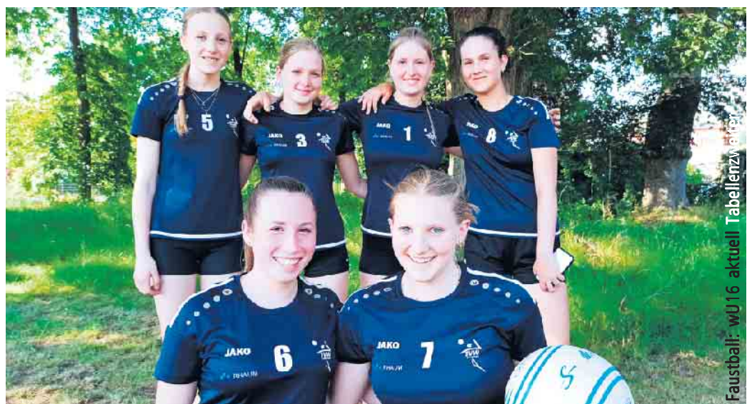
Faustball: wU16 aktuell Tabellenzweiter

Nach einem Spiel Pause, was den Mädchen bei dem heißen Wetter sichtlich gut tat, ging es mit neuer Energie gegen Bayer 04 Leverkusen. Hier war ein deutlicher Unterschied zu erkennen. Die Wahlscheiderinnen waren den Leverkusenern überlegen und gewannen beide Sätze, relativ eindeutig (6:11, 5:11). Für das letzte Spiel des Tages musste das Team