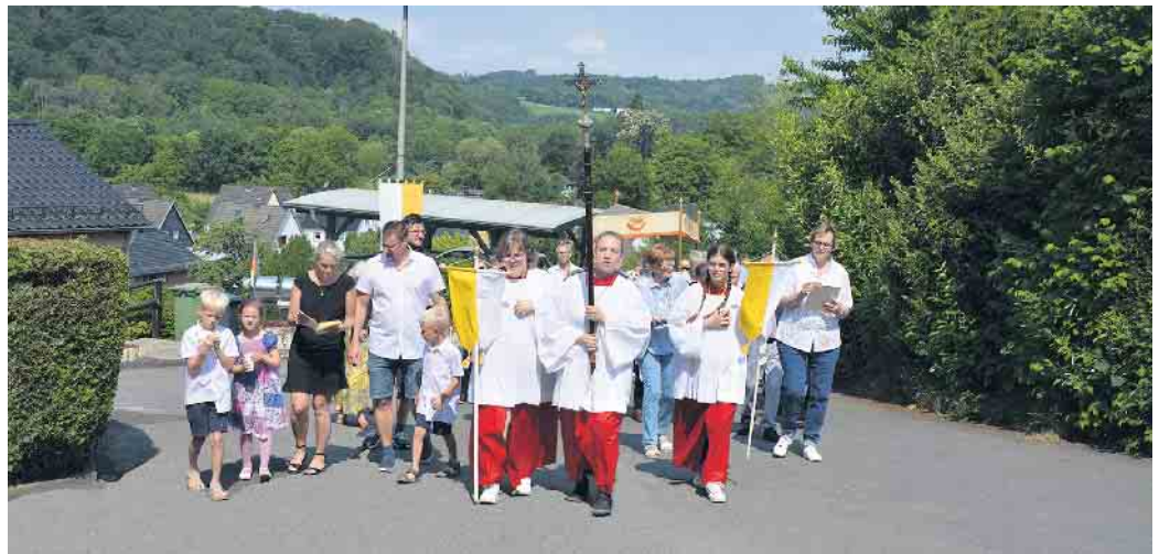
Die Fronleichnamsprozession kehrt zur Kirche St. Mariä Himmelfahrt zurück, wo das Hochfest in einem Gottesdienst ausklingt.

Von dort zogen die Pilger wieder zur Pfarrkirche, wo abschließend ein Gottesdienst zum Hochfest Fronleichnam gefeiert wurde.