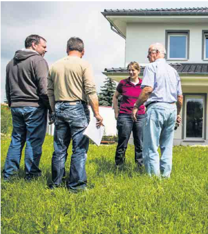
Auf der Suche nach einem Baupartner fürs Eigenheim kann man auch Erfahrungen ehemaliger Bauherren einholen und Referenzobjekte besichtigen.