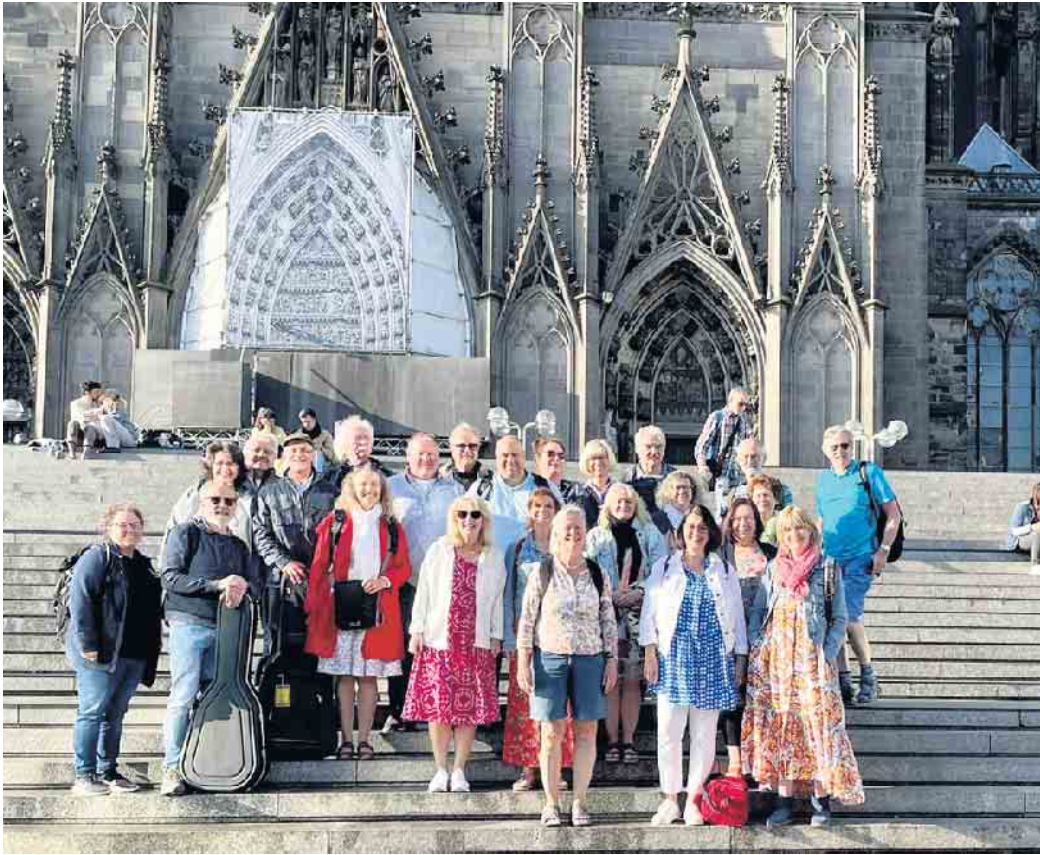
Voce auf Achse.

Die malerische historische Altstadt bietet typische Fachwerkhäuser und Gelegenheit zum Shoppen und zur gastronomischen Einkehr. Am Rhein in der Sonne zu sitzen, bei Flammkuchen und Wein die Seele baumeln zu lassen, tat uns allen gut und hätte schöner nicht sein können. Am späten Nachmittag ging es mit dem Schienenbus am Rhein entlang wieder zurück nach Köln. Noch einmal wurden die Gitarren ausgepackt und in bester Stimmung kamen wir in Honrath an.