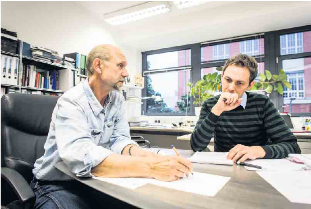
Um das beste Bauunternehmen aus verschiedenen Angeboten herauszufiltern, können künftige Bauherren den Rat unabhängiger Bauherrenberater in Anspruch nehmen.

Die Angebots- und Vertragsprüfung durch einen unabhängigen Bauherrenberater gibt hier mehr Sicherheit und schützt vor Fehleinschätzungen. Sie sollte vor der Vertragsunterzeichnung stattfinden, da nach der Unterschrift keine Änderungen mehr vorgenommen werden können. (DJD)