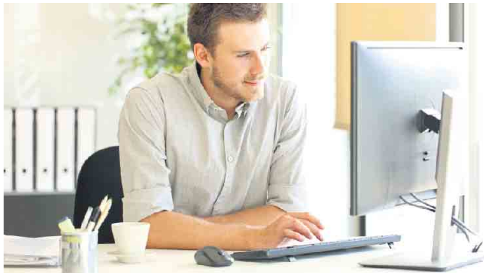
Die fortschreitende Digitalisierung verändert die Anforderungen an die Beschäftigten im Bankwesen rasant.

Für Abiturienten, die sowohl ein Studium als auch eine praxisbezogene Ausbildung absolvieren wollen, ist das duale System eine interessante Perspektive. Die Studierenden lernen wie bei einer normalen Ausbildung die Kundenberatung in der Filiale kennen und arbeiten in verschiedenen zentralen Abteilungen wie der Kreditabteilung, dem Marketing oder dem Controlling mit. Parallel absolvieren sie an