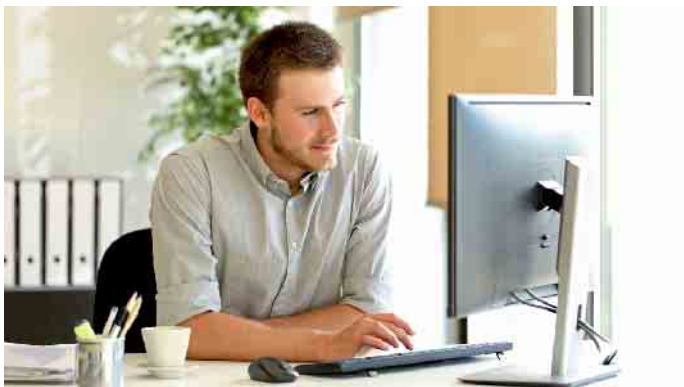
Die fortschreitende Digitalisierung verändert die Anforderungen an die Beschäftigten im Bankwesen rasant.

Am Anfang der Tätigkeit in der Bank muss nicht zwingend die klassische