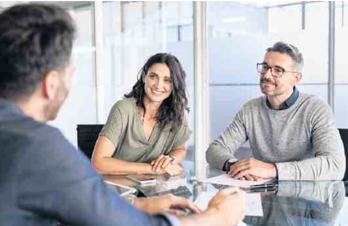
Vergleichen lohnt sich: Wer vor der Anschlussfinanzierung für eine Immobilie steht, sollte verschiedene Optionen prüfen.