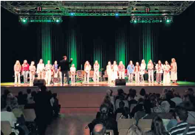
Auftritt des von Christian Beck geleiteten Schulchors