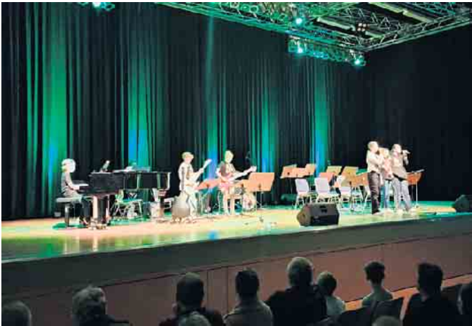
Auftritt einer neu gegründeten Band jüngerer Schülerinnen und Schüler

Musikensembles des Gymnasiums begeistern in der Jabachhalle