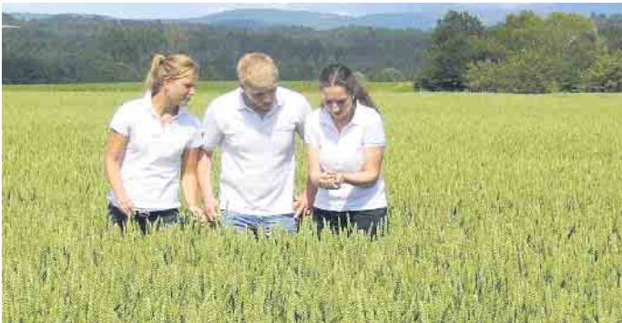
Genauere Kenntnisse über das Naturprodukt Getreide gehören zu den Grundlagen des Müllerberufs.

Der Müllerberuf bietet vielseitige und zukunftsichere Arbeitsplätze