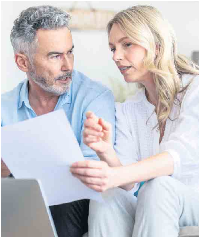
Eine professionelle Beratung zu Fragen der Anschlussfinanzierung ist heute auch online möglich.