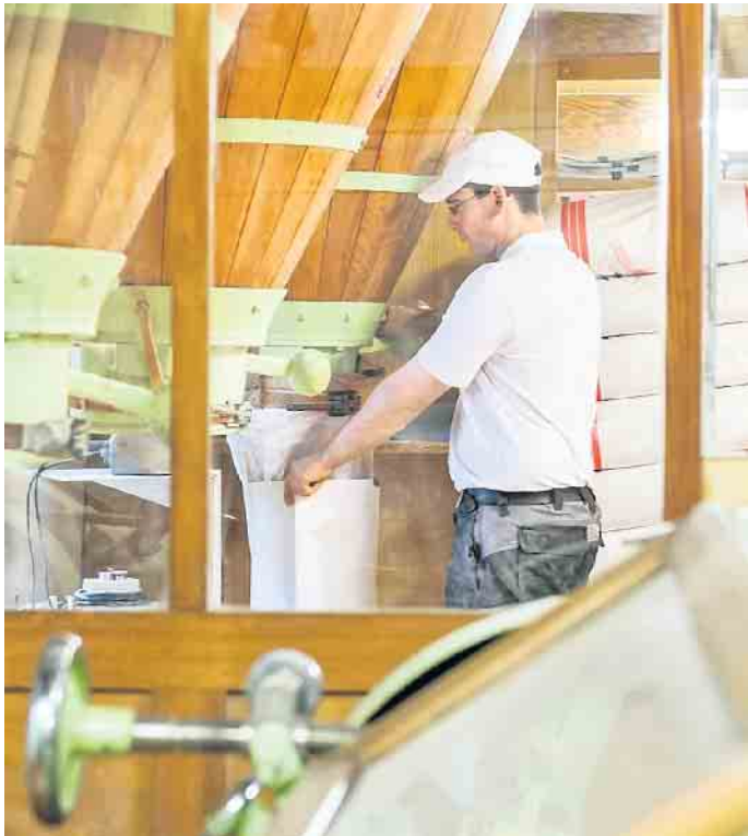
Der Müllerberuf bietet eine sichere Zukunft und zahlreiche Karrieremöglichkeiten im In- und Ausland.