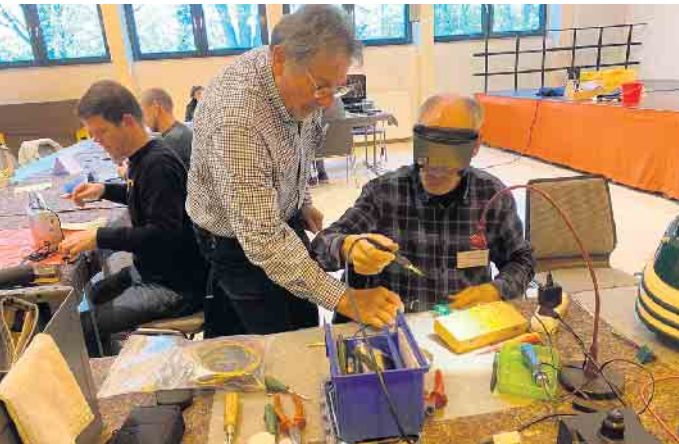
Am Samstag, 22. Juni, steht Ihnen das Repaircafé-Team bei Problemen mit Klein-Elektroteilen, Garten- und Rasengeräten,

Der Juni hat angefangen und wie es schon seit vielen Jahren Tradition ist, ist der letzte Sonntag dieses Monats dem beliebten Sommerfest „Honrather Sonntag“ vorbehalten. Die Vorbereitungen der veranstaltenden Chöre (Frauenchor „Harmonie“ Honrath und MGv „Eintracht“ Honrath) laufen auf Hochtouren, um den Besuchern (hoffentlich aus nah und fern) einen unvergesslichen Tag zu bieten. Natürlich gibt es „Altbewährtes“: wie immer kann die Küche kalt bleiben, denn es gibt viele Schlemmereien, u.a. die „Honrather Pfanne“, Reibekuchen und Leckeres vom Grill; die Cafeteria und die Waffelbäckerei sind für das Süße zuständig; die Cocktaillbar hat u.a. den „Honrath Sunrise“ für Groß und Klein (den natürlich ohne Alkohol) auf der Karte. Aber außer dem kulinarischen Vergnügen lockt auch die Tombola mit einer hohen Trefferquote und schönen Preisen. Die Ausstellung der Trecker aus der Nachbarschaft ist sicher wieder ein Publikumsmagnet und die Kinderanimation wird dieses Jahr durch die Neu-honrather Pfadfinder unterstützt. Nicht zu vergessen: die Chöre werden mit einigen Beiträgen selbstverständlich auch wieder dabei sein. Aber als besondere Attraktion gibt es dieses Jahr Live-Musik der „Music Factory“ aus Siegburg! MGv und FC freuen sich auf zahlreiche Besucher, man sieht sich! Möchten Sie mehr über die Chöre erfahren, besuchen Sie unsere Webseiten: https://www.frauenchor-harmonie-honrath.de/ https://mgv-honrath.eu