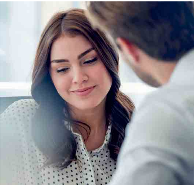
Bankkauffrau beziehungsweise Bankkaufmann zählen zu den wichtigsten Ausbildungsberufen in Deutschland.