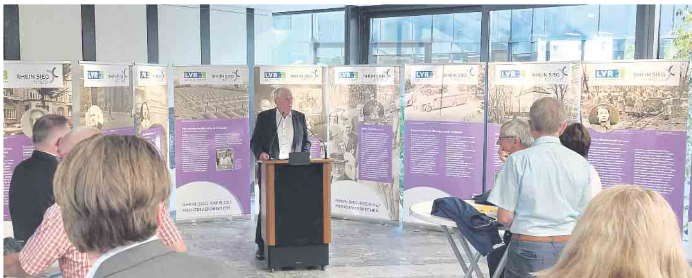
Landrat Sebastian Schuster (am Rednerpult) bei der Eröffnung der Ausstellung.

Eröffnung der Ausstellung durch Landrat Sebastian Schuster