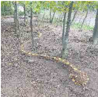
Was krecht und fleucht denn da?

Achtung: Live und in Farbe - das Highlight zum WaldTheater