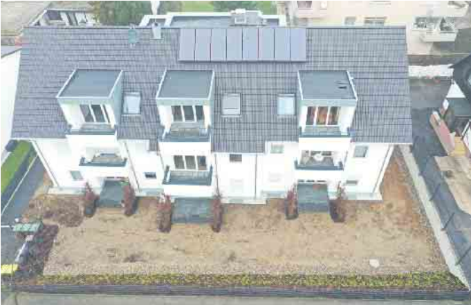
Das Dachdeckerhandwerk, der richtige Ansprechpartner für die Solaranlage auf dem Dach.

Im Bereich Gebäudesektor liegt Deutschland im Vergleich mit den zwanzig wichtigsten Industrie- und Schwellenländern bei der Energieeffizienz im Neubau vorne. Die weniger gute Nachricht ist die schleppende energetische Sanierung bei älteren Gebäuden. Einer der Gründe sind unzureichende Renovierungsraten. Angestrebt werden müsse mindestens eine Verdoppelung der derzeitigen Rate, die aktuell bei 1 % liegt. Besser noch wäre nach Meinung der Klimaexperten eine Rate von 3,5 %. Hier kommt das Dachdeckerhandwerk ins Spiel: Sie führen geeignete Maßnahmen wie Wärmedämmung an Wänden, am Dach oder an der oberen Geschossdecke aus, durch die schon viel Energie eingespart werden kann. Dachdecker und Dachdeckerinnen sind wichtige Berater, wenn es darum geht, welche Maßnahmen sinnvoll sind, aber auch, welche Fördergelder infrage kommen. Zum Beispiel lassen sich durch Kredite bei der KfW oder der Nutzung von Steuerermäßigungen für energetische Sanierungen auch im privaten Wohnungsbau deutliche Einspareffekte erzielen. „Dachdecker sind daher ganz wichtige Akteure, wenn es um das Erreichen der Klimaschutzziele geht, denn sie sind Spezialisten, die die notwendigen Sanierungs-Maßnahmen im Gebäudebestand planen und durchführen“, erläutert Claudia Büttner, Pressesprecherin beim Zen-