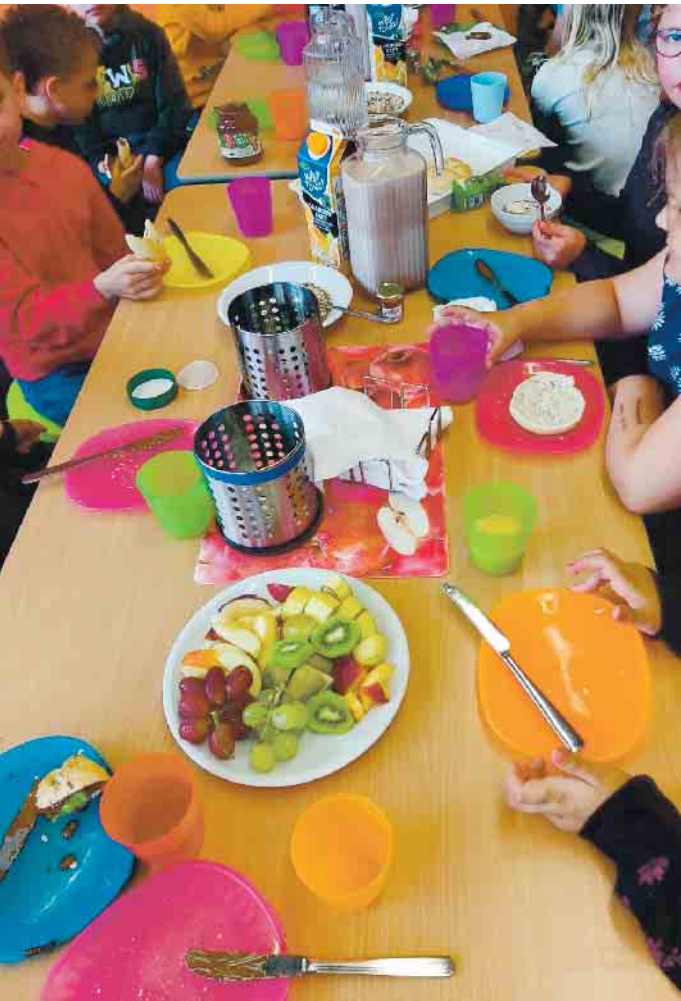
Eine bunt und fair gedeckte Frühstückstafel