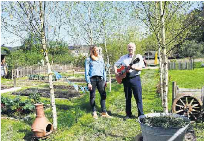
Die Dorfweise Schachenauel bietet für Alt und Jung viele Möglichkeiten des Zeitvertriebs