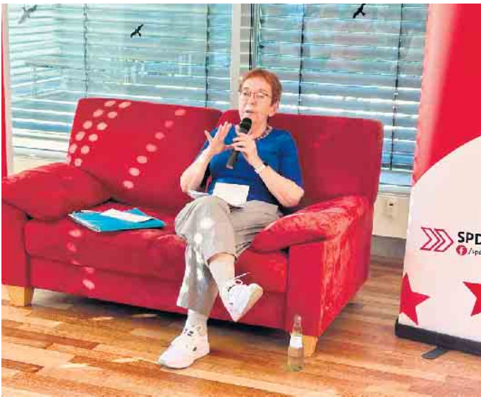
Lale Akgün auf dem roten SPD Sofa.