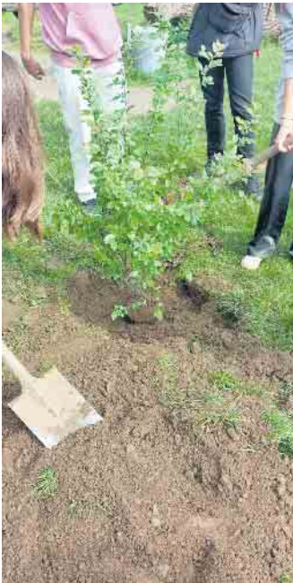
Baumpflanzaktion am Aggerbogen

einem Besuch im Kletterwald testeten die Schüler*innen ihre Grenzen aus und trauten sich gemeinsam große Höhen zu erklimmen. Es wurde viel geredet, gelacht und beim Abschiedsfest in der Gesamtschule auch gemeinsam getanzt, gegessen und gefeiert. Alle Teilnehmer*innen des ERASMUS+ Projekts konnten unvergessliche Erfahrungen und Eindrücke sammeln.