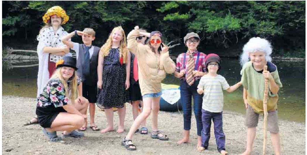
Wie werden König Günther und sein Hofstaat im Jahre 2043 leben?

Anmeldung bitte unter: Naturschule@Lohmar.de