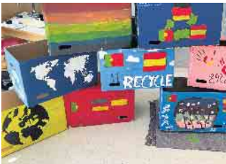
Papiersammelbehälter für die Mülltrennung im Klassenraum

damit ein bleibendes Zeichen für Nachhaltigkeit. Die Schüler*innen näherten sich dem Thema Nachhaltigkeit jedoch auch ganz praktisch: Gemeinsam wurden Papiersammelbehälter für die Klassenräume gestaltet und mit Recycling-Symbolen und ERASMUS+ Logos verziert. Ein besonders wichtiger Aspekt in ERASMUS+ Projekten stellt darüber hinaus der Austausch und das gegenseitige Kennenlernen von Schüler*innen verschiedener europäischer Länder dar. Die Schüler*innen aus Portugal und Spanien waren für eine Woche zu Gast bei Schüler*innen der Gesamtschule Lohmar und berichteten, wie herzlich sie in ihren Gastfamilien aufgenommen wurden. In der gemeinsamen Woche entstanden viele Freundschaften, Sprachkenntnisse wurden unbeschwert erprobt und vertieft. Bei