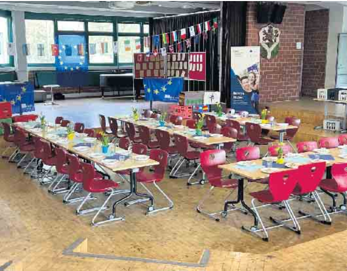
Abschlussfeier in der Gesamtschule Lohmar

Abschließendes ERASMUS+ Treffen an der Gesamtschule Lohmar mit Schüler*innengruppen aus Madrid und Alverca