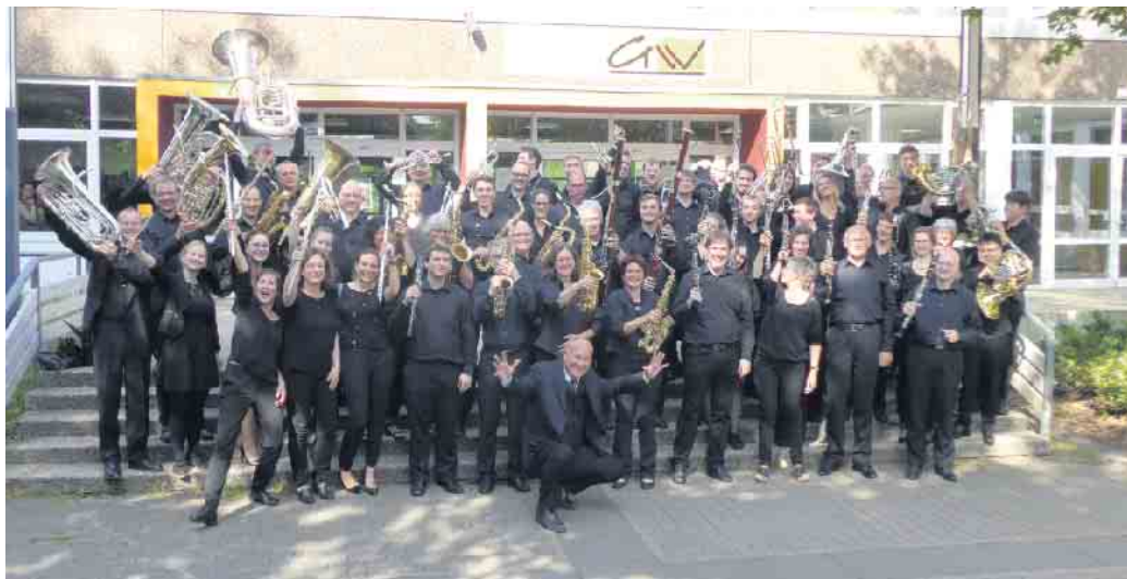
Orchesterphoto 2019 vom Bundesmusikfest