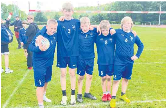
TVW Faustballer der männlichen U14 starten in die Feldsaison.

Das Team der mU14 des TV Wahlscheid musste zum Saisonauftakt auf Finn W. und Felix v.N. verzichten und