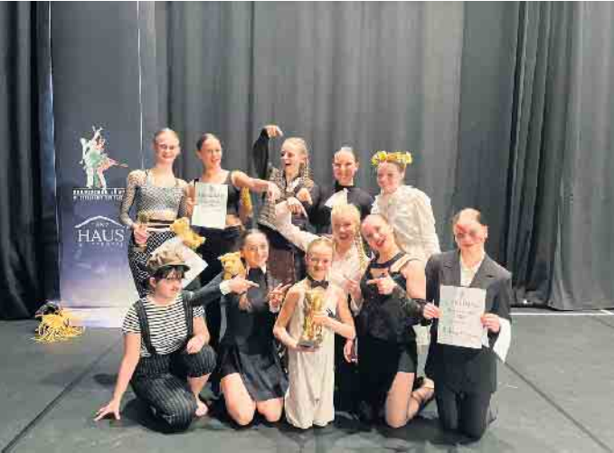
Backyard Dance Company: Beste Gruppe Teenies

Am vergangenen Wochenende fand der Bergische Löwe in Wuppertal statt, ein aufregender Wettbewerb für Tanzgruppen und Solistinnen. Die talentierten Tänzerinnen aus Lohmar haben sich in diesem hochkarätigen Umfeld hervorragend geschlagen. Die