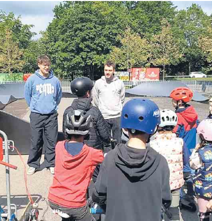
Die Coaches von Wheelart aus Köln erklärten zur Eröffnung, wie man den Pumptrack am besten befährt.