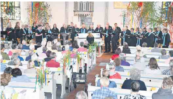
Miteinander-Chor Wahlscheid 1879 e.V.

ven „Zärtliche Liebe - ich liebe dich“ aus der Zeit der Wiener Klassik, 1795 komponiert, als er 25 Jahre alt war. Das Publikum flog mit der bekannten Filmmusik „Lenas Song“ in den Himmel und wiegte sich im Takt des weltbekannten Hits von Michel Sardou „La maladie d’amour“, der die Krankheit der Liebe beschreibt. Beendet wurde die musikalische Reise im Hier und Jetzt mit Ed Sheerans „Perfect“, eine Ballade über eine Freundschaft, aus der die große Liebe wird. Das Ensemble „Quodlibet“ und das Duo „Horizont“ trugen jeweils zwei Titel bei. Unter Mitwirkung des begeisterten Publikums endete das Konzert mit einer Zugabe „Die Liebe gewinnt“ von Brings.