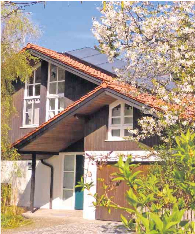
Viele Menschen in Deutschland wohnen in älteren Ein- und Zweifamilienhäusern, in denen früher oder später Sanierungen anstehen.

Sie unterstützen Hauseigentümer auch dabei, wirtschaftliche und nachhaltige Lösungen zu definieren und vertragliche Vereinbarungen mit Bauunternehmen fachlich und juristisch zu prüfen. In der eigentlichen Umsetzungsphase können sie zudem eine Bauqualitätssicherung übernehmen, mit der sich Mängel frühzeitig entdecken und Folgeschäden vermeiden lassen. (DJD)