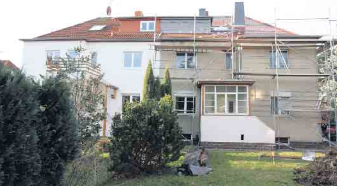
Laut einer aktuellen Verbraucherschutzstudie sind Baumängel auch in der Sanierung von Altbauten keine Seltenheit.

Renovierungen richtig planen und sicher durchführen