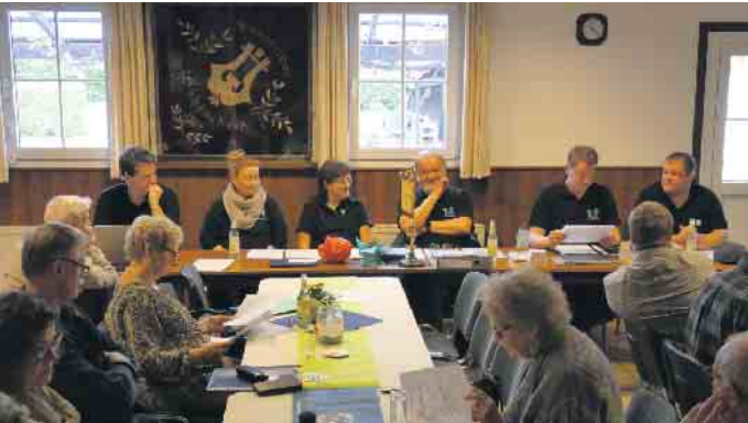
Gute Laune während der Mitgliederversammlung.