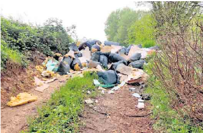
Ein großer Haufen „wilder Müll“ zwischen Kellershohn und Bach (Ende April).

insbesondere für Anwohner äußerst unangenehm ist und zusätzlich auch Schädlinge anlocken kann. In einigen Fällen konnten, dank der Hilfe von Mitbürger*innen, die Verursacher ermittelt werden. Die Ablagerung von wildem Müll ist kein Kavaliersdelikt. Es handelt sich um eine Ordnungswidrigkeit, die mit einer Geldbuße bis zu 100.000 EUR geahndet werden kann. Ablagerungen von wildem Müll können über den oben angegebenen Kontakt gemeldet werden oder ganz bequem über den „Mängelmelder“ der Stadtverwaltung unter Mitreden.Lohmar.de/bms oder die Mängelmelder-App.