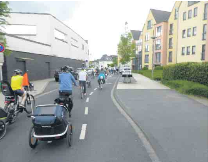
Der Demonstrationszug in der Vila Verde Straße.