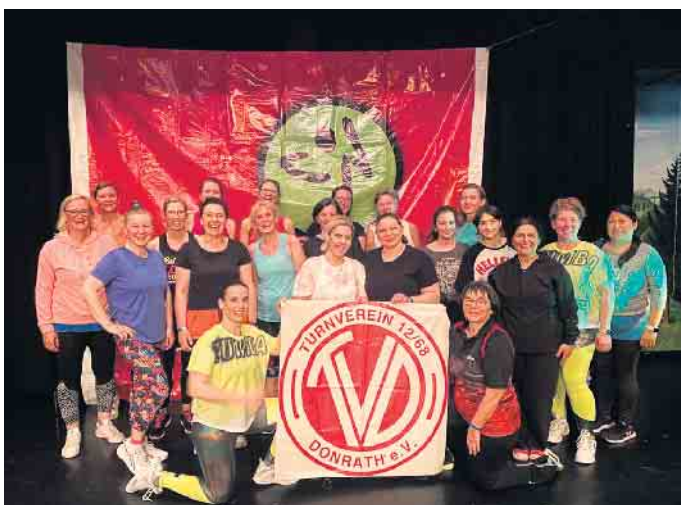
Zumba mit dem TV Donrath