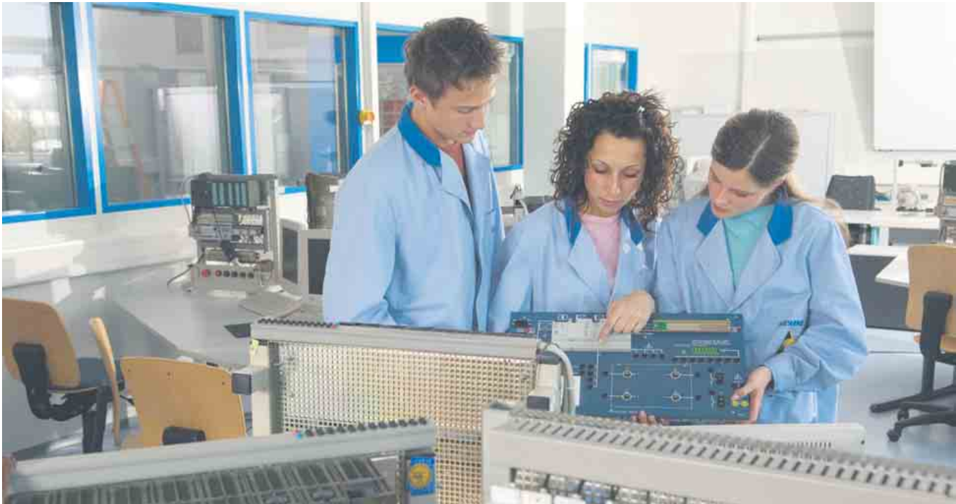
Während eines Praktikums gewinnt man Einblicke ins Berufsleben.

Praktikum nutzen und Praxiserfahrung sammeln