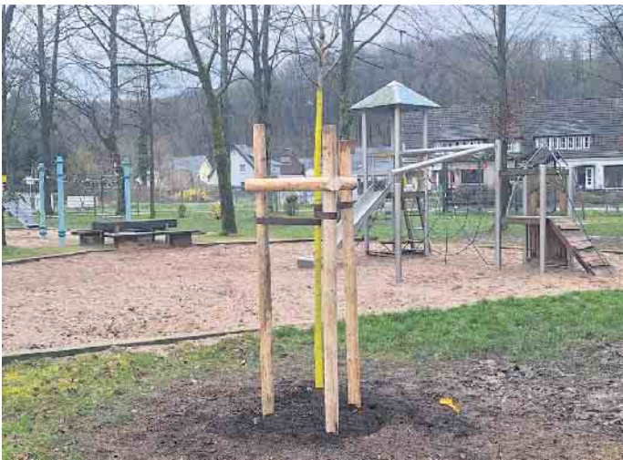
Noch ist der gepflanzte Speierling ein kleines Bäumchen auf dem Spielplatz Donrath.

Der Speierling ist eine wichtige Bienenweide und ein Vogelnährgehölz. Aber auch Nagetiere, Marder, Dachse, Rehe und Wildschweine fressen seine Früchte gerne.