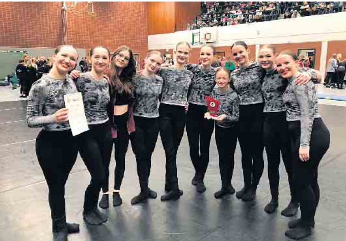
erster Platz Pokal übergabe

Der JMD CLub Lohmar e.V. hat eine neue Mannschaft und steht direkt auf dem Treppchen