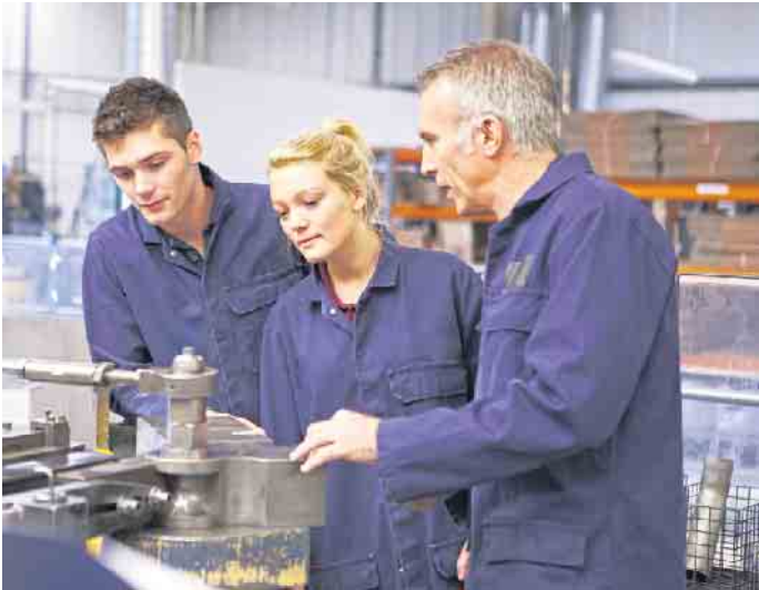
Ein Angebot wie die betriebliche Krankenversicherung wird als besondere Wertschätzung durch den Chef empfunden: Man wird im Freundeskreis gerne davon erzählen und Werbung für die eigene Firma machen.