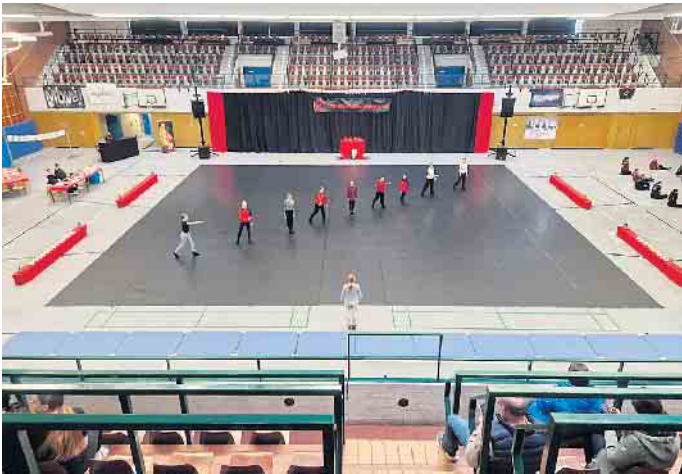
Eintanzen in Herne auf der Turnierfläche