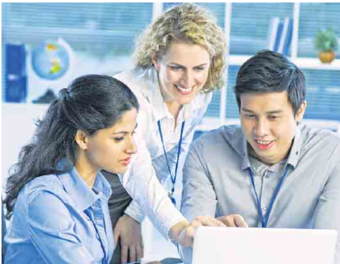
Motivierte und gut ausgebildete junge Menschen erwarten bei ihrem künftigen Arbeitgeber nicht nur ein schönes Gehalt und gute Karrierechancen - auch das Drumherum muss stimmen.