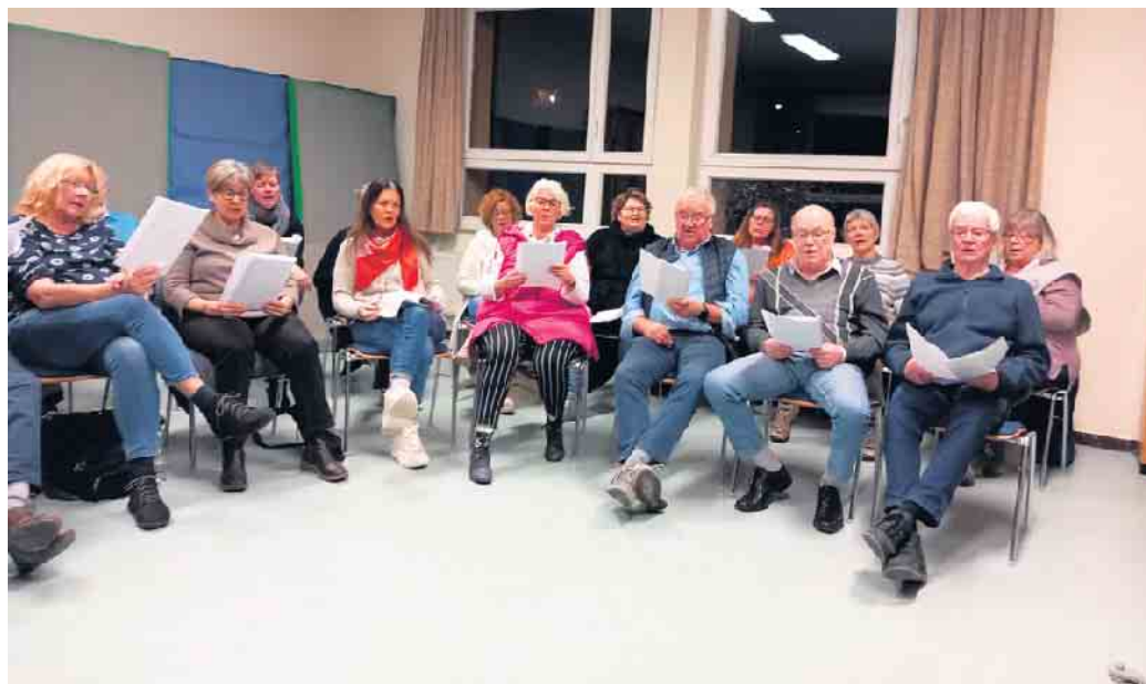
offenes Singen in lockerer Runde

Die Sänger des Männerchor MGV Eintracht Honrath freuen sich auf ihren Besuch zum offenen Singen.