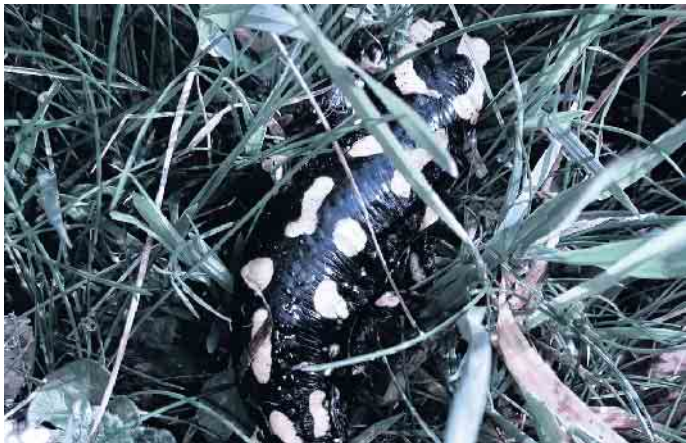
Was krecht und fleucht denn da?

Tiere vorsichtig aufgespürt und ihr Verhalten beobachtet. Leitung: Dobrosława Wiese Termin: Samstag, 23. März, 20 bis 22 Uhr Kosten: 10 Euro je Erwachsener und 5 Euro je Kind Weitere Informationen unter Telefon: 02206 2143 oder per E-Mail unter: Naturschule@Lohmar.de