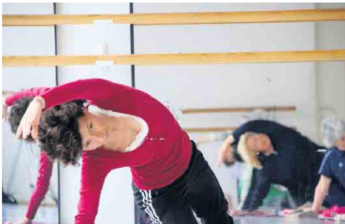
Pilates für jedes Alter möglich

Internetseite. Holen Sie sich eine Verordnung von Ihrem Arzt und melden Sie sich jetzt an! Bei erfolgreicher Teilnahme können Sie bis zu 80% der Kursgebühr von Ihrer Krankenkasse zurückerstattet bekommen. Öffnungszeiten während der Osterferien: finden sie auf unserer Homepage www.rehateam-im-hofgarten.de Wir freuen uns auf Sie - kommen Sie vorbei und machen Sie mit!