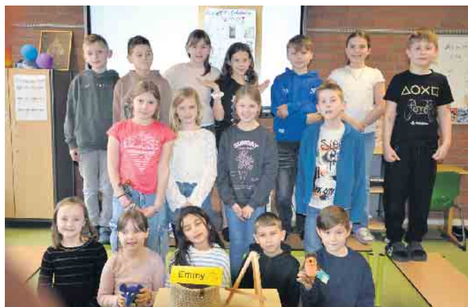
Immer noch vermisst die 3a der Donrather Aggertalschule ihr Maskottchen