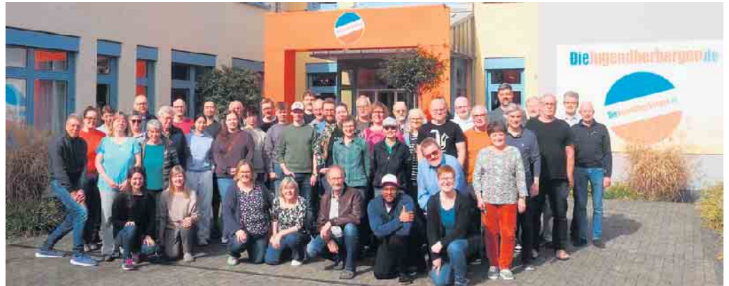
Das Lohmarer Blasorchester im Ahrtal