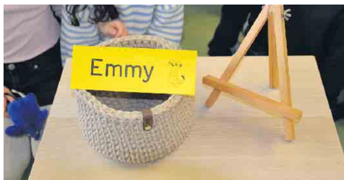
Wer immer etwas über den Aufenthalt von Emmy weiß, möge sich melden