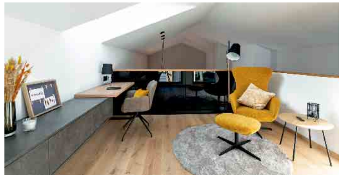
Ein multifunktionaler Arbeits- und Rückzugsort bietet sich etwa auf einer Galerie über dem offenen Küchen-, Ess- und Wohnbereich.

eine Chance: Auf das Wesentliche reduziert und funktional durchdacht helfen kleine Häuser, Kosten zu sparen, ohne Einbußen bei Wohnqualität und Gestaltung. „Die Fertigbauweise bietet hierzu optimale Voraussetzungen“, so Achim Hannott. Bundesverband Deutscher Fertigbau e.V.