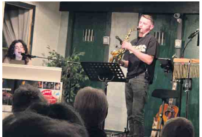
Wunderbares Duett.

Und genau das kam auch bei Pausengesprächen und nach dem Konzert mit den Besucher*innen zur Sprache. Man sieht unseren Verein eben als Mundartverein. Das Konzert war im Untertitel angekündigt als „Kölsche Kamelle