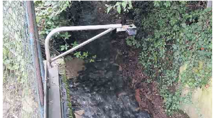
Kleiner Sensor, große Wirkung: Die Pegelmessstelle am Auelsbach hinter dem Rathaus

kann gleichzeitig wichtige Grundlagen für zukünftige Umwelt- und Klimaschutzmaßnahmen sowie den Hochwasserschutz schaffen. Alle Pegelsensoren übertragen ihre Messwerte über das LoRaWAN-Funknetzwerk direkt an die städtische Datenplattform. Dadurch stehen der Verwaltung sowie der Öffentlichkeit nun kontinuierlich aktuelle Wasserstandsinformationen zur Verfügung. Das Dashboard der Pegel-Sensoren ist ab sofort für alle Interessierten einsehbar unter: www.Lohmar.de/Sensorik .