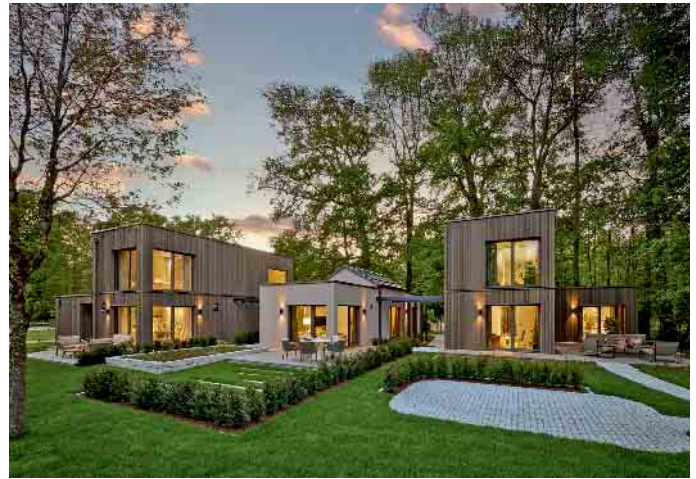
Kleine Fertighäuser überzeugen mit klarer Architektur, effizienter Bauweise und einer ansprechenden Optik.

Auch ein kleines Fertighaus kann sich langfristig an wechselnde Lebensumstände anpassen. Denn Barrierefreiheit und ein altersgerechter Umbau lassen sich sinnvoll umsetzen. Bei kleinen Grundrissen ist es entscheidend, die