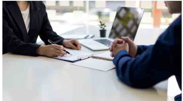
Die Frage nach den Bestattungskosten sollte von Beginn an geklärt und schriftlich festgehalten werden.

Wie können Hinterbliebene sicher sein, dass sie einen angemessenen Preis bezahlen, die Kostenaufstellung transparent und die Beratung fachlich kompetent ist? Der Bundesverband Deutscher Bestatter (BDB) weist darauf hin, dass Menschen im Sterbefall auf