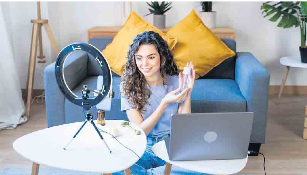
Jederzeit nah beim Kunden: Neben der persönlichen Beratung gewinnen digitale Formate, virtuelle Verkaufspartys oder Video-Tutorials im Direktvertrieb stark an Bedeutung.

Im Direktvertrieb bieten sich vielfältige Karrierechancen mit hoher Flexibilität