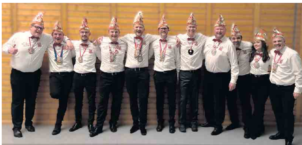
Eine sichtbar glückliche Bande, die dieses Jahr die Sitzungen gerockt hat!

Die Karnevalsgesellschaft ist stolz darauf, dass auch dieser Schritt wieder durchweg positiv von Mitgliedern und Gästen aufgenommen wurde. Der KAZI soll ein Ort der Vielfalt und des Miteinanders bleiben. Denn nur so kann die Zukunft des Karnevals gesichert und auch weiterhin mit viel Freude und Begeisterung gefeiert werden.