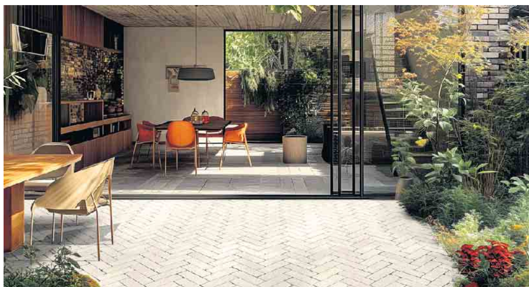
Nachhaltig geplant und gebaut: Versickerungsfähige Pflasterbefestigungen tragen zu einem besseren Regenwassermanagement in Siedlungsbereichen bei.

Unter www.betonstein.org etwa gibt es weitere Informationen zu versickerungsfähigen Pflastersteinen. Doch nicht nur in dieser Hinsicht ist Betonstein nachhaltig: Die dezentrale Fertigung mit kurzen Transportwegen, die Langlebigkeit sowie ein hoher Recyclinganteil machen das Baumaterial ökologisch attraktiv. Zudem bietet es vielfältige Möglichkeiten für die Gestaltung des Gartens, von der Pflasterung über Trockenmauern bis hin zur Pflanzelementen. (DJD)