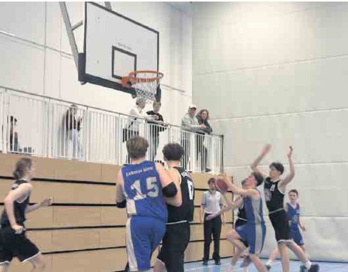
U16.2 in Hennef