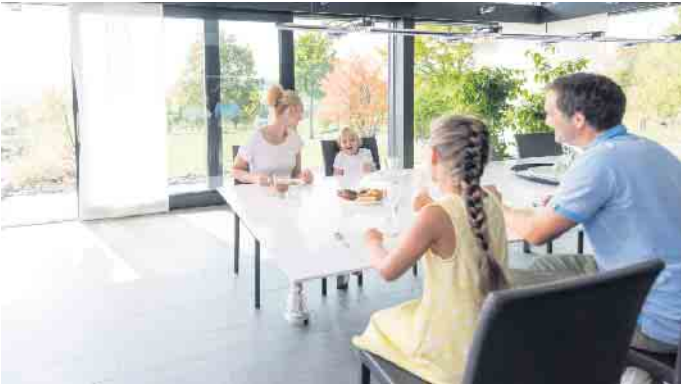
Wohnen mit Durchblick: Glas ist aus der modernen Architektur nicht wegzudenken - auch als Gestaltungsmittel im Innenausbau.

Glas im Innenausbau verleiht Räumen eine transparente, helle Atmosphäre