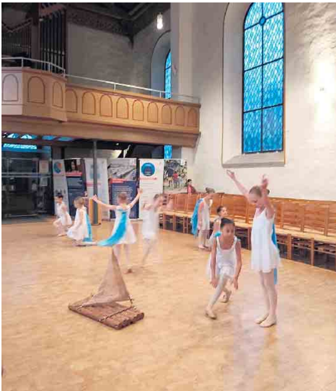
Tanz der Ballettschule im Hofgarten