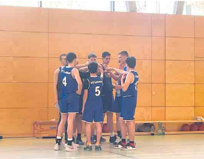
U16.1 in Deutz

In weiteren Spielen verlor die U12 gegen SG Köln-Worringen mit 65-73, die U14 beim TuS Zülpich mit 73-103, die U16.2 in Hennef mit 45-79 und die Herren 2 bei Post SV Bonn 3 mit 52-73.