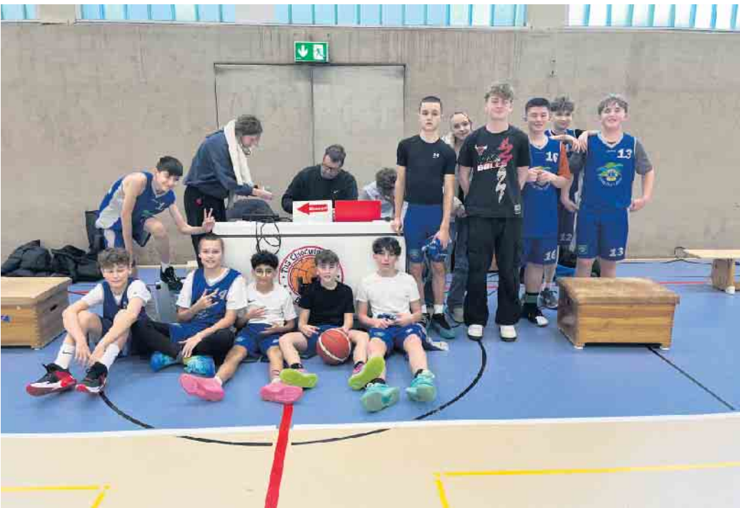
U14 in Zülpich

Die Herren 1 traten gegen die Troisdorfer LG zum nächsten Spiel gegen ein Team aus den unteren Tabellenregionen an.