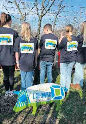
Einfach nicht zu übersehen: die SV der Gesamtschule

nicht nur an diesem einen Tag gilt. Einbezogen sind auch die Männer in der Pflege. Sie werden ange regert, ihre Aufmerksamkeit auch ganz gezielt auf Frauen zu lenken, da Gleichbehandlung sowie der Anspruch auf Gewaltfreiheit längst noch nicht in allen Lebens bereichen angekommen sind. Die Schülervvertretung der Ge samtschule Lohmar gibt sich ab