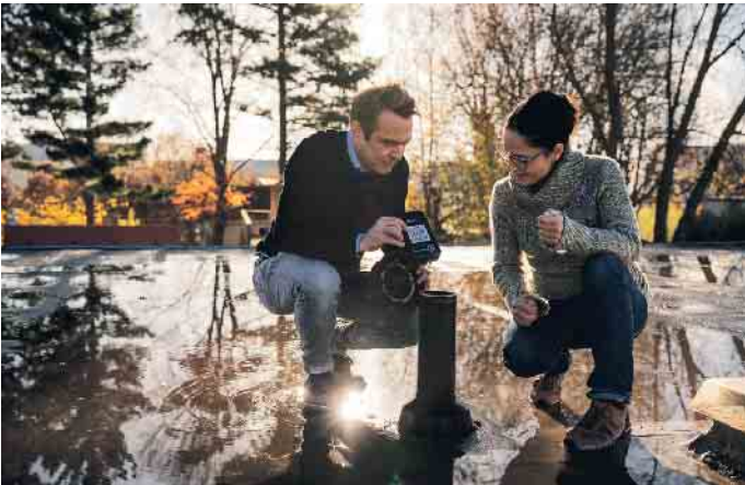
Intelligente Dachlösungen: Von Dachdeckern für Dachdecker entwickelt.

überwachen und bei Bedarf rechtzeitig Warnungen senden können. So kann zum Beispiel Feuchtigkeit in Flachdächern schnell entdeckt werden. Schäden frühzeitig zu erkennen und zu minimieren, sorgt für längere Haltbarkeit der