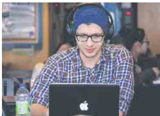
Bei der Lehrstellensuche spielt das Internet eine große Rolle.

nehmenskultur zu machen. Auch Tage der offenen Tür oder andere Events werden häufig über Online-Kanäle angekündigt und bieten die Chance, den Lehrbetrieb von innen kennenzulernen und sich mit anderen Lehrlingen auszutauschen. (wwp/audi-plus)