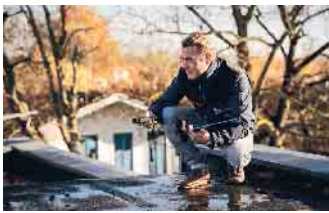
Sensoren überwachen Flachdächer und messen den Feuchtigkeitsgehalt.

ne Dächer, die sich zu einer nachhaltigen Alternative entwickelt haben. Bepflanzte Dächer sehen ansprechend aus, reduzieren die Umweltbelastung, bieten zusätzlich Wärmedämmung und verbessern die Luftqualität. Und: Dachbegrünungssysteme sorgen bei