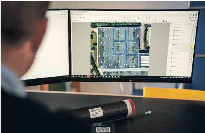
Die Überwachung erfolgt digital, bei kritischen Messwerten wird per Mail informiert.

Dächer und damit auch wieder für mehr Nachhaltigkeit. Schieferhammer und iPad Die Fortschritte im Dachdeckerhandwerk sind ein beeindruckendes Beispiel für ein sich ständig weiterentwickelndes Gewerk.