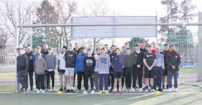
Die neuen Schiedsrichter mit Vertretern des Kreis-Schiedsrichter-Ausschusses bei ihrer Prüfung auf dem Platz des SV Menden

Neue Unparteiische für den Kreis Sieg! Der Kreis-Schiedsrichter-Ausschuss (KSA) hat auf seinem aktuellen Lehrgang für neue Schiedsrichter*innen 20 Neulinge auf der Anlage des SV Menden ausgebildet. Alle Teilnehmer der Prüfung