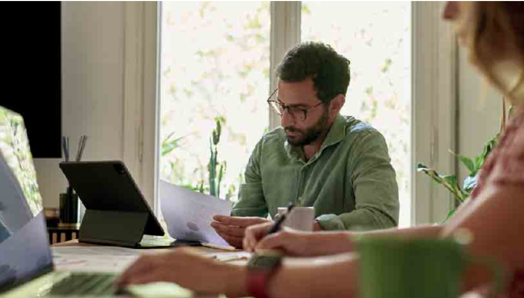
Schnelle und unkomplizierte Vermietung - das wünschen sich viele Vermieter:innen und Wohnungssuchende.

Die veränderte Arbeitsrealität steigert den Bedarf an flexiblem Wohnen auf Zeit. Denn: Jahrelang an ein und demselben Ort arbeiten - das war einmal. Heute setzen vor allem internationale Firmen vermehrt auf Agilität und entsenden ihre Mitarbeitenden weltweit. Für die Angestellten bedeutet das: neue Länder, neue Städte, neue Menschen. Und am Ende auch immer wieder eine neue Wohnung. Diese sogenannten Expats wollen keine langfristigen Mietverträge abschließen, sich auf unzählige Wartelisten setzen lassen oder ihre Wohnung erst komplett einrichten. Sie möchten schnell und unkompliziert einziehen und sich wohlfühlen können. Von Möblierung bis Vermarktung Obgleich diese temporäre Wohnform für Vermieter:innen großes