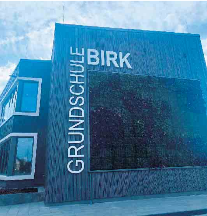
Die Fassade der GGS Birk

Ende: Aus der Arbeit der Parteien Bündnis90 / Die Grünen