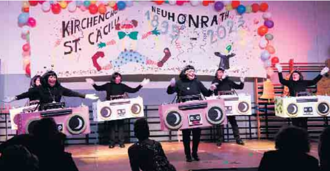
Radio Baach heizten die Stimmung richtig an.

Das Programm zum 130-jährigen Jubiläum ist bunt, witzig und lebendig