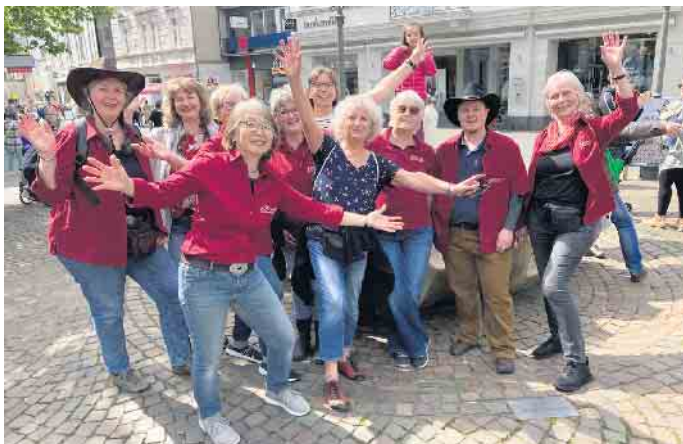
Teilnehmer*innen am Flashmob 2024

Save the Date - Termin für neue Einstieigergruppe steht