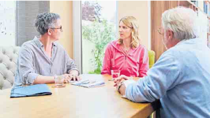
Hilfreich ist es, wenn ein fester Ansprechpartner oder eine Mentorin die ersten Schritte im neuen Job begleitet.