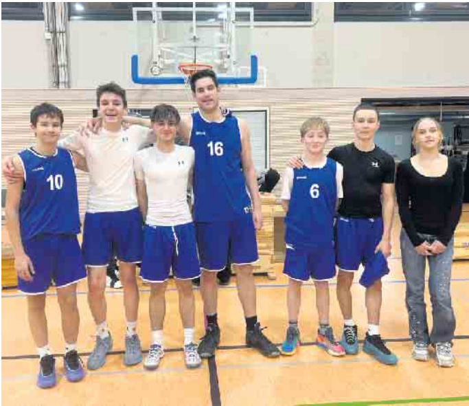
Das in Düsseldorf erfolgreiche Rumpfteam der U16.1