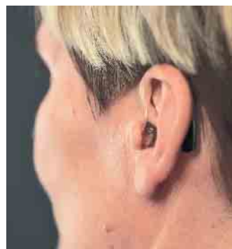
Hörsysteme können dafür sorgen, dass Menschen mit Hörverlust „geistig auf der Höhe“ bleiben.