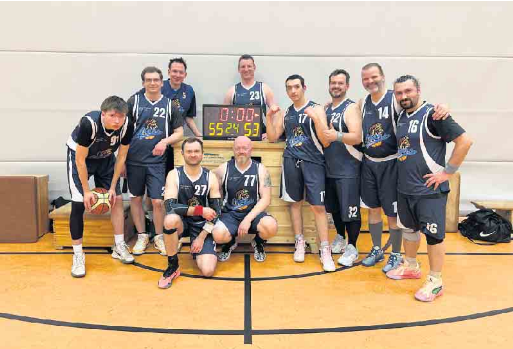
Herren 2 in (fast) voller Besetzung

In weiteren Spielen gewann die U12 gegen die Dragons Rhöndorf 3 mit 81-49, die U16.2 bei Düsseldorf 2 mit 83-72, die U18.1 verlor gegen BG Köln mit 50-74 und die U18.2 gegen BSV Roleber mit 61-74.