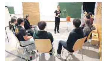
Auf Augenhöhe moderiert und motiviert: Das erste Lohmarer Jugendforum war ein Erfolg - nun müssen die Ideen in die Tat umgesetzt werden.

Jetzt kommt es darauf an, dass die Jugendlichen motiviert bleiben und möglichst noch mehr Freund*innen aktivieren, in Zusammenarbeit mit