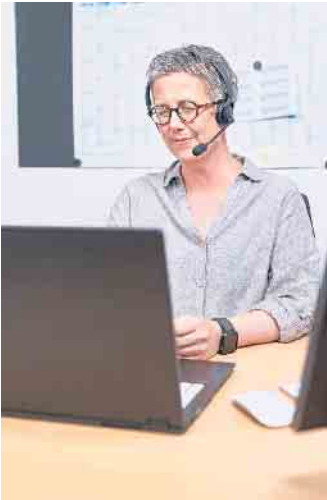
Schon am ersten Tag sollte ein fertig eingerichteter Arbeitsplatz zur Verfügung stehen.

tung gibt und dieser auch eingehalten wird“, rät Jana Wessel von der Pflegeberatung compass. „Ein professionell aufgestelltes Unternehmen kann hier detaillierte Auskünfte geben. Man sollte das wirklich thematisieren und gegebenenfalls auch genauer nachfragen.“