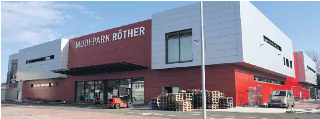
Neue Filiale in der Raiffeisenstra  e.

Shopping-Erlebnis m  gen und aus einem gro  en Angebot ihre Lieblingsst  cke ausw  hlen m  chten. Und nicht vier Sachen bestellen, um drei wieder zur  ckzuschicken.“ Die neue Filiale gegen  ber Kaufland ist montags bis samstags von 9 bis 20 Uhr ge  ffnet.