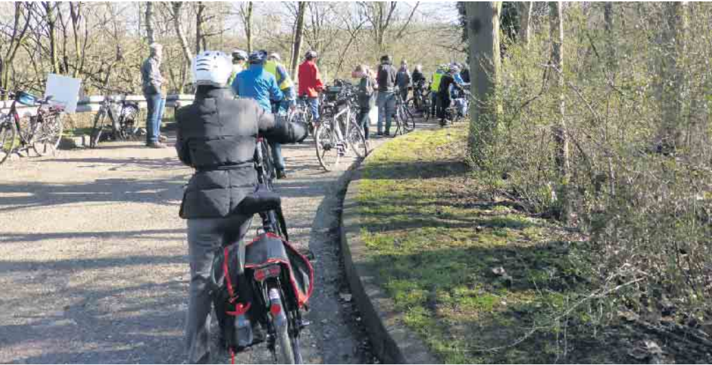
Aufbruch zur gemeinsamen Tour

zu diesem Radwegecheck eingeladen worden. Zusagen liegen bereits vor. Über eine rege Teilnahme auch aus der Bevölkerung freuen wir uns.