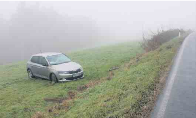
Skoda auf Grünfläche.

gegen den Opel-Fahrer ein: Nach einer Blutprobe erhärtete sich der Verdacht auf Drogenkonsum. Das Verfahren lautet auf fahrlässige Körperverletzung bei einem Verkehrsunfall, Fahren ohne Fahrerlaubnis und unter Drogeneinfluss.