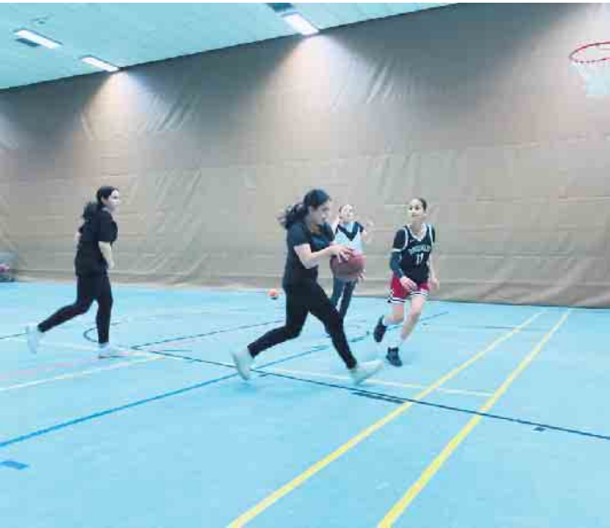
Frauentraining demnächst beim TV08 Lohmar

Basketball für Frauen hat durch die Olympischen Spiele in Paris einen Boom ausgelöst. Aber kaum ein Verein im Rhein-Sieg-Kreis bietet ein Training an. Jetzt endlich: Der Turnverein Lohmar startet ab dem 7. März 2025 mit einer Trainingszeit speziell nur für Frauen!