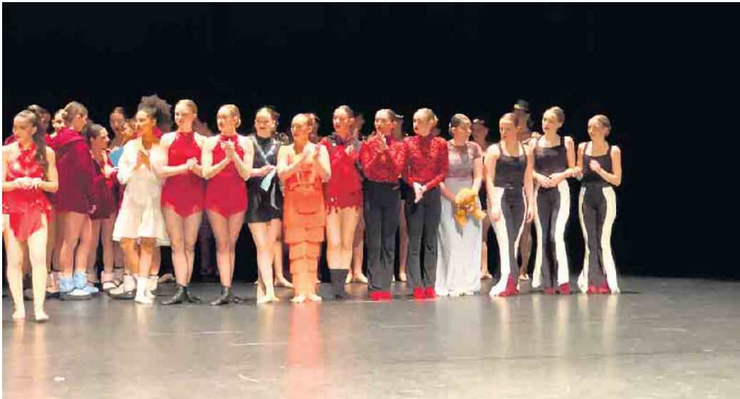
Siegerehrung Backyard Dance company

Der Regionalwettbewerb D and Netherlands Dance Competition ist eine großartige Gelegenheit für Kinder, Jugendliche und Erwachsene aus Ballettschulen, Tanzvereinen oder sonstigen Einrichtungen, die Ballettunterricht anbieten, ihr Können unter Beweis zu stellen. Professionelle Tänzer sind nicht zugelassen. Der Wettbewerb möchte Lehrern, Schülern und Eltern eine Plattform des gegenseitigen Kennenlernens bieten, verbunden mit einem fairen Wettbewerb für alle Altersstufen. Das Ziel ist es, die Kinder in ihrer Freude am Tanz zu motivieren, ihnen neue Eindrücke zu vermitteln und sie darin zu bestärken, das Tanzen zu lieben. Die besten Tänze der Regional-