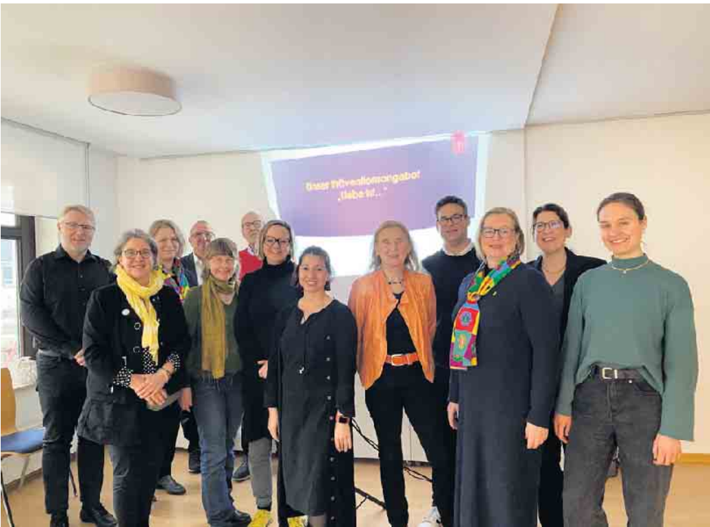
Das Team des Frauenzentrums und Mitglieder des Lions Club Rhein-Sieg

Dank der großzügigen Spende des Lions Clubs in Höhe von 3000 Euro können wir unser Präventionsangebot nun noch mehr Schulen im Rhein-Sieg-Kreis zugänglich machen. Viele Schulen ste-