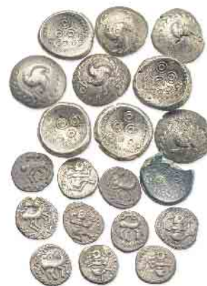
Auf den späteisenzeitlichen Münzen von der Wallanlage bei Lohmar-Neuhonrath sind gut die tanzenden Männlein und die drei Wirbel als Verzerrungen zu erkennen.

„Archäologie im Rheinland 2024“, 4. Februar bis 30. März LVR-LandesMuseum Bonn, Colmantstraße 14-16, 53115 Bonn, 1. OG.