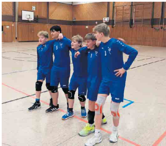
Platz drei und somit Bronze in der Rheinischen Meisterschaft für die m. Jugend U16 des TVW

Am Samstag fand die Rückrunde der U16-Faustballer des TVW im Forum Wahlscheid statt. Auf Platz drei liegend trafen die Jungs zunächst auf Spitzenreiter Bayer 04 Leverkusen - ein Gegner, der zumindest körperlich überlegen war. Davon ließen sich die Jungs teilweise einschüchtern, verloren den 1. Satz aber klar aufgrund eigener Unzulänglichkeiten. Nach kurzer Ansprache der verbesserungswürdigen Dinge funktionierte das Wahlscheider Faustballspiel in Satz zwei gleich viel besser - nicht zuletzt zur Begeisterung der Trainer und auch Eltern der Jungs. Dennoch gewann Bayer glatt in 0:2 Sätzen (2:11, 7:11). Gegen den Leichlinger TV II tat sich das Team zunächst schwer. Nach einer taktischen Umstellung zur Satzmitte konnte man sich aber vom Gegner lösen und den Auftaktsatz sicher 11:6 gewinnen. Das war augenscheinlich auch der ‚Brustlöser‘, denn im zweiten Satz