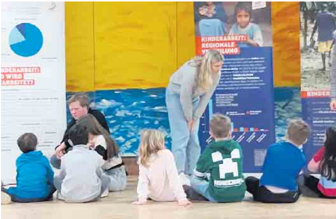
Gruppengespräch Q2 - kleine Parlamentarier