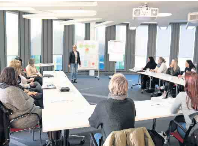
Zu einer guten Einarbeitung können auch Schulungen gehören, in denen Wichtiges über die Firma oder spezifische fachliche Anforderungen vermittelt werden.