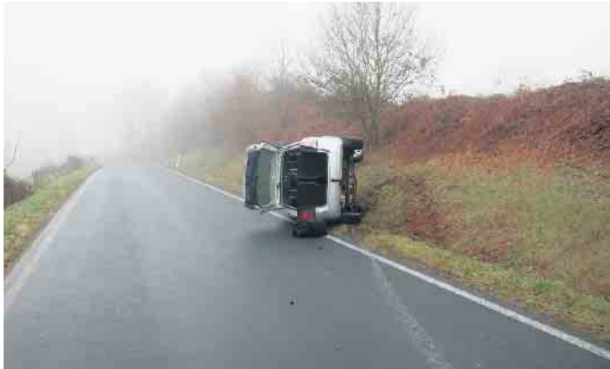
Opel auf linker Fahrzeugseite im Graben.