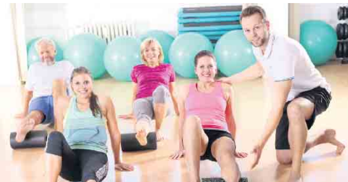
Faszientraining beim Aggertaler Gesundheitssport e.V.

weile einig, dass durch gezieltes Faszientraining Beschwerden wie Gelenk- oder Rückenschmerzen, Verspannungen, Taubheitsgefühl oder eingeschränkte Beweglichkeit verringert werden können. Der Kurs Faszientraining ist als Präventionsmaßnahme zertifiziert und wird bei regelmäßiger Teilnahme von den gesetzlichen Krankenkassen anteilig erstattet. Die Teilnehmerzahl ist begrenzt. Anmeldungen sind ab sofort möglich unter Telefon: 02246-9154257.