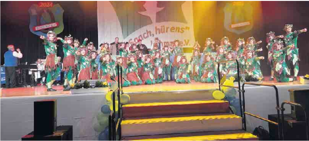
Showtanzgruppe Dance Emotions

Ganz neu für Lohmar war der folgende Programmpunkt, das „Hed-