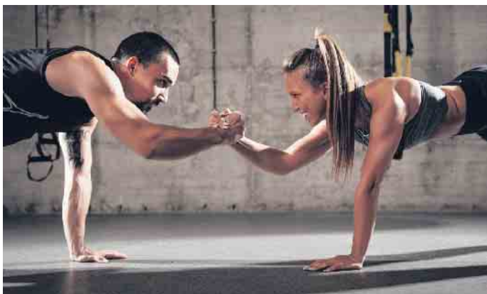
Functional Training mit dem Aggertaler Gesundheitssport e.V.

on optimiert. Mit komplexen Übungen wird der Körper auf alltägliche Bewegungsanforderungen trainiert. Der Kurs richtet sich an gesunde Erwachsene, Einsteiger und Wiedereinsteiger mit speziellen Risiken im Muskel-Skelettsystem (z.B. überwiegend sitzender Tätigkeit) jeweils ohne behandlungsbedürftige Erkrankungen. Die Teilnehmerzahl ist begrenzt. Anmeldungen sind ab sofort möglich unter Telefon: 02246-9154257