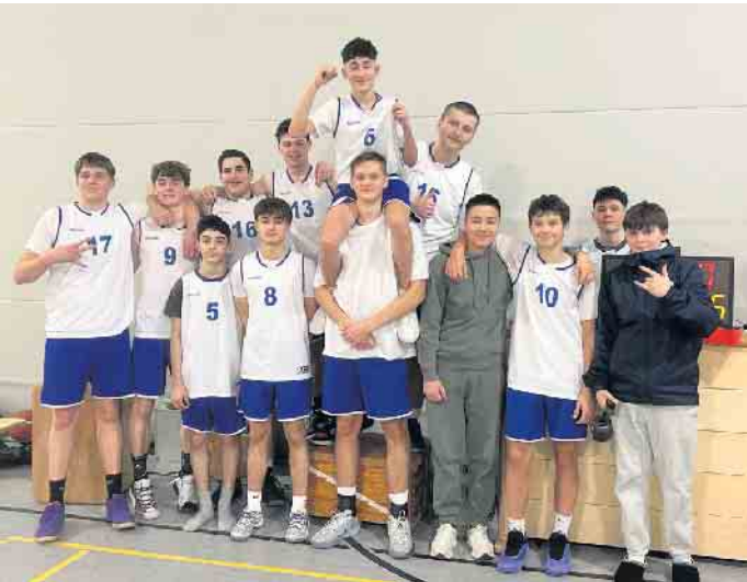
U16.1 als Tabellenführer