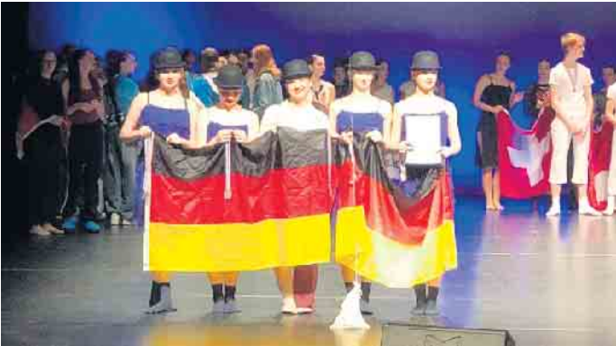
Die erfolgreiche Small Group des JMDClub