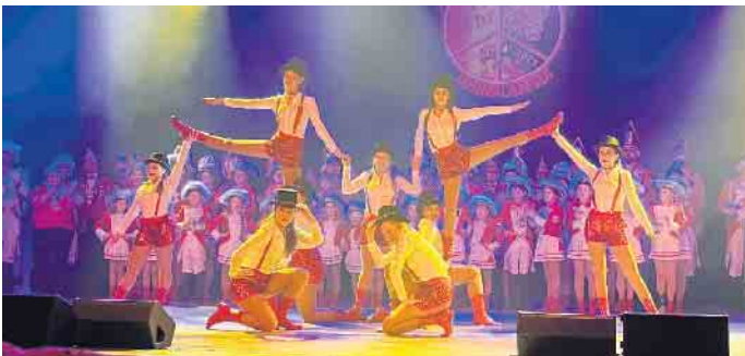
Highlights auf der Bühne.