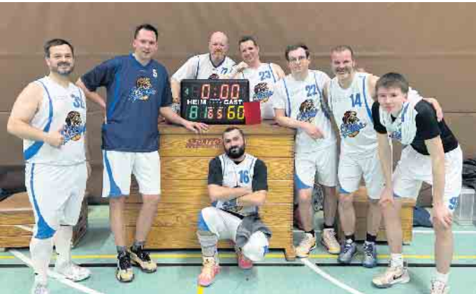
Die Herren 2 mit ihren neuen Spielern