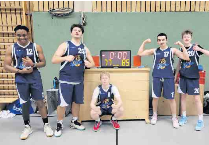
U18.1 nach dem Erfolg

pich mit 46-100, die U16.2 gegen Hennef 2 mit 51-65 und die Herren 2 gewinnt gegen Rheinbach 2 mit 81-60.