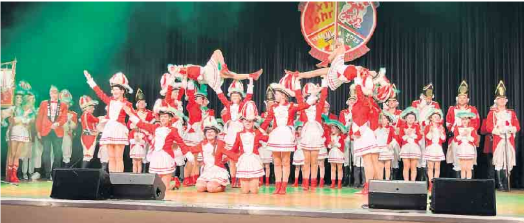
Tanzspaß bei der Karnevalsparty.