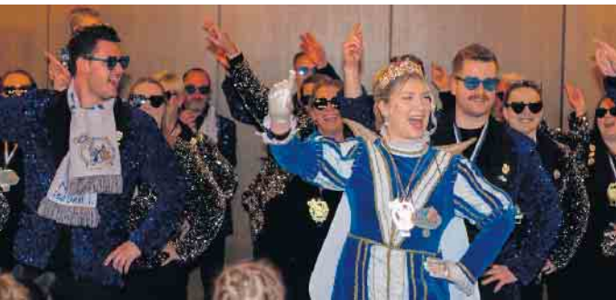
Tanzendes Prinzenpaar mit glitzerndem Gefolge