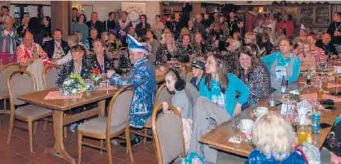
Der gefüllte Saal

Am Sonntagnachmittag, 26. Januar, fand im Saal Fielenbach die traditionelle Prinzengratulation des Ortsring Birk e.V. statt.