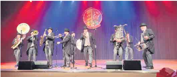
Ratsherren in Aktion.

Inh.: André Decker Tel.: 02246 - 5556 Öffnungszeiten: Frouardplatz 8 info@alt-lohmar.de Mo-So: 11:30-13:30 Uhr 53797 Lohmar www.alt-lohmar.de Do-So: 17:30 - 21:30 Uhr