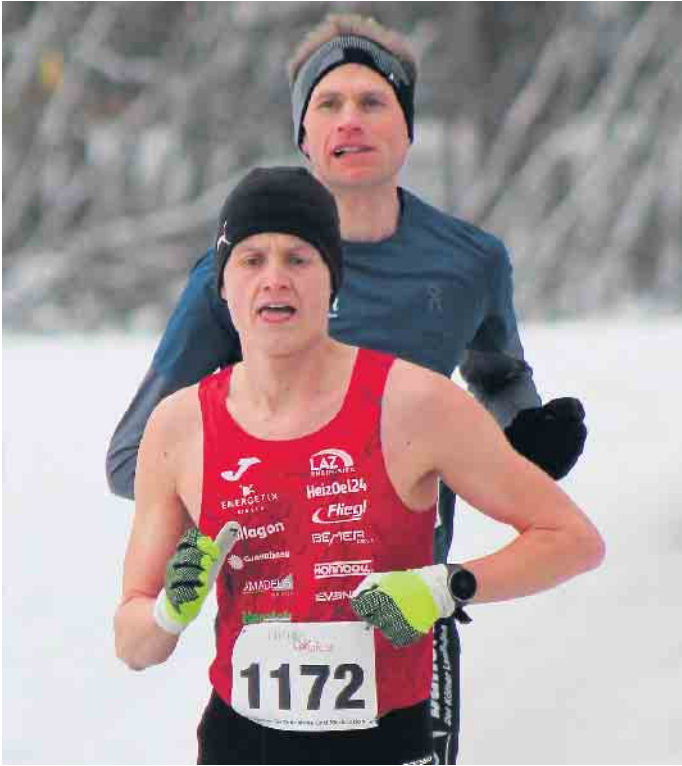
Luke Kelly 2. auf Eis und Schnee in Porz

für den Opel Grandland Enjoy, 1.2 Direct Injection Turbo, 96 kW (130 PS) Start/Stop, Euro 6 Manuelles 6-Gang-Getriebe, Betriebsart: Benzin