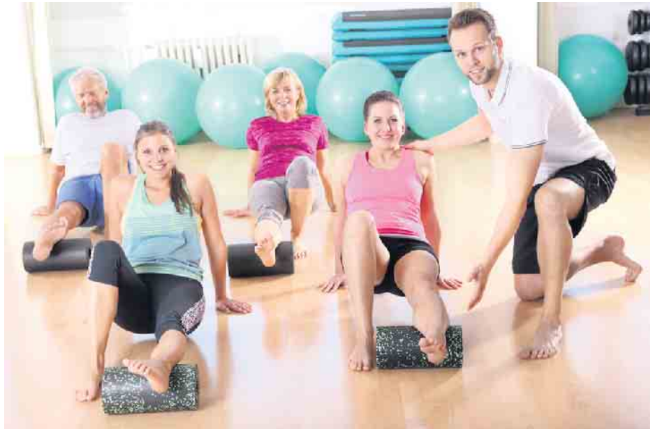
Faszientraining beim Aggertaler Gesundheitssport e.V.

Die Teilnehmerzahl ist begrenzt. Anmeldungen sind ab sofort möglich unter Telefon: 02246-9154257.