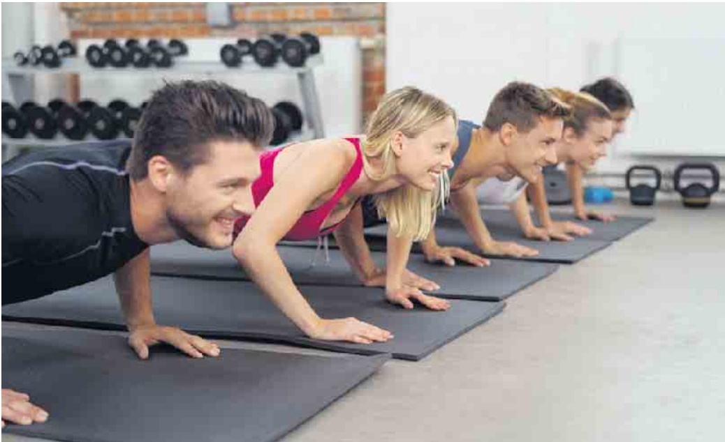
Functional Training mit dem Aggertaler Gesundheitssport e.V.

Der Aggertaler Gesundheitssport e.V., In der Hühene 95 in Lohmar, bietet ab 15. März immer freitags um 17 Uhr den Kurs Functional Training an. Ein weiterer Kurs startet montags ab 18. März um 9 Uhr. Im Kurs „Functional Training“ liegt der Fokus auf der Verbesserung der Bewegungs- und Wahrnehmungsfähigkeit sowie der Aktivität und Gesundheit. Trainiert wird mit dem eigenen Körpergewicht. Dadurch werden vor allem Kraft und auch Koordination optimiert. Mit komplexen Übungen wird der Körper auf alltägliche Bewegungsanforderungen trainiert. Der Kurs richtet sich an gesunde Erwachsene, Einsteiger und Wiedereinsteiger mit speziellen Risiken im Muskel-Skelettsystem (z.B. überwiegend sitzender Tätigkeit) jeweils ohne behandlungsbedürftige Erkrankungen. Die Teilnehmerzahl ist begrenzt. Anmeldungen sind ab sofort möglich unter Telefon: 02246-9154257.