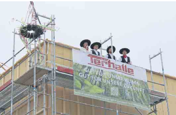
„Kamerad, schenk ein“ - Der Richtkranz wurde angebracht und die Zimmerer sprachen den Richtspruch.

halb des zukünftigen Schulgebäudes mit Essen und Getränken. Die Bauarbeiten sind im Wesentlichen im Zeitplan: Die Fertigstellung der neuen Grundschule ist auch weiterhin für nach den Herbstferien 2024 geplant. Die Kostenprognose sieht zurzeit eine Erhöhung von unter 0,5 Prozent des Hauptauftrages vor. Diese sehr moderate Erhöhung ist im Wesentlichen in der Anpassung der funktionalen Leistungsbeschreibung im laufenden Baubetrieb und dem Fortschreiten der Ausführung geschuldet.