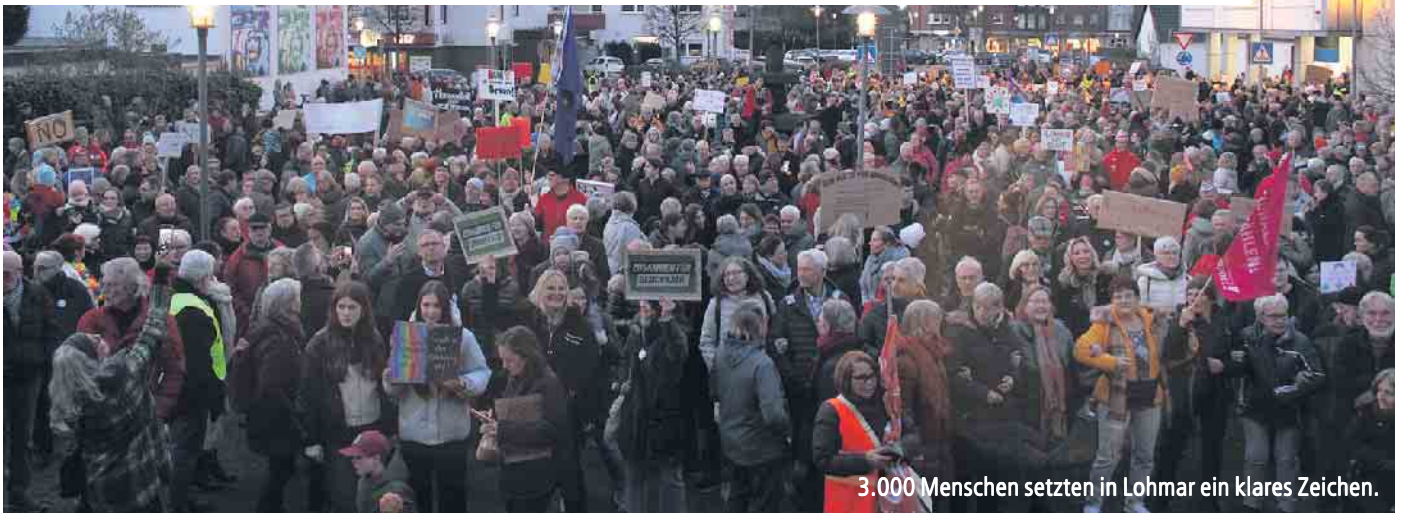
3.000 Menschen setzten in Lohmar ein klares Zeichen.