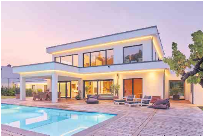
„Die Bauhausarchitektur ist Ausdruck von Individualität und Stilsicherheit.“

In Neubaugebieten tauchen in den letzten Jahren wieder vermehrt Häuser mit kubischen Formen und Flachdach auf. In ihrer Geradlinigkeit erinnern sie an die Architektursprache des Bauhauses. Ergänzt durch exklusive Ausstattungs- und Gestaltungsdetails wie eine große Fensterfront oder eine Dachterrasse stechen diese kubischen Häuser in so mancher Nachbarschaft eindrucksvoll hervor. Für den Holz-Fertigbau waren die Ideen von Bauhaus-Gründer Walter Gropius nicht nur architektonisch prägend: schlichter Funktionalismus und Rationalität sowie die Kombination aus kunstvollen Gestaltungsideen und standardisierten Bauteilen aus seriellen Produktionsverfahren - eine Mischung, die sich die Fertighausbranche bis heute zunutze macht, um individuelle Häuser nach einem Setzkastenprinzip zu entwerfen. Dabei wird der Setzkasten immer größer und vielfältiger. „Die Bauhausarchitektur ist nur eine von vielen Planungsgrundlagen, auf der Fertighaus-Bauherren ihre persönlichen Wünsche