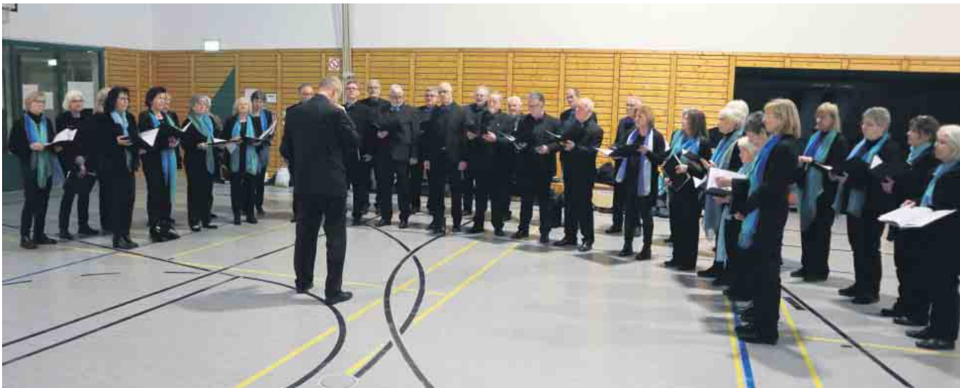
Einsingen vor dem Konzert. Foto Singgemeinschaft“

Chor dankt der Fa. Dr. Starck für die Unterstützung